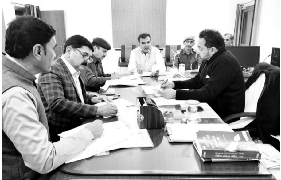
राजस्थान राज्य विधिक सेवा प्राधिकरण जयपुर के निर्देशानुसार विचाराधीन बंदियों के संबंध में अंडर ट्रायल रिव्यू कमेटी पाली की बैठक हुई।