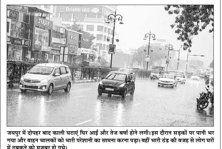
जयपुर में दोपहर बाद काली घटाएं घिर आईं और तेज वर्षा होने लगी। इस दौरान सड़कों पर पानी भर गया और वाहन चालकों को भारी परेशानी का सामना करना पड़ा। वहीं भारी ठंड की वजह से लोग घरों में दुबकने को मजबूर हो गये।