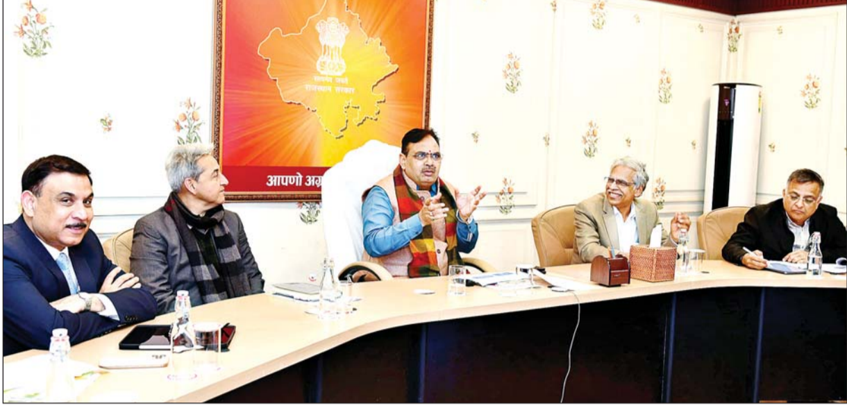
मुख्यमंत्री भजनलाल शर्मा ने मुख्यमंत्री कार्यालय में राजजिंग राजस्थान ग्लोबल इन्वेस्टमेंट समिट के तहत ऊर्जा विभाग द्वारा हुए एमओयू के क्रियान्वयन के संबंध में आयोजित समीक्षा बैठक में अधिकारियों को प्रोजेक्ट्स की नियमित मॉनिटरिंग करने के निर्देश दिए।

जयपुर, 15 जनवरी। मुख्यमंत्री भजनलाल शर्मा ने कहा कि राज्य सरकार वर्ष 2027 तक प्रदेश को ऊर्जा में आत्मनिर्भर बनाने तथा किसानों को दिन में बिजली उपलब्ध कराने के लक्ष्य के साथ काम कर रही है। इसी क्रम में, राजजिंग राजस्थान के तहत ऊर्जा क्षेत्र में सर्वाधिक एमओयू किए गए हैं, जिससे राज्य में ऊर्जा सुदृढीकरण को गति मिलेगी। उन्होंने अधिकारियों को निर्देश दिए कि प्रदेश में विद्युत आपूर्ति के लिए हुए इन विभिन्न एमओयू को समयबद्ध रूप से पूरा किया जाए। शर्मा बुधवार को मुख्यमंत्री कार्यालय में राजजिंग राजस्थान ग्लोबल इन्वेस्टमेंट समिट के तहत ऊर्जा विभाग द्वारा हुए एमओयू के क्रियान्वयन के संबंध में आयोजित समीक्षा बैठक की अध्यक्षता कर रहे थे। उन्होंने अधिकारियों को इन प्रोजेक्ट्स की नियमित मॉनिटरिंग करने के निर्देश दिए। उन्होंने कहा कि राज्य में आए प्रत्येक निवेशक को राज्य में निवेश