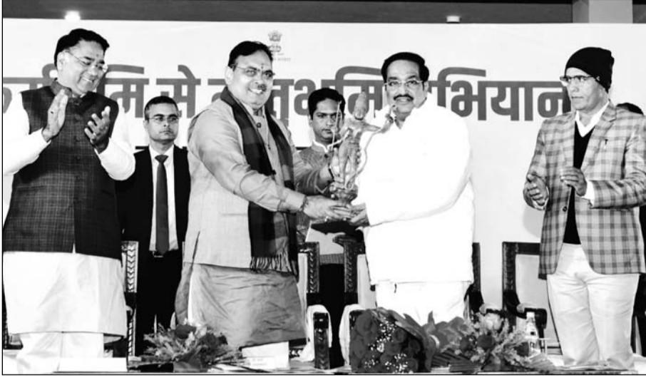
कर्मभूमि से मातृभूमि अभियान के अंतर्गत सांगानेर में मुख्यमंत्री भजनलाल शर्मा ने केंद्रीय जलशक्ति मंत्री सी.आर. पाटिल का स्वागत किया।

जयपुर। केंद्रीय जलशक्ति मंत्री सी. आर. पाटिल ने कहा है कि वह दिन दूर नहीं जब प्रधानमंत्री नरेन्द्र मोदी के नेतृत्व में राजस्थान सबसे अधिक पानी वाला राज्य होगा। उन्होंने कहा कि प्रधानमंत्री नरेन्द्र मोदी के नेतृत्व में केंद्र सरकार और मुख्यमंत्री भजनलाल शर्मा के नेतृत्व में राज्य सरकार ने प्रदेश को जल आत्मनिर्भर बनाने के लिए महत्वपूर्ण प्रयास किए हैं। उन्होंने कहा कि आमजन भी जल की एक-एक बूंद के महत्व को समझते हुए जल संचय में जुड़े, इस उद्देश्य से शुरू किया गया कर्मभूमि से मातृभूमि अभियान अब एक जन आंदोलन का रूप लेता जा रहा है।