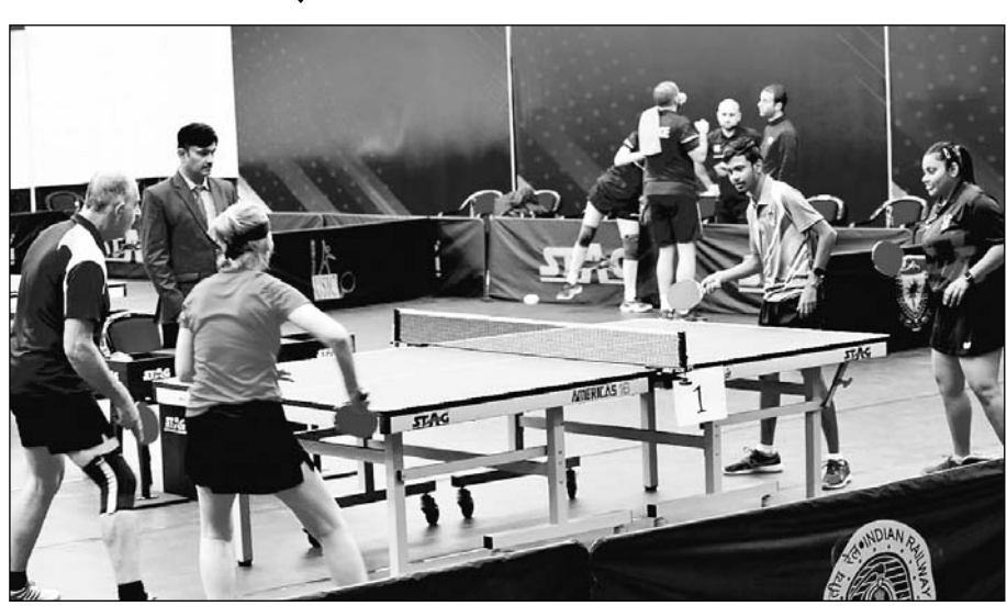
उत्तर-पश्चिम रेलवे खेलकूद संघ, जयपुर की ओर से आयोजित यूएसआईसी वर्ल्ड रेलवे टेबल टेनिस चैंपियनशिप प्रतियोगिता में देशी-विदेशी टीमों ने भाग लिया।

जयपुर, (का.सं.)। रेलवे स्पोर्ट्स प्रमोशन बोर्ड, नई दिल्ली के तत्वाधान में उत्तर पश्चिम रेलवे खेलकूद संघ, जयपुर द्वारा आयोजित यूएसआईसी वर्ल्ड रेलवे टेबल टेनिस चैंपियनशिप प्रतियोगिता 2022 में भारतीय खिलाड़ियों का दबदबा कायम रहा एवं पुरुष, महिला तथा मिश्रित युगल के फाइनल में जगह बनाई है।