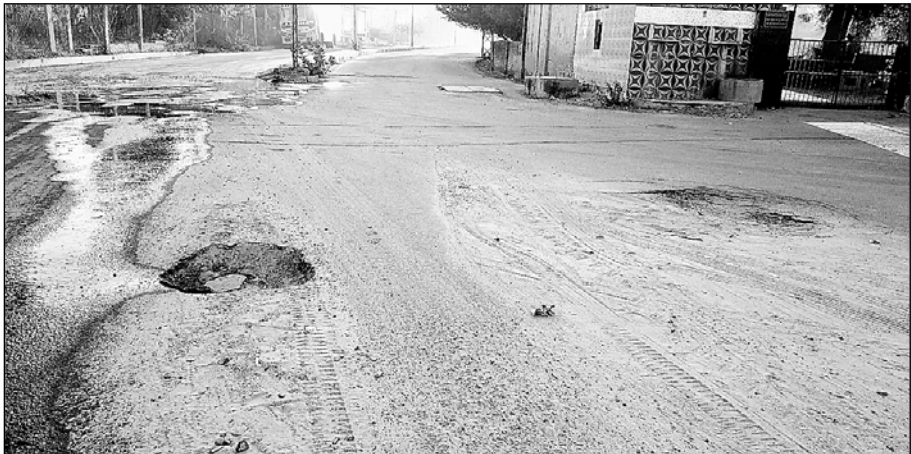
सांभर के गौरव पथ पर पिछले 6 माह से गहरे गड्ढे दुर्घटना को न्योता दे रहे हैं।

सांभरझील, (निस)। पर्यटक नगरी का दर्जा प्राप्त सांभर उपखंड मुख्यालय के प्रमुख रास्ते वाहन चालकों व राहगीरों के लिए बेहद कठिन साबित हो रहे हैं। विगत 20 दशकों में पालिका प्रशासन की ओर से लाखों रुपए खर्च कर सीसी सड़कें बनाई जा चुकी हैं लेकिन देखने में प्रायः आया है कि जब भी सड़कें क्षतिग्रस्त हो जाती हैं तो उन्हें ठीक करवाने के लिए कोई ठोस कदम नहीं उठाए जाते हैं। सड़कों की खस्ताहाल व्यवस्था को दुरुस्त करवाने के लिए जनप्रतिनिधियों की भूमिका भी निष्क्रिय बनी हुई है। टूटी फूटी सड़कों से गुजरने वाले वाहन चालकों के लिए यह सफर आसान नहीं है। इसकी वजह से अनेक दफा दुर्घटना के मामले भी