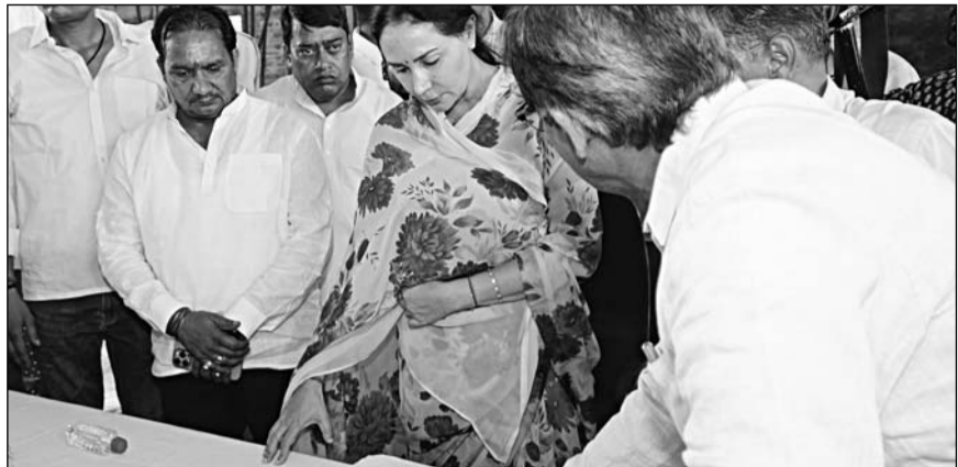
उपमुख्यमंत्री दिया कुमारी ने हॉस्पिटल का निरीक्षण कर निर्माण कार्यों की प्रगति का जायजा लिया।

जयपुर। उपमुख्यमंत्री दिया कुमारी ने बुधवार को 'प्रगति पथ यात्रा' कार्यक्रम के अंतर्गत विद्याधर नगर विधानसभा क्षेत्र में निर्माणाधीन सैटेलाइट हॉस्पिटल का निरीक्षण कर निर्माण कार्यों की प्रगति का जायजा लिया। इस दौरान उन्होंने संबंधित अधिकारियों को निर्माण कार्यों में