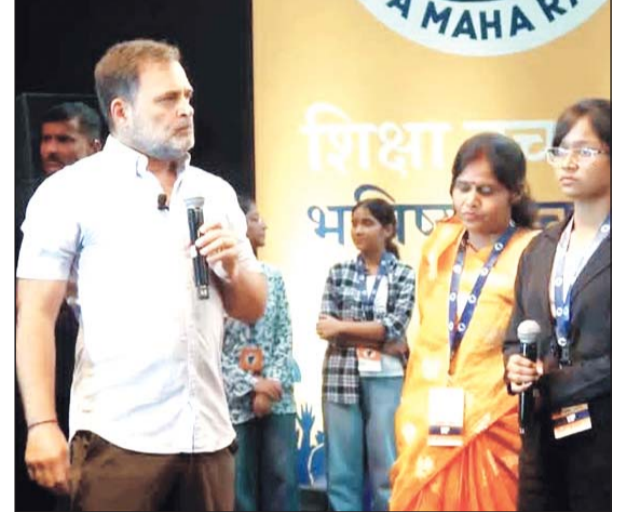
कांग्रेस के वरिष्ठ नेता राहुल गांधी ने कोटा के दशहरा मैदान से पेपर लोक मामले में छात्रों से संवाद अभियान की शुरुआत की है।

मध्यम से इसकी जानकारी दी। जारी सलाह के अनुसार, भारतीय नागरिक और सैन्य विमानों के लिए पाकिस्तानी हवाई क्षेत्र का उपयोग प्रतिबंधित रहेगा। नया प्रतिबंध 16 जून को शाम से प्रभावी होकर 24 जुलाई को जारी नोटिस टू एयरमैन (नोटम) के