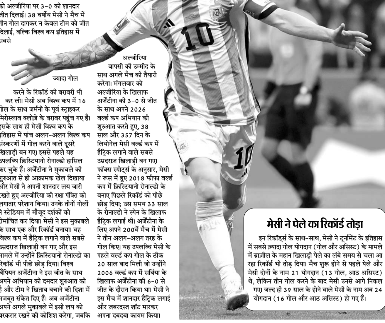
अल्जीरिया वापसी की उम्मीद के साथ अगले मैच की तैयारी करेगा। मंगलवार को अल्जीरिया के खिलाफ अर्जेंटीना की 3-0 से जीत के साथ अपने 2026 वर्ल्ड कप अभियान की शुरुआत करते हुए, 38 साल और 357 दिन के लियोनेल मेसी वर्ल्ड कप में हैट्रिक लगाने वाले सबसे उम्रदराज खिलाड़ी बन गए। फॉक्स स्पोर्ट्स के अनुसार, मेसी ने रूस में हुए 2018 फीफा वर्ल्ड कप में क्रिस्टियानो रोनाल्डो के बनाए पिछले रिकॉर्ड को पीछे छोड़ दिया; उस समय 33 साल के रोनाल्डो ने स्पेन के खिलाफ हैट्रिक लगाई थी। अर्जेंटीना के लिए अपने 200वें मैच में मेसी ने तीन अलग-अलग तरह के गोल किए। यह उपलब्धि मेसी के पहले वर्ल्ड कप गोल के ठीक 20 साल बाद मिली जो उन्होंने 2006 वर्ल्ड कप में सर्बिया के खिलाफ अर्जेंटीना की 6-0 से जीत के दौरान किया था। मेसी ने इस मैच में शानदार हैट्रिक लगाई और जबरदस्त शॉट मारकर अपना दबदबा कायम किया।

मेसी ने पेले का रिकॉर्ड तोड़ा इन रिकॉर्ड्स के साथ-साथ, मेसी ने टूर्नामेंट के इतिहास में सबसे ज्यादा गोल योगदान (गोल और असिस्ट) के मामले में ब्राजील के महान खिलाड़ी पेले का लंबे समय से चला आ रहा रिकॉर्ड भी तोड़ दिया। मैच शुरू होने से पहले पेले और मेसी दोनों के नाम 21 योगदान (13 गोल, आठ असिस्ट) थे, लेकिन तीन गोल करने के बाद मेसी उनसे आगे निकल गए। जल्द ही 39 साल के होने वाले मेसी के नाम अब 24 योगदान (16 गोल और आठ असिस्ट) हो गए हैं।