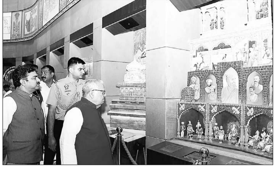
राज्यपाल कलराज मिश्र ने मंगलवार को नवीन संसद भवन का अवलोकन किया।

जयपुर, (का.सं.)। राज्यपाल कलराज मिश्र मंगलवार को लोकसभा पहुंचे। वहां उन्होंने लोकसभा अध्यक्ष ओम बिड़ला से मुलाकात की। मुलाकात के दौरान दोनों ने संविधान संस्कृति और जीवन मूल्यों से जुड़े विभिन्न विषयों पर चर्चा की। बाद में उन्होंने नवीन संसद भवन भी देखा। वहीं बाद में राज्यपाल मिश्र ने पूर्व राष्ट्रपति राम नाथ कोविंद से उनके निवास स्थान पर पहुंचकर मुलाकात की। इस दौरान दोनों ने विभिन्न संवैधानिक और राष्ट्र हित से जुड़े मुद्दों पर चर्चा की। दोनों की यह शिष्टाचार भेंट थी।