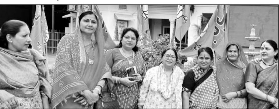
करोली महिला मोर्चा की पदाधिकारी लोकसभा चुनाव प्रचार के लिए हुई रवाना।