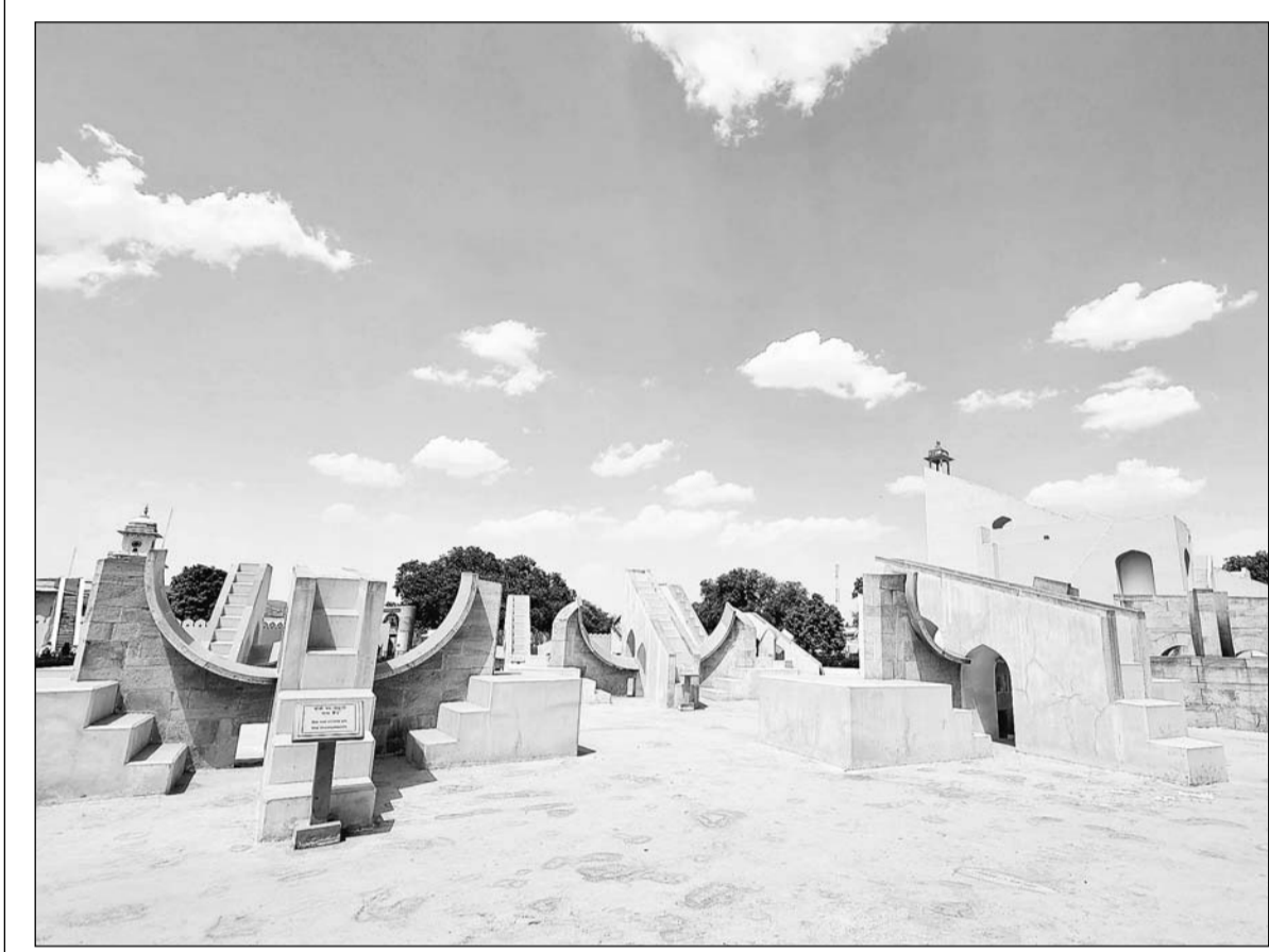
मौसम विभाग ने आगामी तीन दिन तापमान में बढ़ोतरी के साथ हीट वेव की चेतावनी जारी की है। अभी मौसम शुष्क होने से गर्मी में सब जगह सुना-सूना नजर आ रहा है। जंतर-मंतर जो हमेशा पर्यटकों की आवाजाही से गुलजार रहता था, मंगलवार को खाली-खाली नजर आ रहा है।