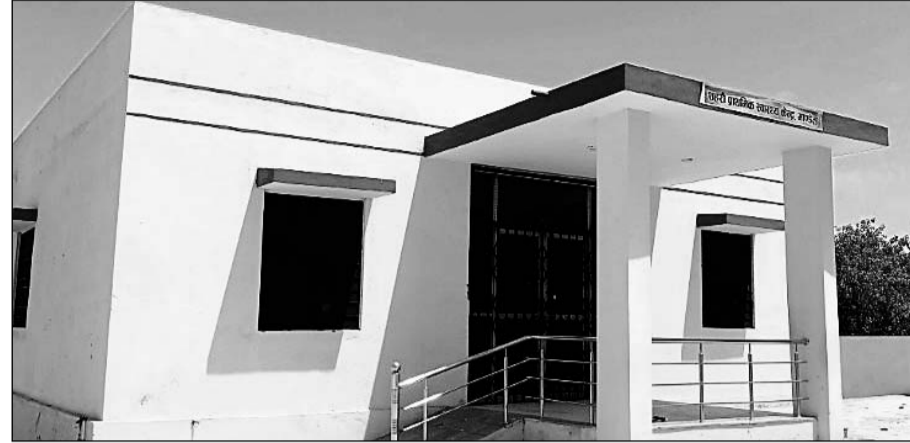
माण्डेता स्थित अस्पताल का नव निर्मित भवन।

जानकारी के अनुसार 28 सितम्बर 2023 को जब इस नव निर्मित भवन का उद्घाटन किया गया था, किराये की इमारत से यहां पर यूपीएचसी शिफ्ट होनी थी। उद्घाटन के दौरान विधायक मनोज मेघवाल ने 6 बँड का एक बँड उपरी मंजिल पर बनाने की घोषणा भी की थी, लेकिन करीब दो साल के समय से यू.पी.एच.सी. मॉडेटा में डॉक्टर का