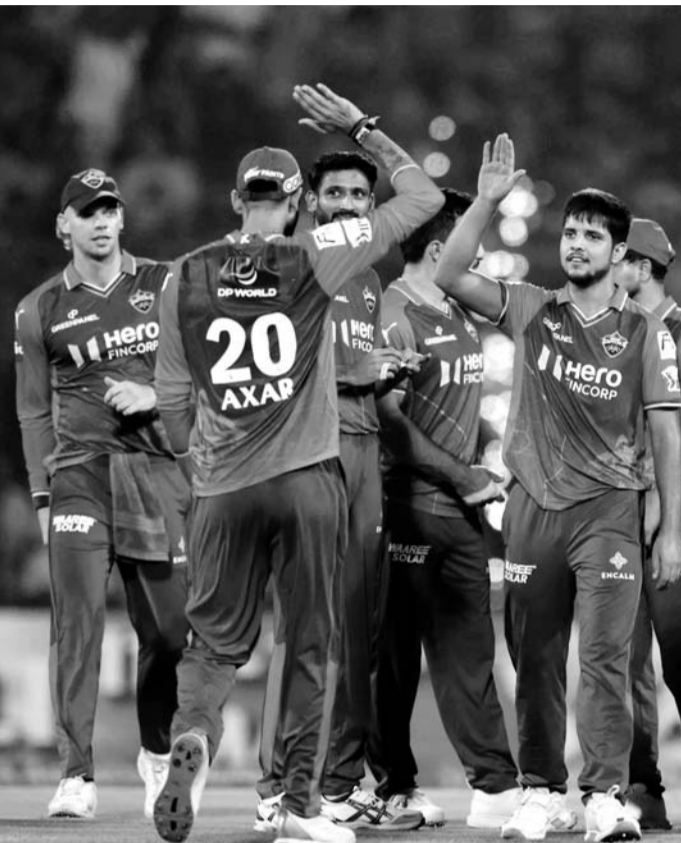
रणों का लक्ष्य दिया है। आज यहां अरुण जेटली स्टेडियम में राजस्थान रॉयल्स के

दिल्ली से ओपनर जैक फ्रेजर-मैगर्क (50 रन) और अभिषेक पारेल (65 रन) ने अर्धशतक जमाए। ट्रिस्टन स्टक्स ने 41 रन बनाए। राजस्थान से रविचंद्रन अश्विन ने 3 विकेट चटकाए। युजुवेंद्र चहल, संदीप शर्मा और ट्रेट बोल्ट को एक-एक विकेट मिला। अभिषेक पारेल (65) और जैक फ्रेजर-मकाक (50) रनों की बेहतरीन पारियों के दम पर दिल्ली कैपिटल्स ने मंगलवार को इंडियन प्रीमियर लीग (आईपीएल) के 56वें मुकाबले में राजस्थान रॉयल्स को जीत के लिए 222