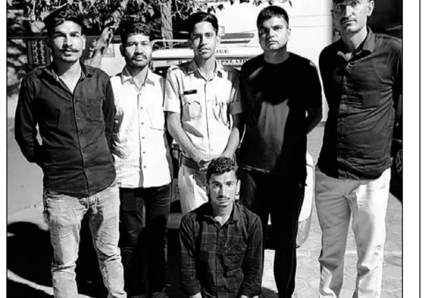
पुलिस ने नकली विग लगाकर परीक्षा देने वाले को गिरफ्तार किया।

■ आरोपी की गिरफ्तारी के बाद नकल के कई मामलों का खुलासा होने की उम्मीद