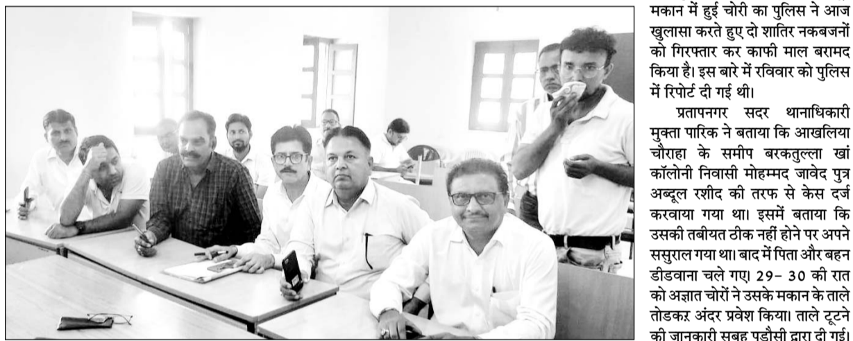
जालोर में चिकित्सा कर्मचारी संयुक्त समन्वय समिति का दल पी.एम.ओ. से वार्ता करने पहुंचा।