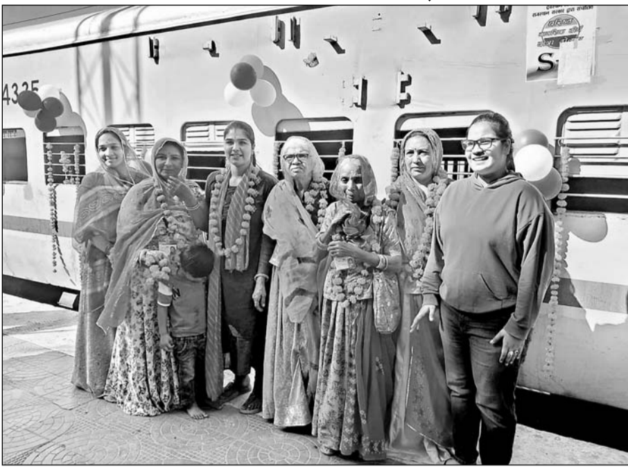
देवस्थान विभाग की वरिष्ठ नागरिक तीर्थ यात्रा योजना के अन्तर्गत तीसरी ट्रेन भगत की कोठी से जोधपुर संभाग के 1030 यात्रियों को लेकर रामेश्वरम् के लिए रवाना हुई।