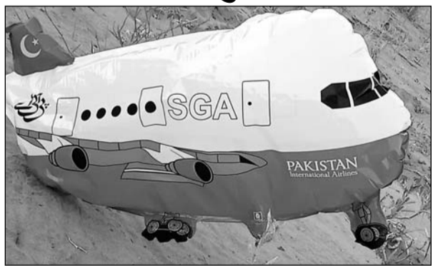
भारत-पाक सीमा पर मिली गुब्बारा जैसी आकृति।