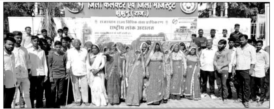
कलेक्टर पर प्रदर्शन के दौरान सहरिया बस्ती की महिलाएं भी मौजूद रहीं।

को ज्ञापन देने पहुंची महिलाओं एवं पुरुषों ने बताया कि कॉलोनी में कुछ लोगों का अनैतिक गतिविधियों की वजह से बाहरी लोगों की आवाजाही रहती है।