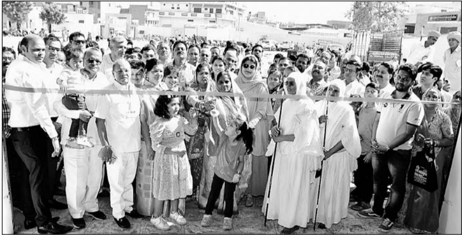
पाली के पिंजरापोल गौशाला में नवनिर्मित घास गोदाम का उद्घाटन दानदाता परिवार के सदस्यों ने फीता काटकर किया।