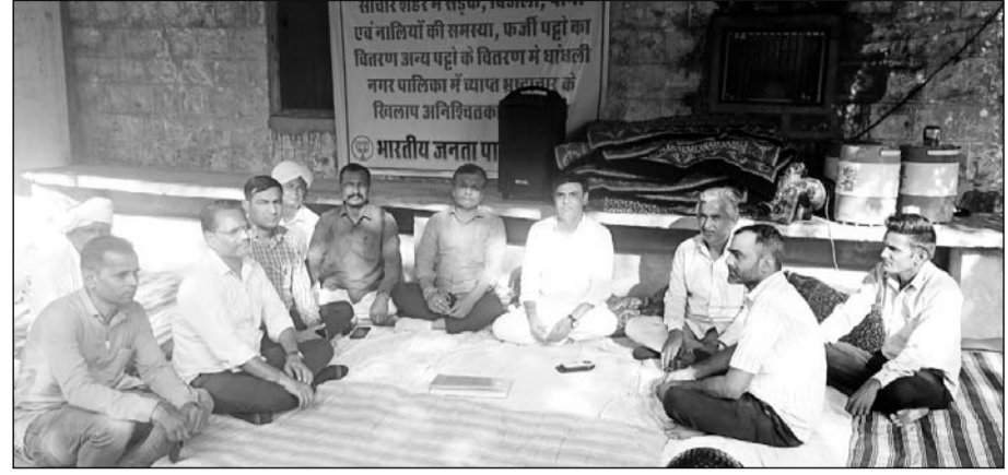
सांचौर नगर पालिका के समक्ष भाजपा पार्षदों का धरना जारी है।