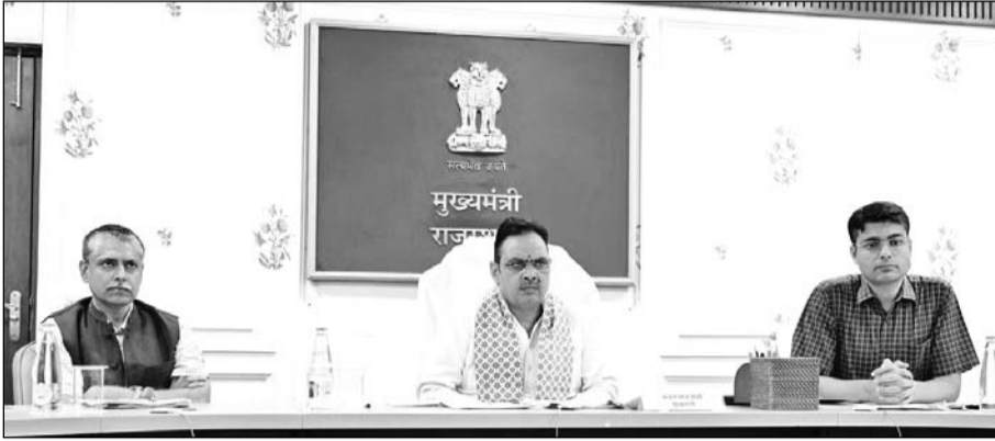
मुख्यमंत्री भजनलाल शर्मा ने शुक्रवार को मुख्यमंत्री कार्यालय में आयोजित राज उन्नति की छठी बैठक में अधिकारियों दिशा-निर्देश दिए।

मुख्यमंत्री ने सांगानेर में सीईटीपी के पर्माण्ड स्टेशन और पाइप-लाइन के काम