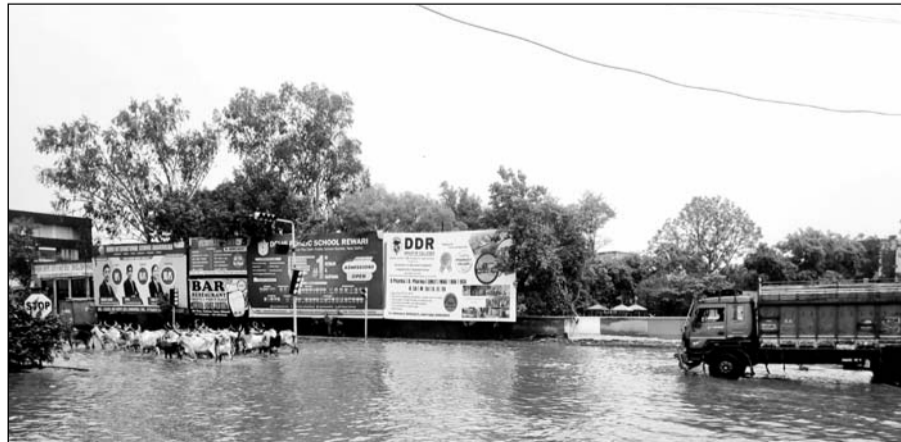
भिवाड़ी में सड़कों से काला और प्रदूषित पानी हुआ गायाव।