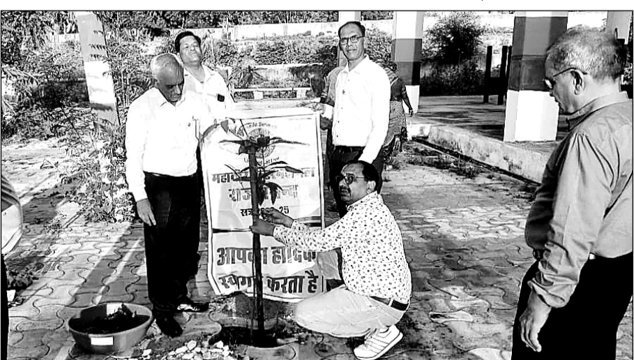
महावीर इंटरनेशनल की स्थापना की स्वर्ण जयन्ती पर पौधारोपण किया।