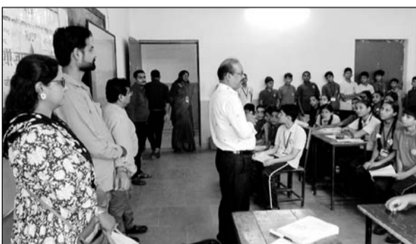
जल साक्षरता कार्यक्रम के तहत विद्यार्थियों को जल की महत्ता बताते आर्युआईडीपी के अधिकारी।

बांसवाड़ा, (निर्सं)। आर्युआईडीपी की सामुदायिक जागरूकता एवं सहभागिता सलाहकार इकाई की ओर से छात्र-छात्राओं को परियोजना के तहत किये जाने वाले आधारभूत विकास कार्यों एवं वर्तमान समय में जल संरक्षण की आवश्यकता, महत्त्वता एवं पेयजल बचाने के उपायों की जानकारी देने के लिये सेन्ट थोमस सैकेण्डरी स्कूल में जल साक्षरता कार्यक्रम के तहत जल संरक्षण का संदेश दिया गया। जिसमें विद्यालय के लगभग 60 छात्र-छात्राओं ने भाग लिया।