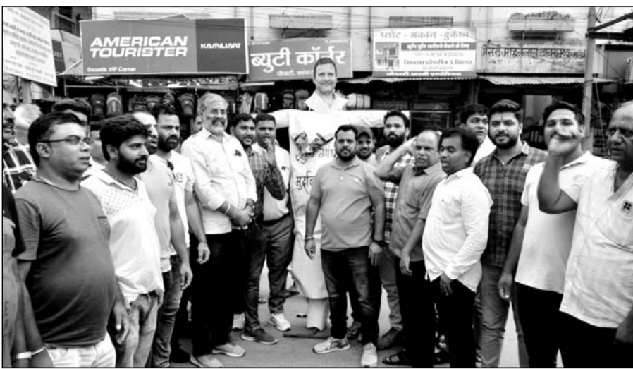
हिंदू समाज पर दिए बयान के खिलाफ प्रदर्शन कर राहुल गांधी का पुतला फूँकते भाजपाईं।