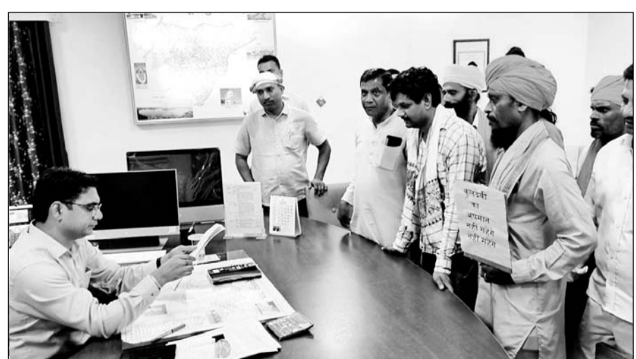
आदिवासी समाज के संत और प्रबुद्ध लोगों ने जिला कलक्टर को ज्ञापन दिया।

डूंगरपुर, (निर्सं)। बांसवाड़ा-डूंगरपुर सांसद राजकुमार रोट द्वारा दिए गए आदिवासी हिन्दू नहीं के बयान का सकल आदिवासी समाज के लोगो ने विरोध जताया है। आदिवासी समाज के संत और प्रबुद्ध लोगो ने शहर में आज कलेक्ट्रेट तक रैली निकाली और कलेक्टर को राज्यपाल के नाम ज्ञापन सौंपा।