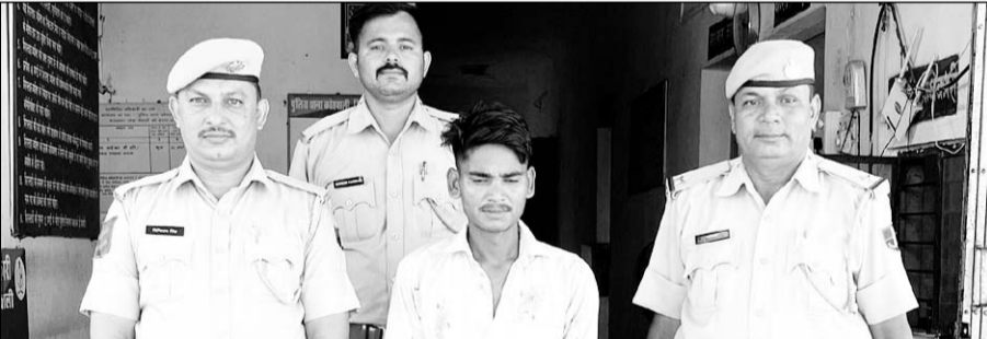
ऑनलाइन गेम में हारने पर लूट की साजिश रचने वाले फाइनैसकर्मियों को पुलिस ने गिरफ्तार किया।

■ पुलिस ने जांच की तो झूठ का भंडाफोड़ हुआ, पुलिस आरोपी से पूछताछ कर रही है