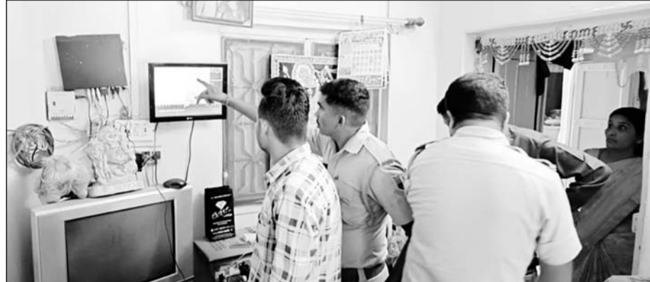
पुलिस ने सीसीटीवी कैमरे खंगाले तो उसमें तीन आरोपी बाइक पर नजर आये।

विदेश जाने के लिए वीजा के एवज में रूपए देने के लिए जा रहा था बाइक सवार