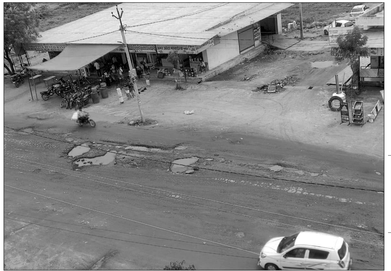
आसींद नगर से गुजर रहे नेशनल हाईवे 158 के रिंग रोड पर पर डामर के नाम पर केवल खड्डे बचे हैं।

सड़क पर डामर के नाम पर केवल खड्डे बचे हुए हैं। वर्तमान में बारिश के दौरान 1 से ढेड़ फिट तक के खड्डों में पानी भर जाता है। जिससे कई सड़क दुर्घटना का शिकार हो रहे हैं। उक्त मार्ग पर प्रतिदिन हजारों की संख्या में भारी वाहन गुजरते हैं साथ ही नेशनल हाईवे का कार्य भी प्रतिदिन पर होने से सैकड़ों की संख्या में रोजाना भारी वाहन भी गुजरते हैं जिससे भी सड़क को काफी क्षतिग्रस्त हो चुकी है। नगरवासियों पूर्व में भी खस्ताहाल सड़क को लेकर उच्च