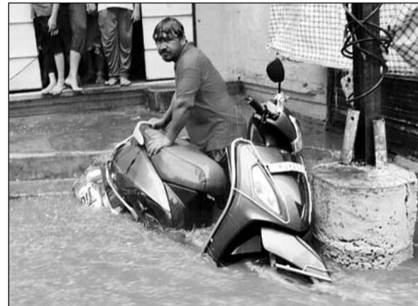
शहर में पानी में बहने से वाहनों को बचाने की जुगत करते क्षेत्रवासी।

डूंगरपुर, (नि.सं.)। विपरजाय तूफान के बाद बुधवार को प्रातः तक तो जमकर तपने के कारण आम जन परेशान था, लेकिन अचानक लगभग दो बजे काले घने बादल उमड़ कर आये और हवा के साथ तेज बारिश का दौर इस कदर शुरू हुआ कि देखते ही देखते भीतरी एवं बाहरी शहर की गलियां पानी से लबालब हो गईं। एक घण्टे की बारिश ने शहर को जमकर भीगेगा।