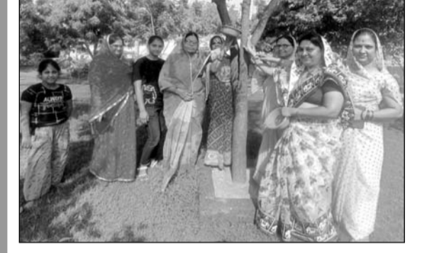
महानंद पर्यावरण विकास समिति की महिला विंग ने पक्षियों के परिंडे लगाने के अभियान की शुरुआत की।