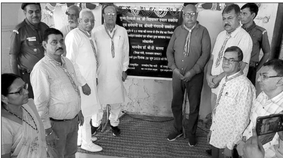
शिक्षा मंत्री डॉ. बी. डी. कल्ला ने स्काउट एवं गाइड मंडल प्रशिक्षण केन्द्र में टीनशैड का लोकार्पण किया।