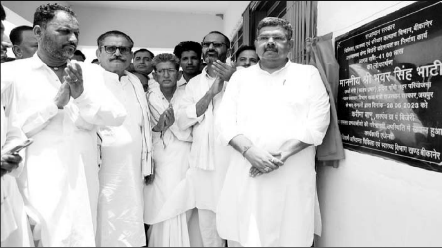
उर्जा मंत्री भंवर सिंह भाटी ने बज्जू पंचायत समिति की ग्राम पंचायत बिजेरी में विकास कार्यों का उद्घाटन किया।

इस अवसर पर उन्होंने बिजेरी के ग्रामीणों को विकास कार्यों की बधाई दी और कहा कि आमजन की मांग पर इसे ग्राम पंचायत बनाया गया है। इसके उद्घाटन के पश्चात ग्रामीण यहां बैठकर गांव के विकास की चर्चा और आपसी समन्वय के साथ काम करेंगे। उन्होंने कहा कि अब बिजेरी का अपना पटवारी मंडल होगा। यहां पटवारी, कृषि पर्यवेक्षक बैठेगा। इसके अलावा ग्राम पंचायत के अन्य अधिकारी भी यहां बैठकर आमजन की समस्याओं का समाधान करेंगे। उन्होंने कहा कि किसी भी गांव के ग्राम पंचायत बनने से उसके विकास के रास्ते स्वतः ही खुल जाते हैं। उन्होंने कहा कि इस गांव के स्कूल को 12वीं तक कर