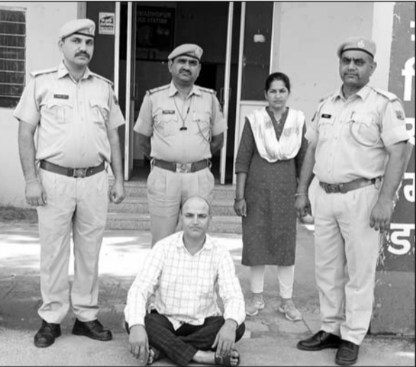
पुलिस ने फरार अपराधी को गिरफ्तार करने में सफलता हासिल की।

जुलाई 2008 को केंद्रीय कारागृह जयपुर से श्रीमधोपुर कोर्ट में पेशी के लिए लाया गया था इसी दौरान चालानी गार्ड को आरोपी चकमा देकर मौके से फरार हो गया था।