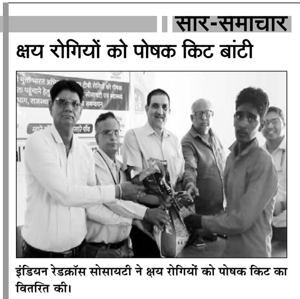
इंडियन रेडक्रॉस सोसायटी ने क्षय रोगियों को पोषक किट का वितरित की।

पर वह घर लौट गई। इसके कुछ देर बाद ही उसके मोबाइल पर उसके कार्ड से खरीदारी होने के मैसैज आने लगे। इस पर उसे अपने साथ हुई धोखाधड़ी का पता लगा। इस पर वह बैंक पहुंची और एटीएम से ट्रैजिक्शन रूकवाए। तब तक आरोपी मोबाइल के खाते से एक लाख सात हजार रुपए की शॉपिंग कर चुके थे। महिला के पति ने जवाहर नगर थाने मामला भी दर्ज करवाया।