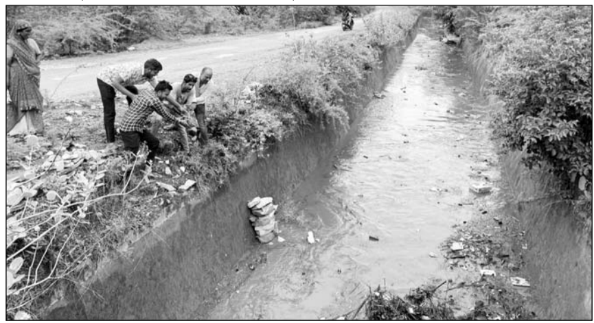
खारी फीडर के डिप्टी गांव में पहुंचने पर ग्रामीणों ने स्वागत किया।

पिछले 40 साल में यह दूसरा अवसर है कि जून महिने में नंदसमंद बांध छलका है। उसके बाद नंदसमंद के 2.5-2.5 फीट के चार-चार गेट खोलकर पानी बनास नदी में छोड़ा गया। इधर, खारी फिडर क्षतिग्रस्त होने के कारण पहले उसे दुरुस्त किया गया। जिसके बाद बुधवार सुबह नंदसमंद से खारी फीडर में पानी छोड़ा गया। फीडर का पानी 14 घंटे में करीब 32 किमी की दूरी तय कर शाम सात बजे के करीब पानी राजसमंद