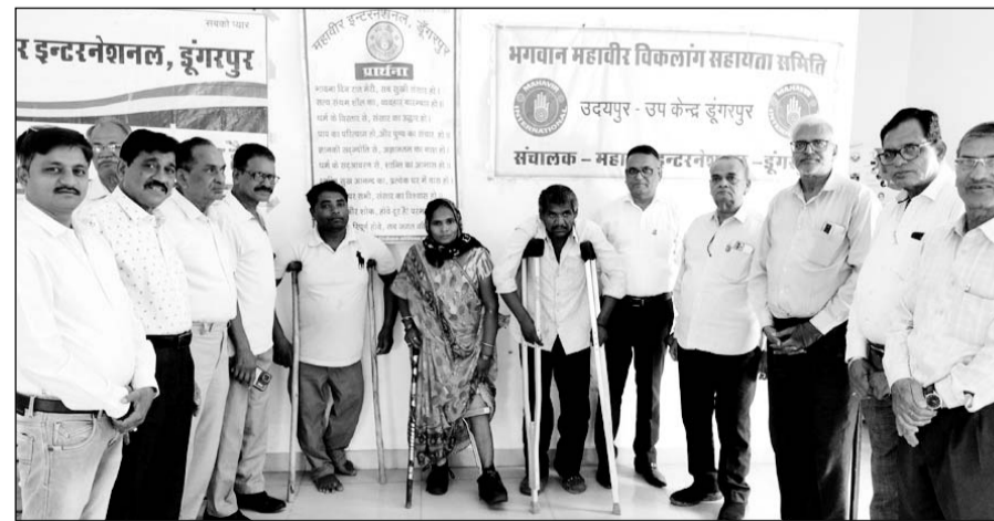
एमआई के सदस्यों ने लाभार्थियों को निःशुल्क सुविधा उपलब्ध कराई।

डूंगरपुर, (निर्स)। महावीर इंटरनेशनल डूंगरपुर द्वारा अप्रैल माह का दो दिवसीय दिव्यांग सहायता शिविर रविवार को एम आई के रोग निदान केन्द्र पर संपन्न हुआ। इस शिविर में दो दिव्यों की जयपुर फूट प्रदान किया गया जबकि तीन दिव्यों की केलीपत्त, तीन दिव्यों की बैसाखी निःशुल्क प्रदान की गई। शिविर में कुल आठ दिव्यांग को निःशुल्क सहायता सुविधा उपलब्ध कराई गई। सभी दिव्यों को परामर्श के साथ ही उन्हें शिविर के दौरान मेडिकल प्रमाण पत्र की प्रति, एक फोटो, आधार कार्ड,