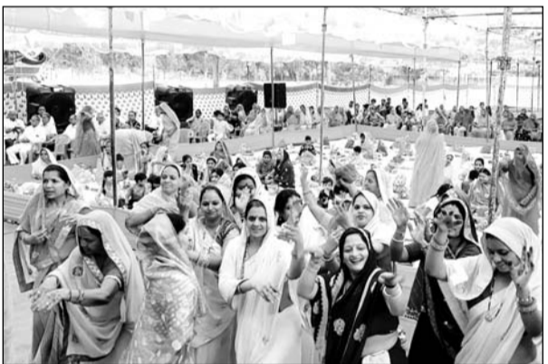
भीण्डर में तुलसी सालिग्राम विवाह कार्यक्रम में भक्त भजनों पर झूमें।

प्रतिदिन दोपहर तीन से 6 बजे तक कथा और विविध आयोजन हुए। जिसमें गणपति स्थापना, चाक, सालिग्राम जी अभिषेक, शक्तिपीठ उत्पत्ति कथा, पितृ