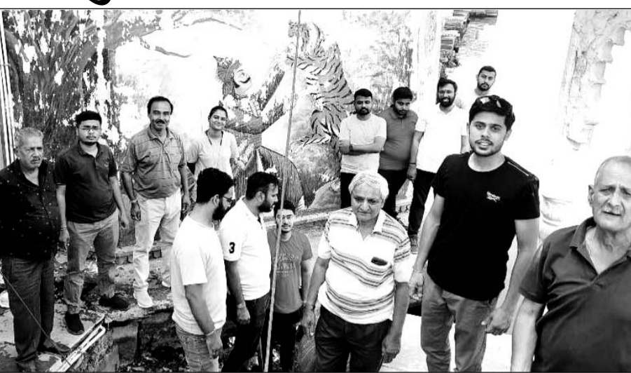
देश भर से आये युवा शोधकर्ताओं ने संवाद से पूर्व श्रमदान कर कचरे व गंदगी को हटाया।

■ ये युवा स्टूडेंट्स फॉर डेवलपमेंट (एसएफडी) के तत्वाधान में पर्यावरण व विकास विषय पर अध्ययन कर रहे हैं