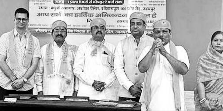
जय हनुमान राम चरित मानस प्रचार समिति ट्रस्ट व बीड़ंग मानव सेवा संस्थान द्वारा शिविर आयोजित।

उदयपुर, (निर्स)। जय हनुमान राम चरित मानस प्रचार समिति ट्रस्ट तथा बीड़ंग मानव सेवा संस्थान द्वारा रविवार को यहां शोभागपुर स्थित अशोका पैलेस में आयोजित निःशुल्क ज्योतिष, हस्त रेखा एवं वास्तु परामर्श शिविर में भीड़ उमड़ पड़ी।