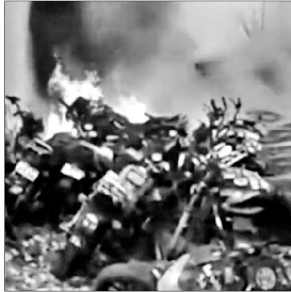
रावतभाटा थाना परिसर में आग लगने दोपहिया वाहन जल गए।