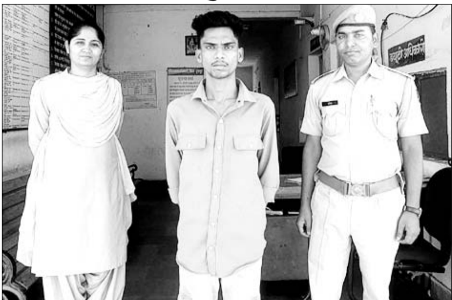
पुलिस ने नाबालिग से दुष्कर्म के मामले में आरोपी को गिरफ्तार किया।

डूंगरपुर, (निर्स)। जिले की अपहरण कर रेप करने के आरोपी को कोतवाली पुलिस ने नाबालिग का गिरफ्तार किया है। आरोपी नाबालिग