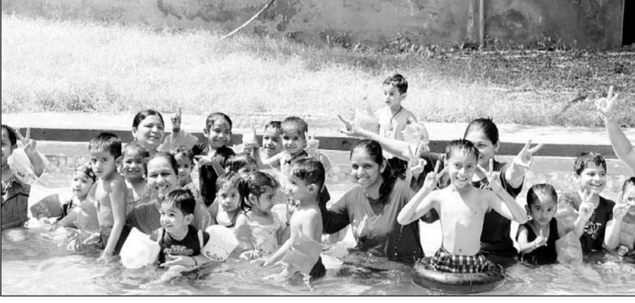
उदयपुर में बढ़ते तापमान के साथ ही तरणताल में बच्चे तैराकी का प्रशिक्षण ले रहे हैं।

उदयपुर, (निर्स)। झीलों के शहर में गर्मी अपना आह्वान करा रही है। अप्रैल के आखिरी सप्ताह में हीट वेव के साथ ही तापमान अब 38 डिग्री पहुंच गया है। झीलों में जहां सुबह लोग तैराकी करते दिखाई दे रहे हैं वहीं वहीं शाम ढलते ही नन्हें मुझे छाई छापाक करने तरणताल की ओर अपना रुख करने लगे हैं। शहर के आरएन्टी मेडिकल