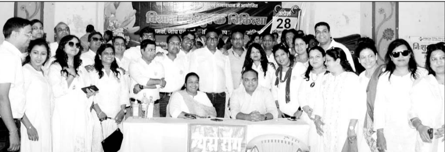
पेसिफिक में निशुल्क जांच, भर्ती और ऑपरेशन की सुविधाओं वाला चिकित्सा शिविर संपन्न हुआ।