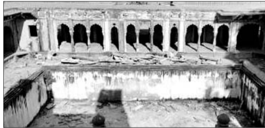
करौली का शिकारगंज महल देखरेख के अभाव में खंड-खंड होता नजर आ रहा है।