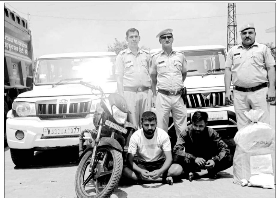
नीमकाथाना के देवसिटी में पुलिस एवं डीएसटी टीम ने दो जनों को गिरफ्तार किया।