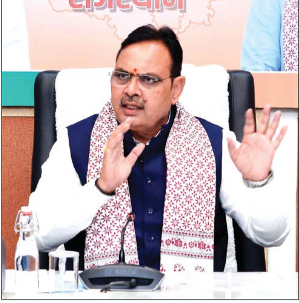
मुख्यमंत्री भजनलाल शर्मा

उन्होंने बताया कि राजस्थान में जनगणना 2027 का प्रथम चरण मई से शुरू हो रहा है। इसके तहत मकानों की सूची और गणना का कार्य 16 मई से 14 जून तक किया जाएगा। इस दौरान प्रगणक घर-घर जाकर जानकारी एकत्रित करेंगे। प्रदेशवासी आवश्यक सहयोग करते हुए मकानों की गणना से