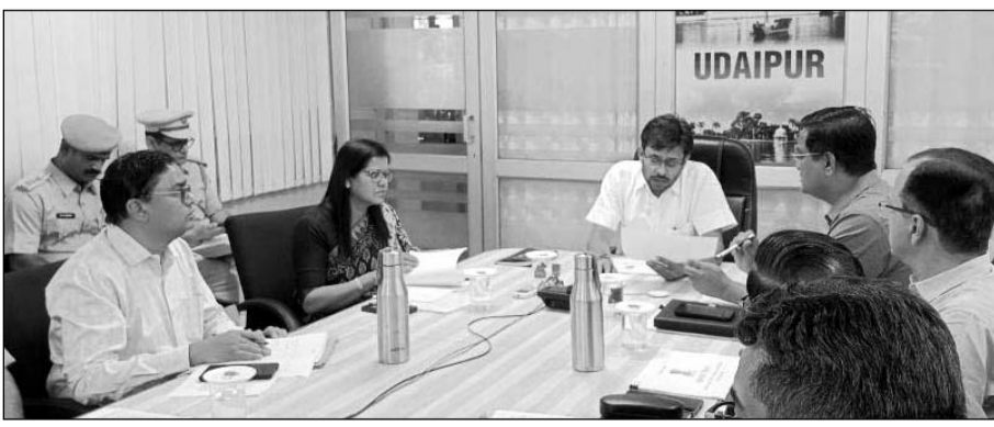
आबकारी आयुक्त नमित मेहता ने वीडियो कॉन्फ्रेंस के माध्यम से विभागीय समीक्षा बैठक में अधिकारियों को संबोधित किया।

निस्तारण आदि की विस्तृत समीक्षा करते हुए संबंधित अधिकारियों को निर्देशित किया गया। आबकारी आयुक्त नमित मेहता ने वीडियो कॉन्फ्रेंस के माध्यम से विभागीय समीक्षा बैठक में अधिकारियों को संबोधित कर रहे थे। उन्होंने कहा कि प्रदेश सरकार की आबकारी नीति के तहत राजस्व, बंदोबस्त, बकाया वसूली, निरोधक कार्यवाहियां सहित समस्त लक्ष्य समथर रूप से शान-प्रतिपत्त पूर्ण किए जाने चाहिए। बैठक में जिलेवार आबकारी राजस्व, बंदोबस्त, पहिरा उठाव, निरोधक गतिविधियां, बकाया वसूली, राजस्थान सम्पर्क पोर्टल पर लॉन्च विभागीय प्रकरण, जन्त वाहनों की नीलामी, मालखाना