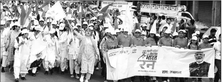
जयपुर में शुक्रवार को 'नारी शक्ति फॉर विकसित भारत रन' का आयोजन किया गया।

जयपुर। महिला सशक्तिकरण और 'विकसित भारत' के संकल्प को जन-जन तक पहुंचाने के उद्देश्य से शुक्रवार को जयपुर में 'नारी शक्ति फॉर विकसित भारत रन' का आयोजन किया गया। भारत सरकार के युवा कार्यक्रम एवं खेल मंत्रालय के तत्वावधान में 'माय भारत' द्वारा आयोजित इस कार्यक्रम में शहर की सैकड़ों महिलाओं ने उत्साहपूर्वक भाग लिया।