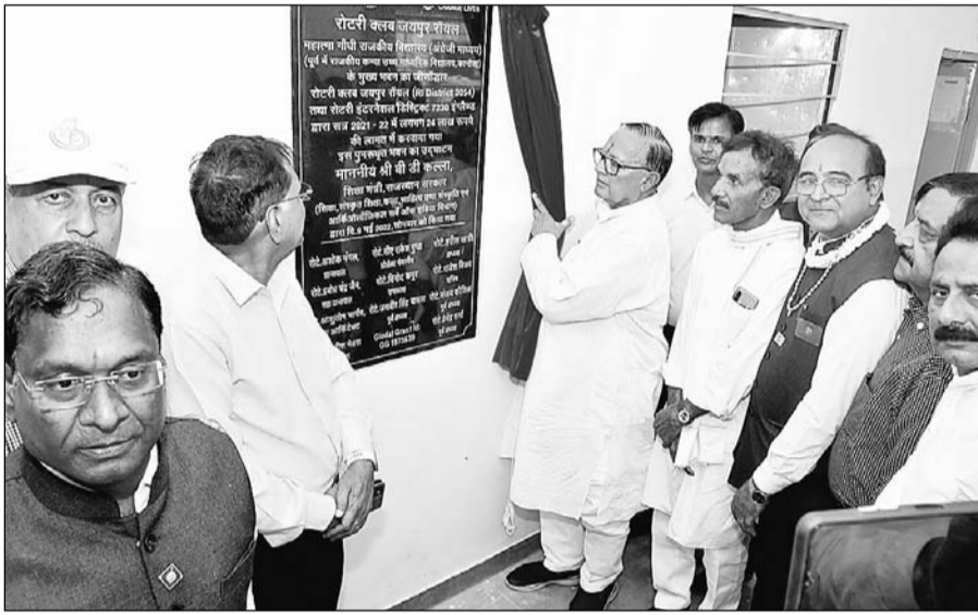
शिक्षा मंत्री बी.डी.कल्ला ने मंगलवार को जयपुर के पास कानोता में राजकीय कन्या उच्च माध्यमिक विद्यालय के नवीनीकृत भवन का उद्घाटन किया।