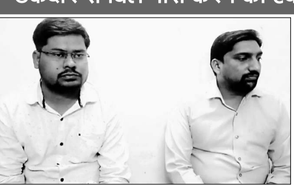
एसीबी की गिरफ्त में रिश्वत लेने के आरोपी कनिष्ठ अभियंता।

ठेकेदार से बिल पास करने की एवज में 11500 रुपये की रिश्वत लेते रेस्टोरेंट से दबोचा