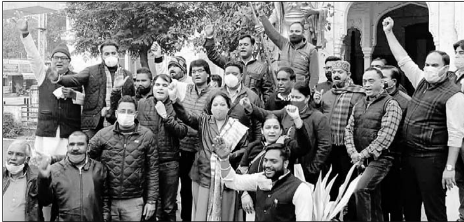
पीएम मोदी की सुरक्षा में हुई चूक के विरोध में भाजपाइयों ने प्रदर्शन करते हुए रोष जताया।

अजमेर, (कास)। भाजपा शहर जिला अजमेर द्वारा शुक्रवार को गांधी भवन स्मारक पर 5 जनवरी को पंजाब के फिरोजपुर में पीएम मोदी की सुरक्षा में हुई चूक के विरोध में पंजाब की कांग्रेस सरकार के खिलाफ प्रदर्शन किया एवं भाजपा महिला मोर्चा अजमेर शहर द्वारा प्रधानमंत्री मोदी के दीर्घ आयु की कामना हेतु महा मृत्युंजय मंत्र का जाप एवं यज्ञ किया गया। भाजपा शहर जिलाध्यक्ष डॉ. प्रियशील हाड़ा ने कहा कि फिरोजपुर में रैली के लिए जाते समय प्रधानमंत्री नरेंद्र मोदी के काफिले को फ्लाईओवर पर 15 से 20 मिनट तक रुकना पड़ा था, पंजाब के डीजीपी व गृह मंत्री दोनों को जल्द लिंबित किया जाना चाहिये।