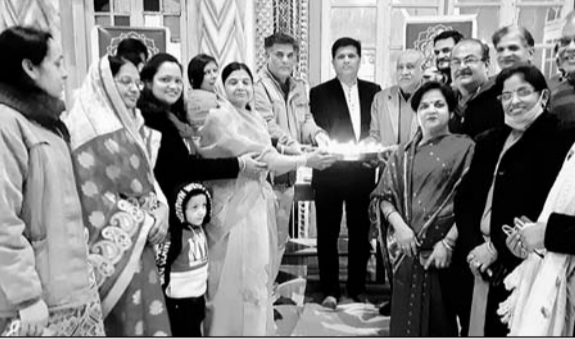
सोनी जी की नसिया पर गुणसागर मुनिराज की 11 वीं विनयांजलि दिवस पर णमोकार महामंत्र का जाप व भजन का कार्यक्रम हुआ।