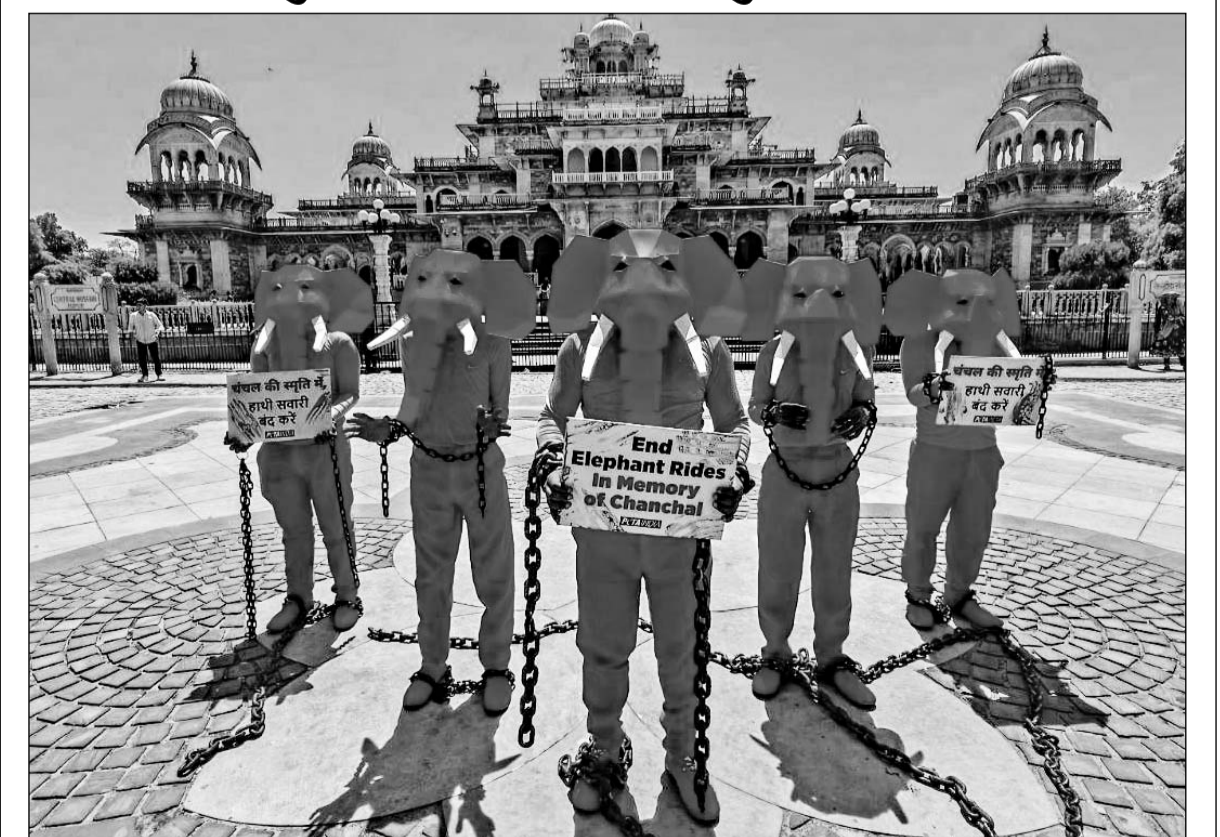
राजधानी जयपुर में हथिनी चंचल को गुलाबी रंगने और उसके बाद विदेशी फोटोग्राफर द्वारा फोटोशूट किये जाने के विरोध में शुक्रवार को घेटा द्वारा अलबर्ट हाल पर प्रदर्शन किया गया। ज्ञात रहे कि यह फोटोशूट करीब 1 साल पहले हुआ था, हथिनी चंचल की मौत भी हो चुकी है। पिछले दिनों जब यह तस्वीरें सोशल मीडिया पर सामने आयी थी, उसके बाद जपकर विवाद उपजा था।