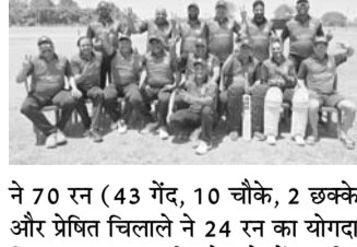
ने 70 रन (43 गेंद, 10 चौके, 2 छक्के) के अजय रहते हुए अपना दबदबा कायम रखा और दसवें दौर के बाद दो अंक की बड़ी बढ़त कायम कर ली। सिंदरीव ने इस टूर्नामेंट में छठी जीत हासिल करते हुए कुल आठ अंक कर लिए, जिसमें भारत के युवा ग्रैंडमास्टर पर यह दूसरी जीत भी शामिल थी।

जयपुर, 10 अप्रैल। आईसीसी ग्रांड, इंदौर में आयोजित तीन टीमों की मध्य क्षेत्र वेटेदन टी-20 लीग में राजस्थान वेटेदन टीम ने शानदार प्रदर्शन करते हुए विदर्भ वेटेदन टीम को 5 विकेट से हराकर फाइनल में प्रवेश किया। अब फाइनल मुकाबला कल मध्य प्रदेश और विदर्भ के बीच होने वाले मैच की विजेता टीम से होगा।