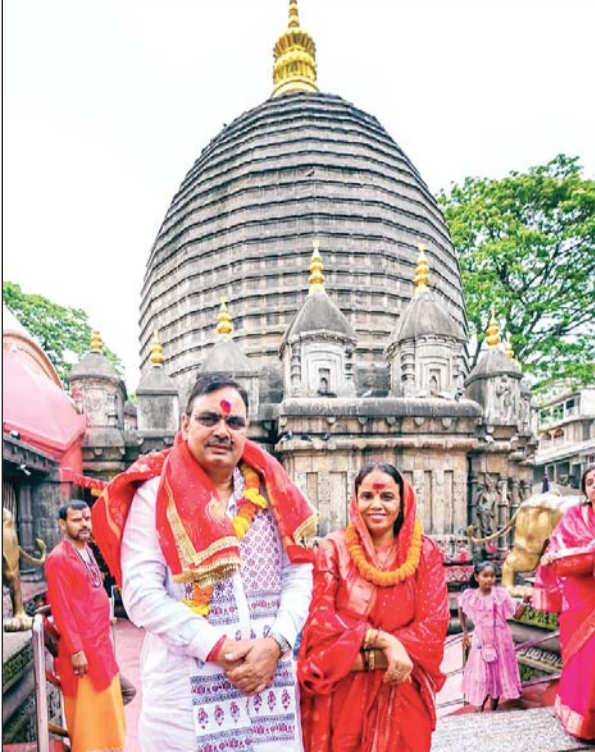
मुख्यमंत्री भजनलाल शर्मा ने मंगलवार को असम के गुवाहाटी में माँ कामाख्या मंदिर में सपत्नीक दर्शन किए।

इस अवसर पर केन्द्रीय गृह मंत्री अमित शाह, केन्द्रीय रक्षा मंत्री राजनाथ सिंह, केन्द्रीय मंत्रिमण्डल के सदस्यों सहित, विभिन्न राज्यों के मुख्यमंत्री, उपमुख्यमंत्री, मंत्रीगण एवं अन्य जनप्रतिनिधिगण उपस्थित रहे।