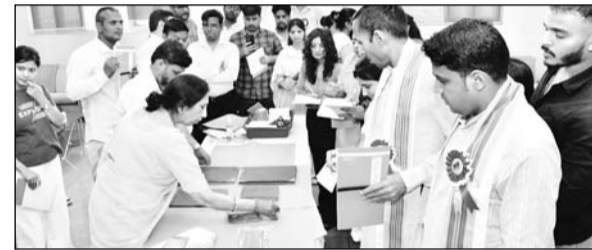
'पांडुलिपियों का निवारण एवं संरक्षण' विषय पर पांच दिवसीय कार्यशाला का आयोजन हुआ।

हरिद्वार में किया जा रहा है। इस मिशन का उद्देश्य भारत की विशाल एवं अप्रमूल्य पांडुलिपि विरासत का संरक्षण, दस्तावेजीकरण तथा डिजिटलीकरण करना है, ताकि यह प्राचीन ज्ञान-संपदा भावी पीढ़ियों के लिए सुरक्षित रह सके। कार्यशाला का आयोजन पांडुलिपि संरक्षण के प्रति जागरूकता उत्पन्न करने तथा संरक्षण एवं भंडारण