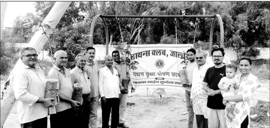
जालोर में लायंस क्लब पदाधिकारियों ने पौधारोपण किया।

जालोर, (कासं)। जालोर शहर के नेहरू उद्यान में लायंस क्लब पदाधिकारियों ने पर्यावरण संरक्षण को मुहिय के तहत सुंदेदाव तालाब के पास स्थित लायंस क्लब उद्यान में सोमवार