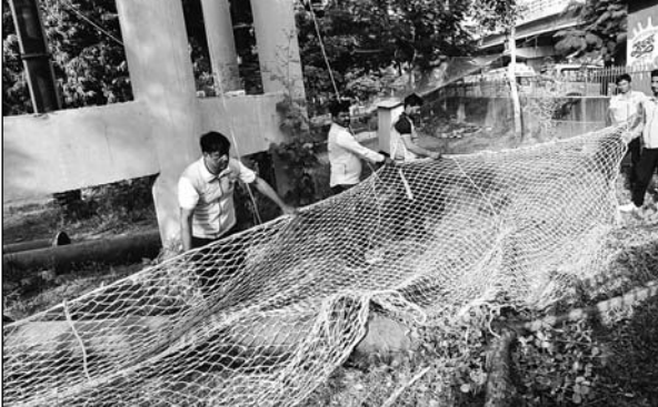
पानी की टंकी पर चढ़े दो बरोजगारों को सुरक्षित उतारने की कवायद में जुटे आपदा प्रबंधन के कर्मचारी।