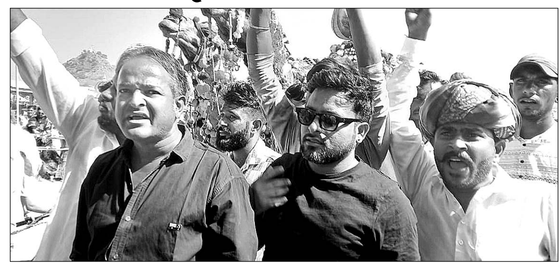
पुष्कर मेले में काफी संख्या में देशी व विदेशी पर्यटकों का आना जारी है।

पुष्कर 10 नवंबर। पुष्कर के सालाना मेले में राजस्थान सहित देश के विभिन्न राज्यों से श्रद्धालु पहुंच रहे हैं वहीं सात समुन्दर पार से विदेशी मेहमानों के आने से ब्रह्मजी की पावन नगरी पूर्व पश्चिम संस्कृति की स्थली में तब्दील हो गई। सैलानियों को मेले में आ रहे ठामाँग महिला पुरुष श्रद्धालुओं के साथ उठ व घोड़े चोड़ियों करतब लुभा रहे हैं। पशुओं की मंडी में पशुपालक खरीद फरोख्त में मशगूल है।