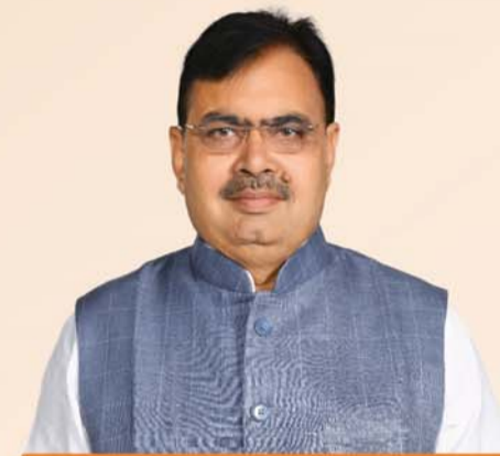
श्री भजनलाल शर्मा माननीय मुख्यमंत्री