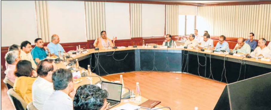
मुख्यमंत्री भजनलाल शर्मा ने गृह विभाग की समीक्षा बैठक में भाग लिया।

मुख्यमंत्री भजनलाल शर्मा गुरुवार को मुख्यमंत्री कार्यालय पर गृह विभाग की समीक्षा बैठक को संबोधित कर रहे थे। उन्होंने कहा कि अपराधियों में पुलिस का खौफ इतना होना चाहिए कि या तो वे अपराध छोड़ दें अथवा प्रदेश छोड़कर चले जाएं। राज्य में अराजकता और अशांति फैलाने का इरादा रखने वाले असाामाजिक तत्वों को रोकथाम के लिए पुलिस खुफिया तंत्र और मुखबिर व्यवस्था का बेहतरीन उपयोग करते हुए कानून व्यवस्था बनाए रखना सुनिश्चित करे। शर्मा ने कहा कि