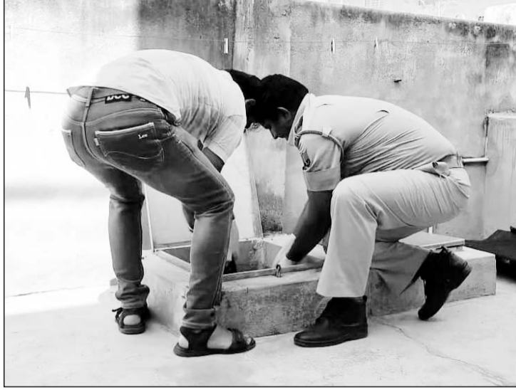
सूचना मिलने पर पुलिस ने मौके पर जाकर टैंक में से शवों को बाहर निकाला।