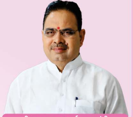
श्री भजनलाल शर्मा, मुख्यमंत्री