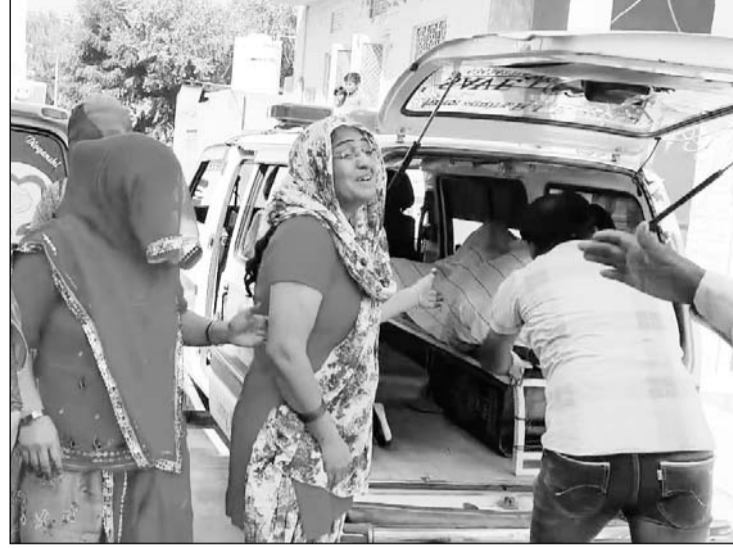
वृद्ध दंपती के शव को एंबुलेंस की सहायता से अस्पताल भेजा गया।

नागौर, (निसं)। नागौर शहर की करणी कॉलोनी में प्लांट के लिए बेटे-बहूओं की मारपीट से दुखी वृद्ध दंपती ने एक साथ पानी के टैंक में कूदकर सुसाइड कर लिया। प्रारंभिक तौर पर यह सामने आया कि यह दंपती अकेले ही इस घर में रह रहे थे, परिवार के बीच संपत्ति सहित कई तरह के विवाद चल रहे थे और इसी कलह के चलते 70 साल की उम्र में वृद्ध दंपती ने इस तरह का आत्महत्या वाला कदम उठाया।