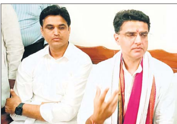
अजमेर में अल्प प्रवास पर आए सचिन पायलट ने सर्किट हाउस में स्थानीय नेताओं से चर्चा की।

इस्तीफा स्वीकार नहीं हो रहा है, इससे प्रदेश की जनता पिस रही है। मीडिया से बातचीत करते हुए पायलट ने कहा कि हरियाणा विधानसभा चुनाव का जो परिणाम सामने आया है वो अप्रत्याशित है। कांग्रेस नेतृत्व ने इस मामले में चुनाव