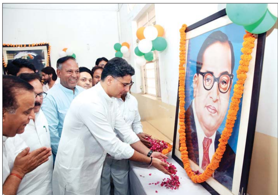
कांग्रेस के राष्ट्रीय महासचिव एवं पूर्व उपमुख्यमंत्री सचिन पायलट मंगलवार को प्रदेश कांग्रेस मुख्यालय में बाबा साहेब की जयंती पर आयोजित पुष्पांजलि कार्यक्रम में शामिल हुए।

और जनगणना जैसे मुद्दों पर पारदर्शिता बनाए रखने के लिए सर्वदलीय बैठक बुलाई जानी चाहिए।