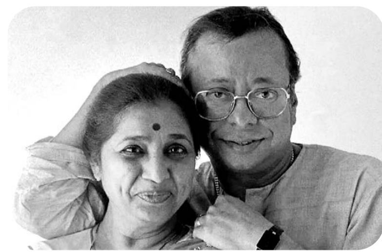
Asha Bhonsle and RD Burman.

Under the batons of O.P. Nayyar, Burman father-son duo, Sachin Dev and Rahul Dev who she married later and many other great composers, Asha blossomed and grew, singing silky melodies to powerful crescendos, pop, disco, rock, classical and adapting easily to diverse genres. Her repertoire spanned soft songs, romantic melodies, peppy cabarets to exhilarating qawwalis, soulful ghazals, divine bhajans and classical compositions. She crooned under the batons of masters like Ghulam Mohammed to young geniuses like A. R. Rahman and many more. Madan Mohan, known for his talent in directing music dominated by classical Hindustani musical ragas, was fascinated by her voice. Madan Mohan recorded a number