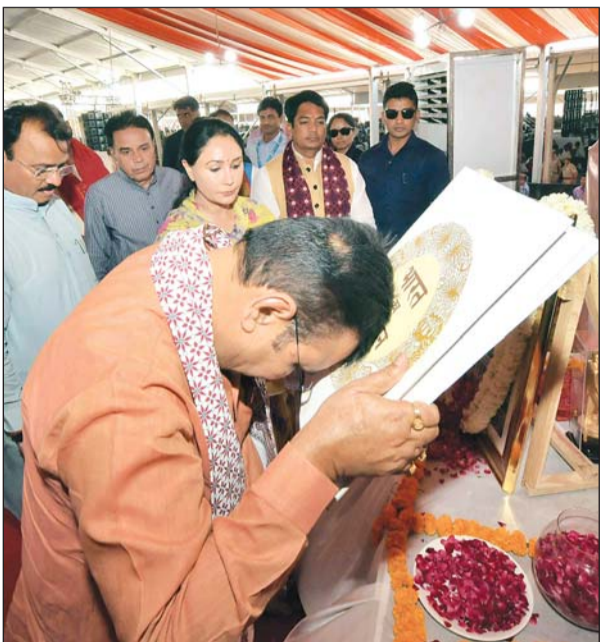
मुख्यमंत्री भजनलाल शर्मा ने मंगलवार को बाबा साहेब डॉ. भीमराव अंबेडकर की 135वीं जयंती के अवसर पर आयोजित राज्य स्तरीय कार्यक्रम को संबोधित किया।

जयपुर, 14 अप्रैल। मुख्यमंत्री भजनलाल शर्मा ने कहा कि हमारी सरकार पिछड़े, वंचित एवं अंतिम पंक्ति के व्यक्ति तक विकास का उजियारा पहुंचाने एवं जीवन स्तर सुधारने के लिए प्रतिबद्ध है। हमारी सरकार बाबा साहेब के सपनों को पूरा करते हुए समाज के सभी वर्गों को सामाजिक, आर्थिक एवं राजनीतिक रूप से सशक्त एवं सक्षम बनाने का कार्य कर रही है। उन्होंने युवाओं का आह्वान करते हुए कहा कि, बाबा साहेब के सिद्धांतों और आदर्शों का अममसात करते हुए राष्ट्र विकास में योगदान दें।