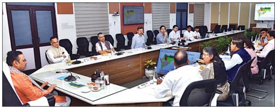
मुख्यमंत्री भजनलाल शर्मा ने मंगलवार को अपने आवास पर ऊर्जा विभाग की बैठक ली।

-कार्यालय संवाददाता- जयपुर । मुख्यमंत्री भजनलाल शर्मा ने कहा कि बेहतर प्रबंधन एवं दूरगामी निर्णयों के फलस्वरूप प्रदेश की विद्युत उत्पादन क्षमता में उल्लेखनीय वृद्धि दर्ज होने के साथ ही छीजत में कमी आई है। उन्होंने प्रदेश को ऊर्जा के क्षेत्र में आत्मनिर्भर बनाते हुए कृषि एवं घरेलू उपभोक्ताओं तथा उद्योगों को निर्बाध एवं पर्याप्त बिजली सुनिश्चित करने के निर्देश दिए। शर्मा मंगलवार को मुख्यमंत्री निवास पर आयोजित ऊर्जा विभाग की बैठक की अध्यक्षता कर रहे थे।