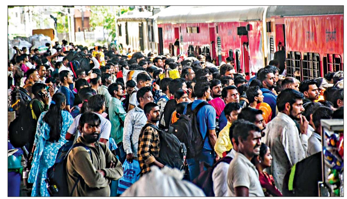
पश्चिमी बंगाल में इसी माह होने वाले चुनाव को देखते हुए जयपुर में रह रहे लोग वापस अपने प्रदेश लौटने लगे हैं। मंगलवार को जयपुर रेलवे स्टेशन पर यात्रियों की भारी भीड़ रही। हालात ऐसे थे कि ट्रेनों में सीटें मिलना तो दूर प्लेटफॉर्म पर खड़े होने की भी जगह नहीं थी।

है, जो हरियाणा और पंजाब के निवासी हैं। पुलिस आरोपियों के कब्जे से 29.850 किलो अवैध डोडा चूरा बरामद किया है। पुलिस ने बताया कि आरोपियों के नेटवर्क और अन्य संभावित साधियों के संबंध में जांच जारी है। साथ ही आमजन से अपील की गई है कि नशे के खिलाफ इस मुहिम में सहयोग करें और अवैध गतिविधियों की सूचना तुरंत पुलिस को दें।