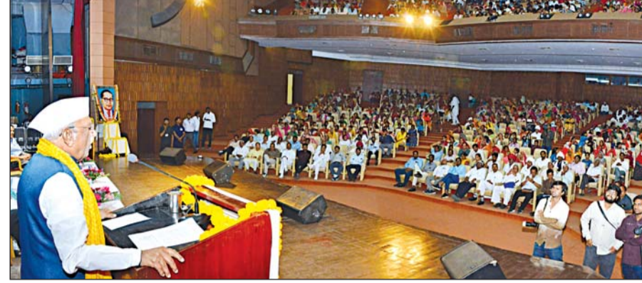
राज्यपाल हरिभाऊ बागडे ने डॉ. भीमराव अम्बेडकर की 135 वीं जयंती पर जयपुर में आयोजित समारोह में संबोधित किया।

डॉ. अम्बेडकर ने देश को सामाजिक समरसता का मंत्र ही नहीं दिया बल्कि राष्ट्र सर्वोच्च है, यह दृष्टि भी दी : हरिभाऊ बागडे