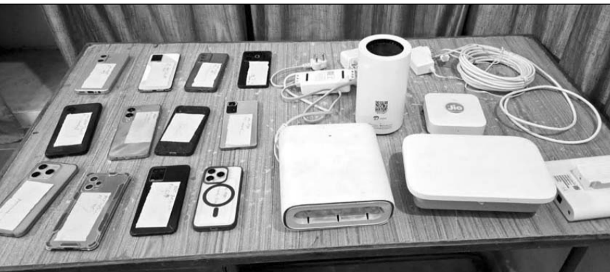
पुलिस ने आरोपियों के कब्जे से 12 मोबाइल फोन और 17 फर्जी सिम कार्ड बरामद किये।

डूंगरपुर, (निर्सं)। जिला पुलिस ने सायबर अपराधियों के खिलाफ चलाए जा रहे विशेष अभियान ऑपरेशन सायबर हंट के तहत कार्यवाही करते पुलिस ने 6 सायबर ठगों को गिरफ्तार किया है। आरोपियों के कब्जे से पुलिस ने 12 मोबाइल फोन और 17 फर्जी सिम