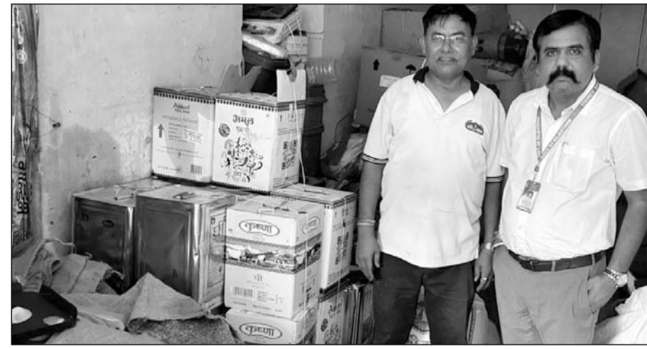
पाली शहर में डेयरी एंड जनरल स्टोर पर घी के नमूने लिये।