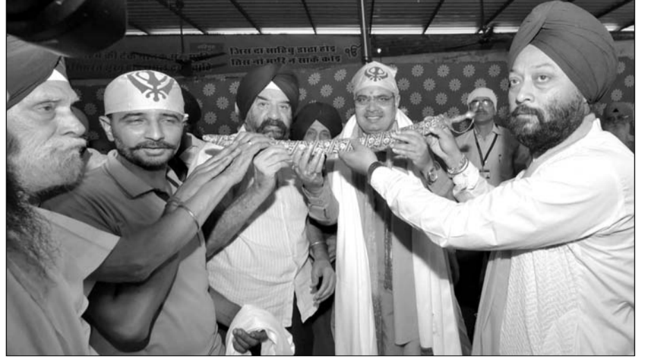
बैसाखी पर्व के उपलक्ष्य में जयपुर के प्रताप नगर गुरुद्वारे में पहुंचे मुख्यमंत्री भजनलाल शर्मा को गुरुद्वारा प्रबंधन समिति ने कृपाण भेंट कर अभिनंदन किया।

'गुरुद्वारे में एक पंगत में बैठकर प्रसाद पाना सिखाता है कि समाज की असली ताकत मिलकर चलने में ही है'