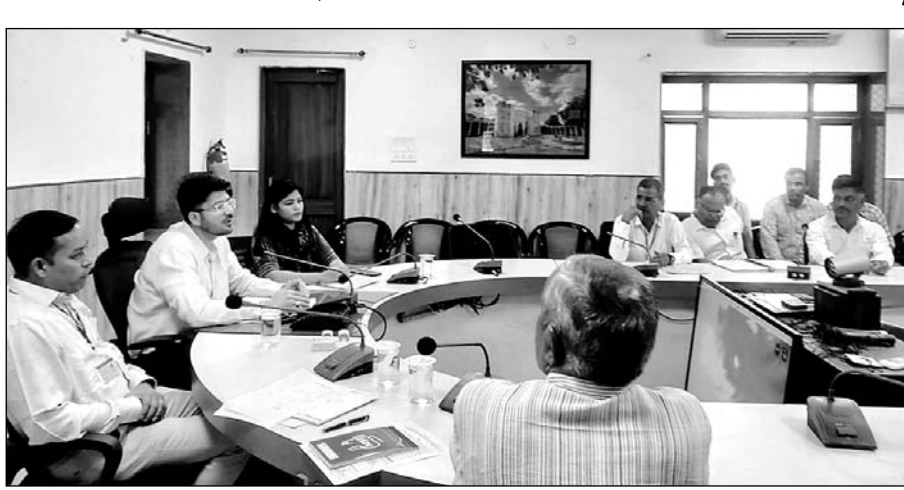
जालोर में राजनैतिक दलों के प्रत्याशियों व प्रतिनिधियों की बैठक व्यव्येक्षक ने ली।

जिसमें जालोर जिले के 706 मतदान केन्द्र व सिरौही जिले के 382 मतदान केन्द्रों पर वेबकास्टिंग के माध्यम से नजर रबी जायेगी। उन्होंने कहा कि होर्डिंग्स साइट्स पर होर्डिंग्स प्रदर्शन के लिए सभी प्रत्याशियों