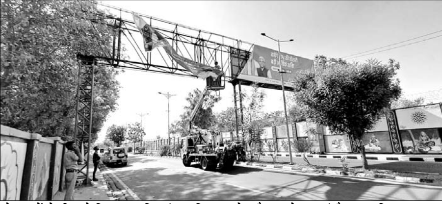
जोधपुर में जे.डी.ए. ने बिना अनुमति एवं अनाधिकृत लगे फ्लैक्स, पोस्टर एवं बैनर इत्यादि हटाए।