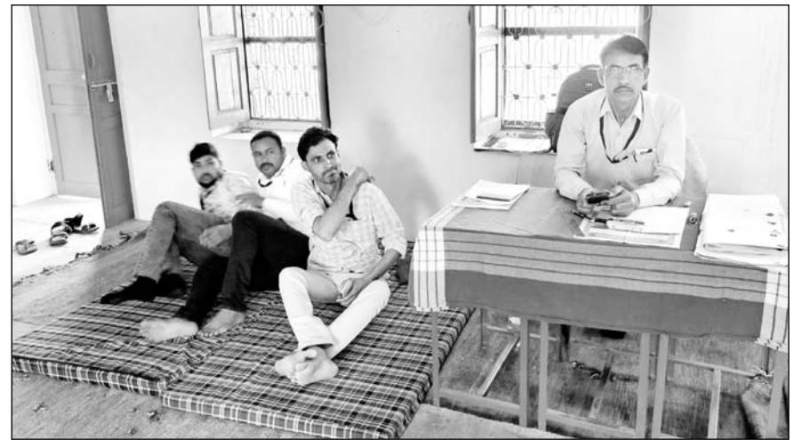
मतदान केंद्र पर मतदान अधिकारी एवं कर्मचारी सुबह से बैठे ही रहे, उन्होंने केवल अपना ही वोट डाला।

ग्रामीणों ने यमुना के पानी की मांग को लेकर यह कदम उठाया