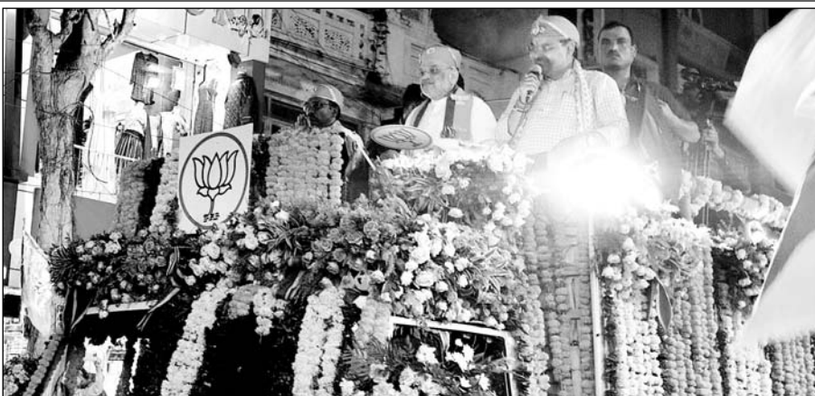
उदयपुर में रोड शो के दौरान गृहमंत्री अमित शाह के साथ मुख्यमंत्री भजन लाल शर्मा भी मौजूद रहे।