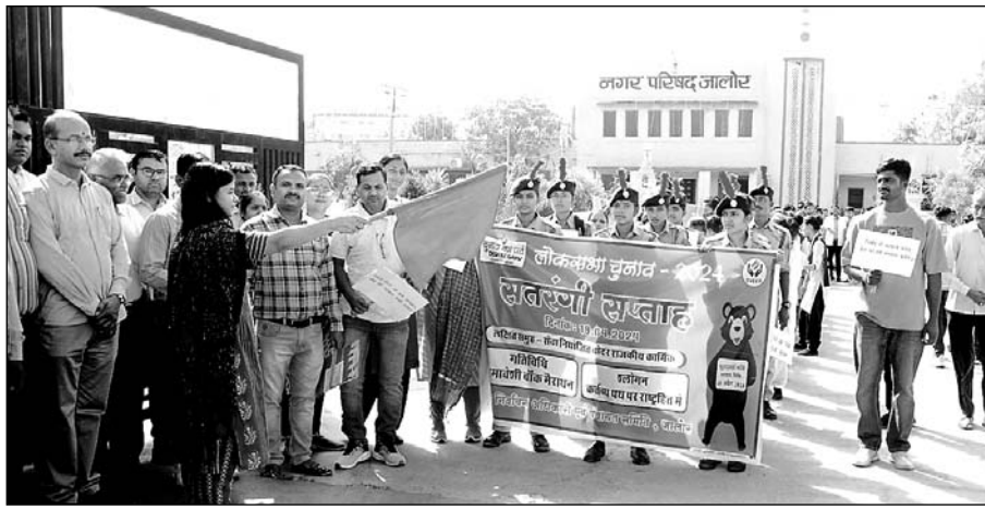
समावेशी वाँकथॉन को जिला निर्वाचन अधिकारी पूजा पार्थ ने हरी झंडी दिखाई।

सतरंगी सप्ताह के तहत 20 अप्रैल, शनिवार को जिला, उपखण्ड व तहसील स्तर पर ट्राई साईकिल रैली का आयोजन कर 26 अप्रैल, मतदान