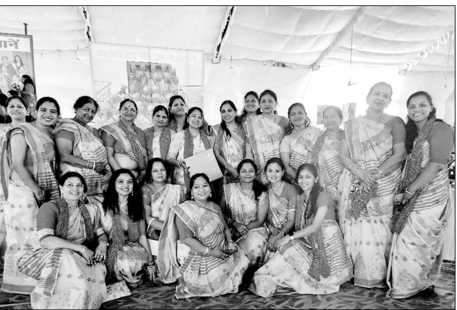
पाली में गांव सांझी कार्यक्रम में जैन समाज की महिला मंडलों ने भाग लिया।