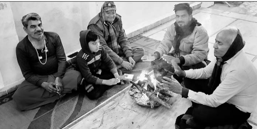
हिरणमगरी सेक्टर-4 स्थित दातापति हनुमान मंदिर में अलाव का सहारा लेते श्रद्धालु।

मौसम विभाग डबोक से मिली जानकारी के अनुसार उदयपुर शहर का अधिकतम तापमान 22.8 डिग्री व