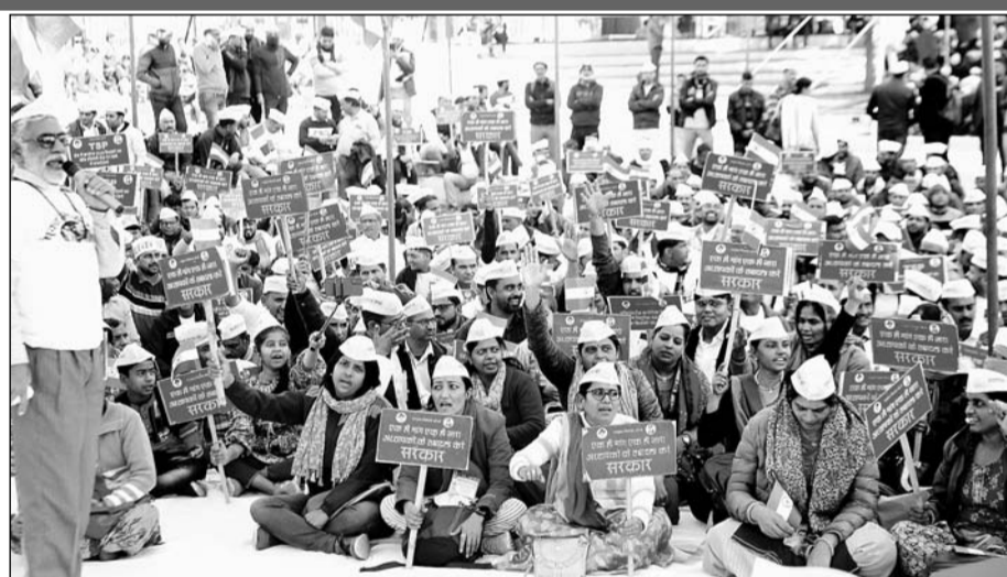
प्रदेशभर के थर्ड ग्रेड अध्यापकों ने मंगलवार को एम.आई.रोड स्थित शहीद स्मारक पर धरना शुरू किया।

जयपुर (कासं)। राजस्थान में पिछले 4 साल से ट्रांसफर का इंतजार कर रहे ग्रेड थर्ड टीचर ने एक बार फिर राज्य सरकार के खिलाफ आंदोलन शुरू कर दिया है। मंगलवार को जयपुर के शहीद