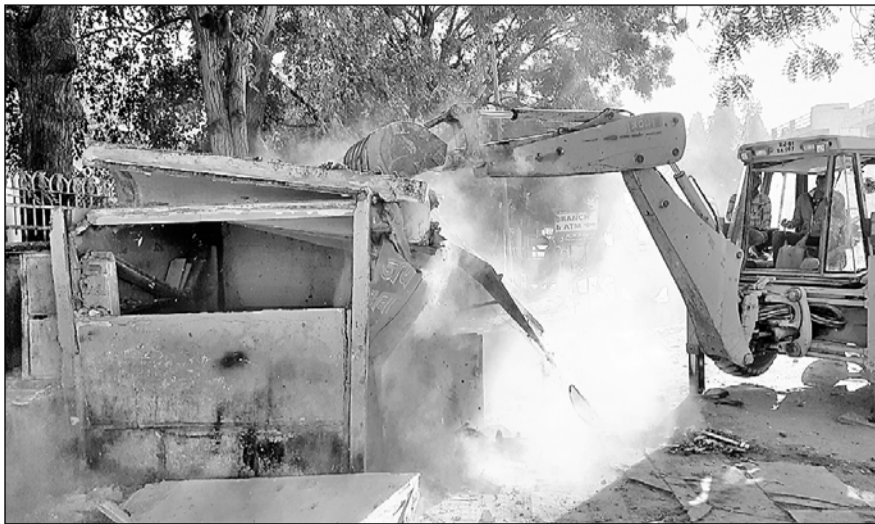
अजमेर विकास प्राधिकरण द्वारा सेंटर जेल के सामने पुलिस लाइन रास्ते पर बनी 20 साल पुरानी गुमटियों को जेसीबी की मदद से ध्वस्त किया गया।