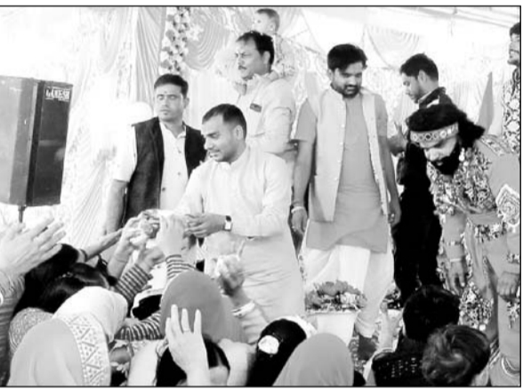
कृष्ण जन्मोत्सव पर बधाइयां बांटी तो श्रद्धालु झूम उठे।