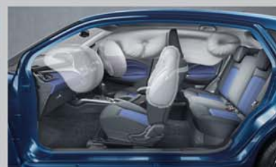
6 Airbags ^