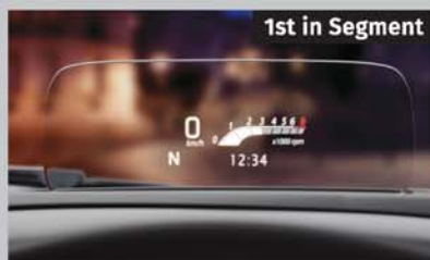
Head Up Display