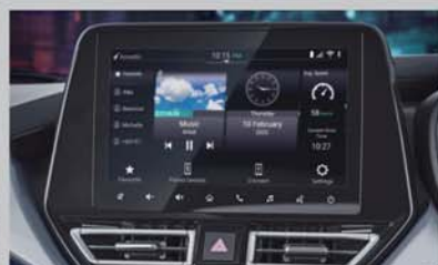
22.86cm SmartPlay Pro+