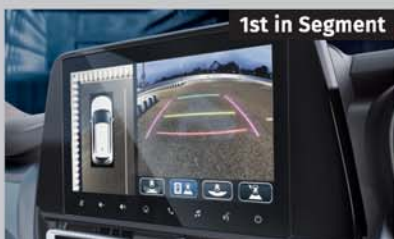
360 View Camera