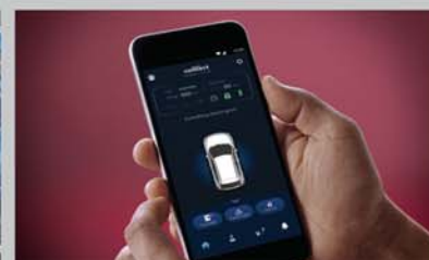
In-built Suzuki Connect

NEXA Safety Shield Standard Across All Variants