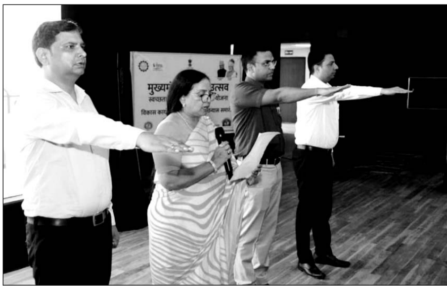
कोटा में संभागीय आयुक्त ने अधिकारियों एवं कर्मचारियों को स्वच्छता की शपथ दिलाई।

जनप्रतिनिधियों, सफाई मित्रों एवं आमजन ने स्वच्छता की शपथ ली। संभागीय आयुक्त राजोरिया ने ऑडिटोरियम के मुख्य द्वार के सामने पौधा रोपण भी किया। केन्द्रीय आवासन एवं शहरी कार्य मंत्रालय के निदेशानुसार इस वर्ष स्वच्छ भारत मिशन के 10 वर्ष पूर्ण होने के उपलक्ष्य में 17 सितम्बर से 1 अक्टूबर तक स्वभाव स्वच्छता - संस्कार स्वच्छता