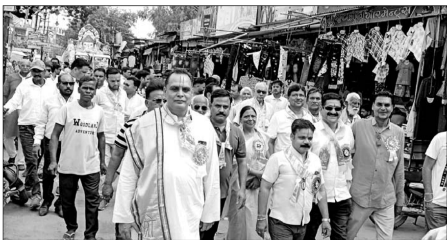
जिलेभर में अनंत चतुर्दशी महोत्सव बड़ी धूमधाम से मनाया गया।

बूंदी (निर्स)। जिले भर में अनंत चतुर्दशी महोत्सव बड़ी धूमधाम से मनाया गया। गणपति बप्पा मोरिया अगले बरस तू जल्दी आ के उद्घोषों के बीच भजनों की धुनो पर नाचते गाते श्रद्धालुओं ने गणपति बप्पा की पूजा अर्चना कर विदा किया। देररात तक शहर में जैतसागर, नवल सागर, बोहरा कुंड सहित मांगली नदी पर एक से 6 फीट तक की लगभग 2500 से ज्यादा छोटी बड़ी प्रतिमाओं का जलाशयों में विसर्जन किया जाता रहा। इससे पूर्व पूरे जोश के साथ गणेश प्रतिमाओं की पूजा अर्चना कर लोगों ने भगवान समक्ष अपनी अपनी प्रार्थनाएं भी की। अनन्त चतुर्दशी के अवसर पर शहर के अलग अलग हिस्सों से गणेश प्रतिमाओं को शोभायात्राएं निकाली गईं। इस दौरान श्रद्धालु दिनभर गणेश प्रतिमाओं को जल्यों के रूप में लेकर विसर्जन स्थल तक लाते रहे।