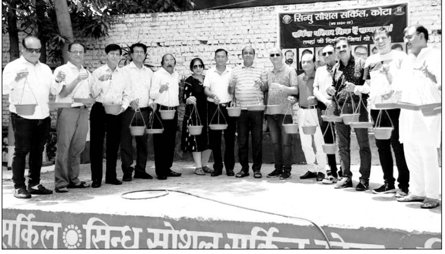
सिंधु सोशल सर्कल के द्वारा पक्षियों के लिए परिण्डे बाँधे गए।

कोटा, (निसं)। विगत 35 वर्षों से सामाजिक सेवा और संस्कृति के संवर्धन के लिए कार्यरत संस्था सिंधु सोशल सर्कल र वरिवार को पक्षियों के लिए परिण्डे, दाना और पशुओं के लिए जल की व्यवस्था की वरिवार को