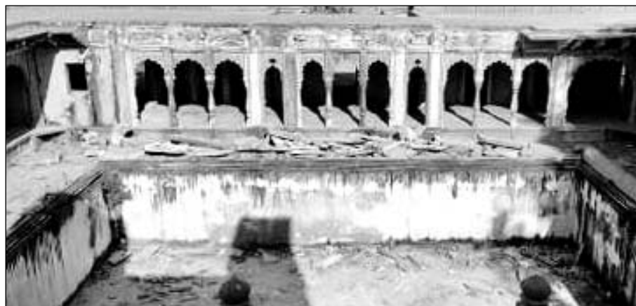
करौली का शिकारगंज महल देखरेख के अभाव में खंड-खंड होता नजर आ रहा है।

करौली, (निर्स)। करौली के शिकारगंज महल में 250 साल पहले कृत्रिम झरना और वातानुकूलित अंडरग्राउंड महल का होना इस बात की तस्दीक करता है कि रियासतकाल में करौली ज़्यादा भव्य थी। लेकिन करोड़ों रुपये खर्च करने के बावजूद आज शिकारगंज महल नशेबाजों का अड्डा बनता जा रहा है। वहीं टूटे पत्थर-जालियों के बीच जगह-जगह शराब की बोतलों के टुकड़े पड़े नजर आ रहे हैं। वहीं देखरेख के अभाव में खंड-खंड होता नजर आ रहा है।