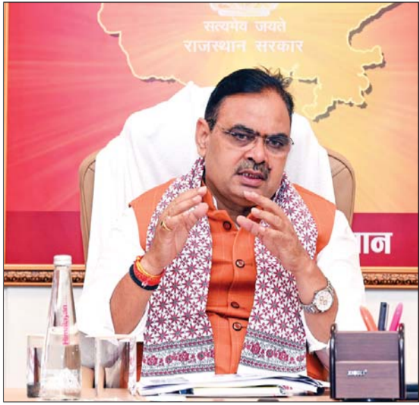
मुख्यमंत्री भजनलाल शर्मा

मुख्यमंत्री भजनलाल शर्मा ने स्पष्ट कर दिया है कि आमजन को