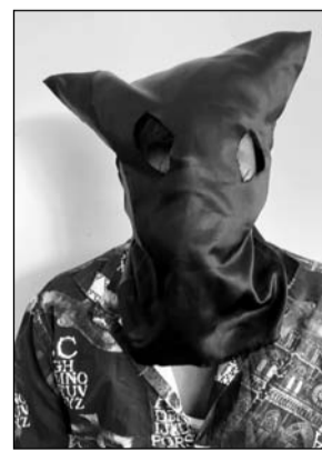
लूट का वांछित आरोपी