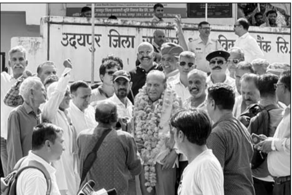
उदयपुर में भूमि विकास बैंक में हंगामे के बीच कांग्रेस के नागदा तीसरी बार अध्यक्ष बने।

उदयपुर, (कासं)। शुक्रवार को उदयपुर भूमि विकास बैंक के चुनाव को लेकर बड़ा हंगामा हुआ। अध्यक्ष और उपाध्यक्ष के चुनाव होने के बाद जैसे ही परिणाम की घोषणा करते समय बैंक के चैनल गेट के बाहर भाजपाई और पुलिस आगमने, सामने हो गए और हंगामे के बीच धक्का मुक्की तक हुई।