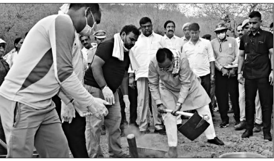
मुख्यमंत्री भजनलाल शर्मा ने शुक्रवार को नींदड वन क्षेत्र में बंदे गंगा जल संरक्षण-जन अभियान के तहत एनिकट पर श्रमदान किया।

जयपुर (कासं)। मुख्यमंत्री भजनलाल शर्मा ने शुक्रवार को नींदड वन क्षेत्र में नींदड-बैनाड बायोडाइवर्सिटी प्रोजेक्ट ईको ट्रेल का उद्घाटन किया। इस अवसर पर उन्होंने बंदे गंगा जल संरक्षण-जन अभियान के तहत एनिकट पर श्रमदान कर आमजन से जल संरचनाओं के संरक्षण एवं संवर्धन में सहभागिता निभाने का आह्वाण किया।