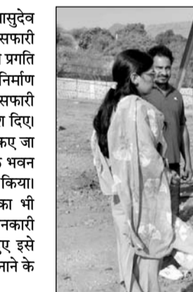
विधानसभा अध्यक्ष वासुदेव देवनानी ने निर्माणाधीन काजीपुरा लैपर्ड सफारी का निरीक्षण कर विभिन्न विकास कार्यों की प्रगति का जायजा लिया।

अजमेर, (निसं)। विधानसभा अध्यक्ष वासुदेव देवनानी ने निर्माणाधीन काजीपुरा लैपर्ड सफारी का निरीक्षण कर विभिन्न विकास कार्यों की प्रगति का जायजा लिया। उन्होंने अधिकारियों को निर्माण कार्यों में तेजी लाकर इस वर्ष के अंत तक सफारी को आमजन के लिए शुरू करने के निर्देश दिए। देवनानी ने सफारी परिसर में विकसित किए जा रहे टिकट काउंटर, मुख्य द्वार, प्रशासनिक भवन तथा अन्य निर्माणाधीन कार्यों का निरीक्षण किया। उन्होंने चौकियों और निगरानी टावरों का भी अवलोकन कर सुरक्षा व्यवस्थाओं की जांचकारी ली। सफारी मार्ग का निरीक्षण करते हुए इसे पर्यटकों के अनुकूल और सुव्यवस्थित बनाने के निर्देश दिए।