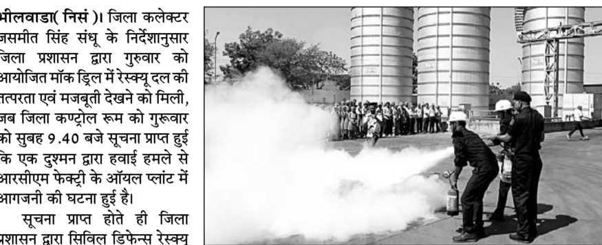
मॉक ड्रिल में रेस्क्यू दल की तत्परता एवं मजबूती देखने को मिली। सक्रिय किए गए और त्वरित चेतावनी प्रसारित की गई। सिविल डिफेंस रेस्क्यू टीम द्वारा ऑयल प्लॉट के अंदर अग्नि प्रभावित क्षेत्र से सभी श्रमिकों को सुरक्षित स्थान पर निकाला गया। इस हमले में 8 श्रमिक घायल हुए जिन्हें मेडिकल टीम द्वारा प्राथमिक उपचार दिया गया।