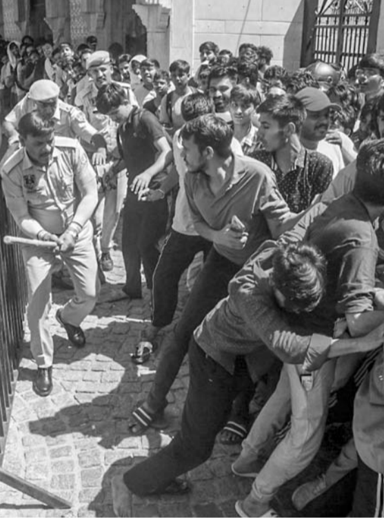
जयपुर में इंडियन प्रीमियर लीग-2026 मैच के स्टूडेंट्स के टिकट 4 घंटे में बिके : टिकट नहीं मिलने युवाओं ने फाड़े बैनर और पुलिस ने चलाये डंडे।