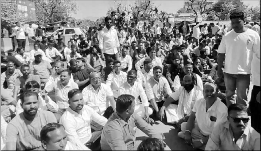
अजमेर में वाल्मीकि समाज के लोगों ने प्रदर्शन किया।