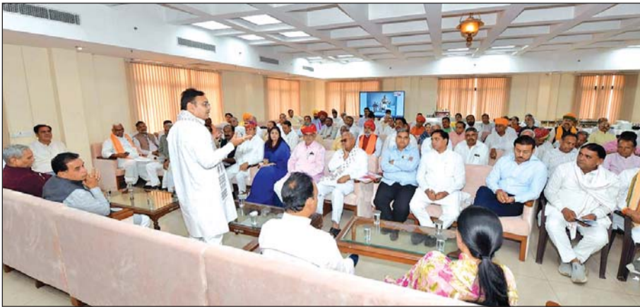
मुख्यमंत्री भजनलाल शर्मा ने मंगलवार को 16 वीं विधानसभा के पांचवें सत्र के अंतिम दिन भाजपा विधायक दल की बैठक ली। विधानसभा के 'हां पक्ष' लॉबी में आयोजित इस बैठक में पार्टी के सभी विधायक मौजूद थे।

■ मुख्यमंत्री भजनलाल शर्मा ने विधायकों से राजस्थान दिवस के कार्यक्रमों में बढ़-चढ़ कर भाग लेने का आह्वान किया।