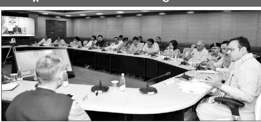
मुख्यमंत्री भजनलाल शर्मा ने पीएम मोदी के दौरे को लेकर बैठक ली और अधिकारियों को निर्देश दिये।

मुख्यमंत्री ने आयोजन स्थल पर आगंतुकों के बैठने की व्यवस्था, पौजल, चिकित्सा, विद्युत आपूर्ति, पार्किंग, यातायात, सुरक्षा सहित अन्य महत्वपूर्ण व्यवस्थाओं के लिए अधिकारियों को निर्देश दिए। उन्होंने ने कहा कि एचआरआएल रिफाइनी में पेट्रोल और डीजल के साथ-साथ