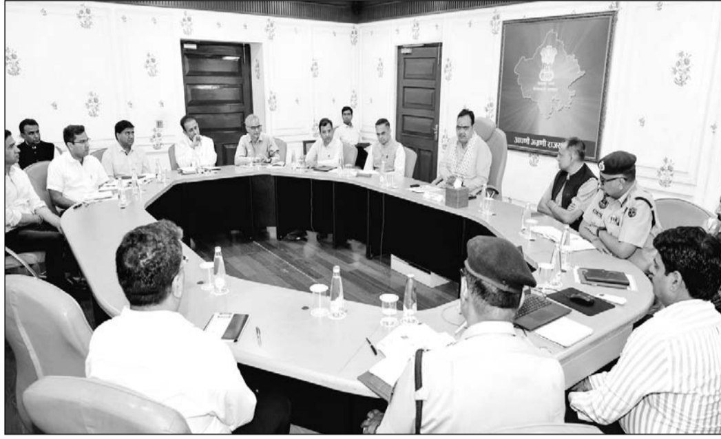
मुख्यमंत्री भजनलाल शर्मा ने गुरुवार को जयपुर शहर के यातायात सुधार के लिए अधिकारियों की उच्चस्तरीय बैठक ली।

-कार्यालय संवाददाता- जयपुर। मुख्यमंत्री भजनलाल शर्मा ने जयपुर शहर की यातायात व्यवस्था के रीयल टाइम मैनेजमेंट के लिए नया इंटीग्रेटेड कमाण्ड सेंटर स्थापित करने की कार्ययोजना बनाने के लिए जेडीए, परिवहन, ट्रैफिक पुलिस और नगर निगम को आपसी समन्वय से काम करने के विशेष दिशा-निर्देश दिए हैं। उन्होंने कहा कि यातायात प्रबंधन एवं सुरक्षा की दृष्टि से इस सेंटर को मॉडल सेंटर भी बनाया जाए। शर्मा गुरुवार को मुख्यमंत्री कार्यालय में जयपुर शहर के यातायात सुधार के लिए आयोजित बैठक की अध्यक्षता कर रहे थे। उन्होंने कहा कि, जयपुर शहर में यातायात प्रबंधन एवं सुधार के लिए प्रगतिरित विभिन्न जेडीए प्रोजेक्ट्स को समय-समय में पूरा करें। इस काम में लापरवाही बरतने वाले जिम्मेदार अधिकारी तथा निर्माणकर्ता के विरुद्ध परफॉर्मस एवं लिक्विडिटी पैनल्टी की कार्यवाही की जाए। यातायात को सुगम एवं सुरक्षित बनाने की कार्ययोजना को जेडीए एवं यातायात पुलिस संबंधित विभागों से समन्वय स्थापित कर शीघ्र लागू करें। उन्होंने जेडीए की सीबीआई फाटक, सालिग्रामपुरा फाटक एवं सिविल लाइन फाटक आरओबी, गोपालपुरा एलिक्ट्रिक रोड, सांगानेर एलिक्ट्रिक रोड के काम को गति प्रदान करने एवं पूर्ण गुणवत्ता से पूरा करने के लिए निर्देशित किया। साथ ही, उन्होंने जेलएन मार्ग पर यातायात प्रबंधन का प्रभावी प्लान बनाने के भी निर्देश दिए।