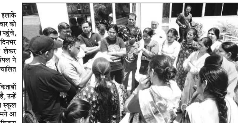
राजधानी जयपुर के श्याम नगर इलाके में “ट्री हाऊस हाई स्कूल” तीसरे दिन गुरुवार को भी बंद रहा, जिसे लेकर अभिभावकों ने कड़ई नाराजगी जताई।