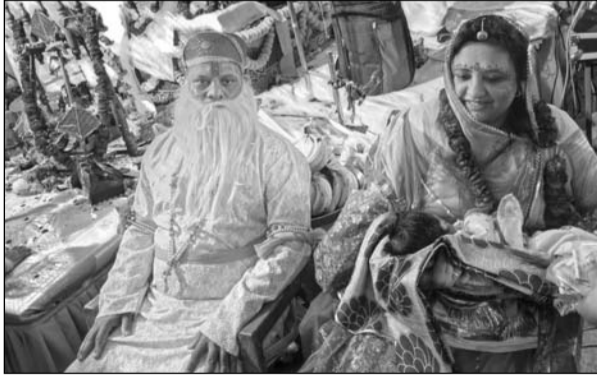
श्रीमद्भागवत कथा के दौरान श्रीकृष्ण जन्मोत्सव की सजी झांकी।