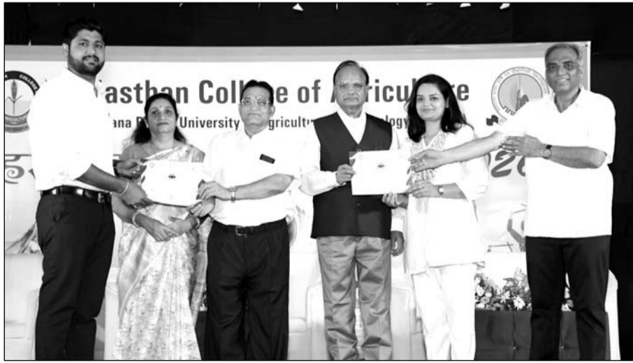
राजस्थान कृषि महाविद्यालय में वार्षिकोत्सव 'हरितिमा-2026' में विद्यार्थियों को प्रशस्ति-पत्र एवं स्मृति चिन्ह प्रदान कर सम्मानित किया गया।