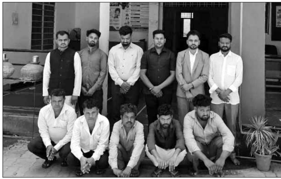
उदयपुरके 20 गांवों में धर्म परिवर्तन मामले में 3 पादरी सहित 11 जनों को गिरफ्तार किया।