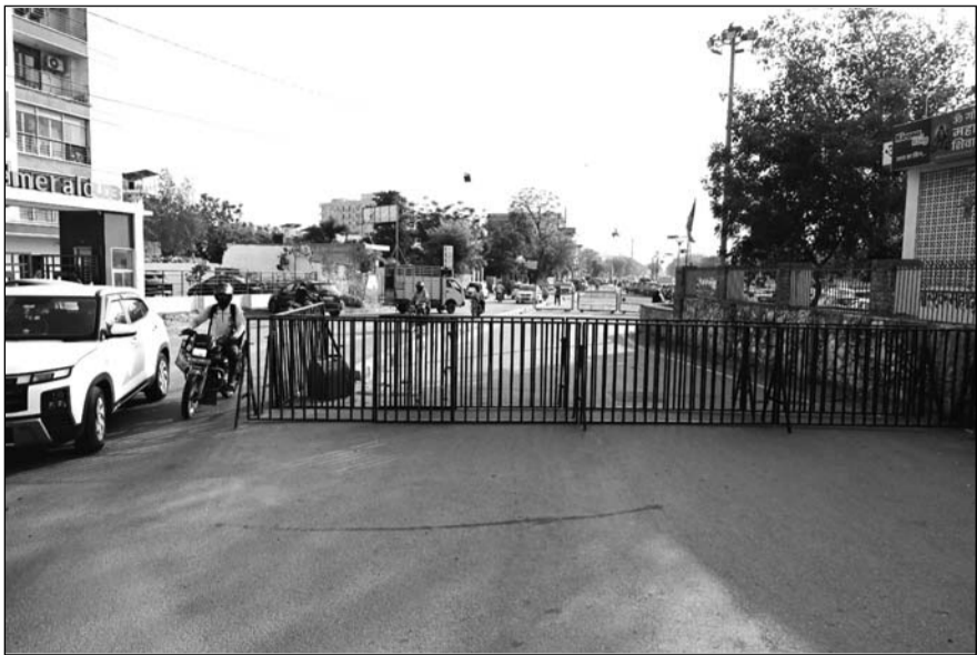
मालवीय नगर क्षेत्र में रविवार को पुलिस और आरएसी कंपनियों के जवानों ने फ्लैग मार्च निकाला। इसके साथ ही नंदपुरी क्षेत्र में बैरिकेड्स लगाकर रास्ते बंद कर दिए हैं।

इंटरनेट-मैसेज और सोशल मीडिया एप्स बंद रहेंगे, बिना अनुमति रैली-जुलूस निकालने पर भी पाबंदी