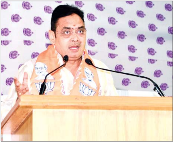
मुख्यमंत्री भजनलाल शर्मा