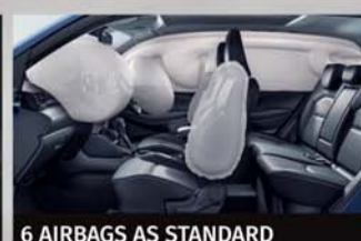
6 AIRBAGS AS STANDARD