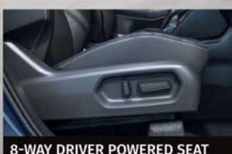
8-WAY DRIVER POWERED SEAT