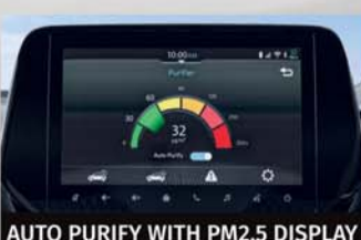
AUTO PURIFY WITH PM2.5 DISPLAY