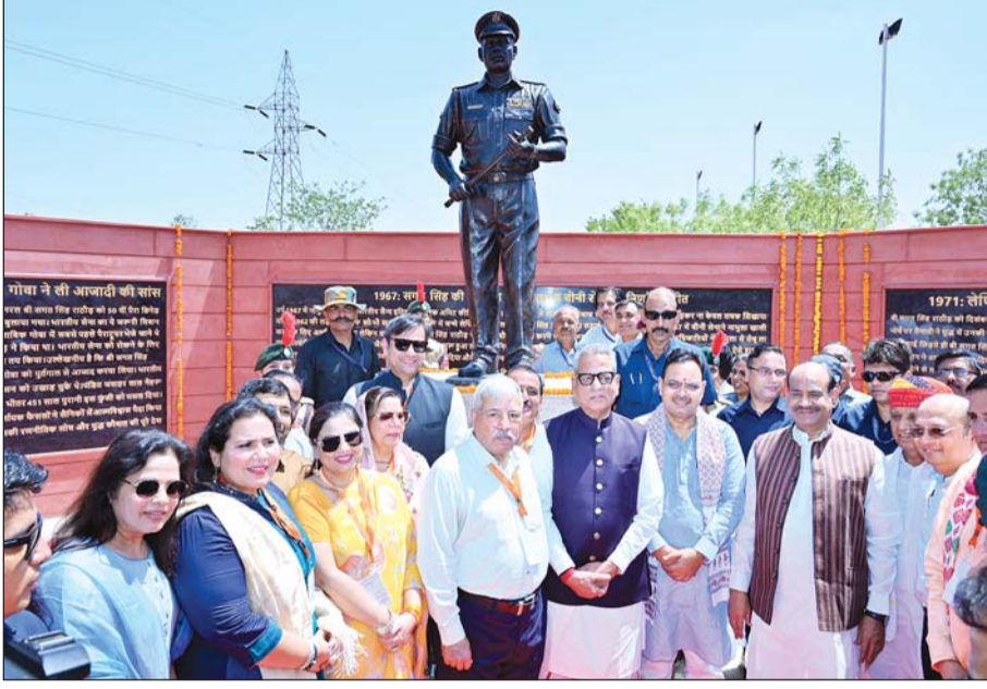
मुख्यमंत्री भजनलाल शर्मा बुधवार को चूरु में आयोजित लेफ्टिनेंट जनरल सगत सिंह राठौड़ के मूर्ति अनावरण कार्यक्रम में शामिल हुए। इस अवसर पर लोकसभा अध्यक्ष ओम बिड़ला, सिक्किम के राज्यपाल ओम माथुर, पूर्व नेता प्रतिपक्ष राजेन्द्र राठौड़ मौजूद थे।

शर्मा बुधवार को चूरु में आयोजित लेफ्टिनेंट जनरल सगत सिंह राठौड़ की मूर्ति अनावरण एवं 'शौर्य के साथ संकल्प दिवस' कार्यक्रम को संबोधित कर रहे थे। उन्होंने कहा कि लेफ्टिनेंट जनरल सगत सिंह ने 19 साल की उम्र में बीकानेर रियासत की सेना में सैन्य जीवन से शुरुआत की। उन्होंने कहा कि हमारी सरकार ने पद्म भूषण और परम विशिष्ट सेवा मेडल से सम्मानित लेफ्टिनेंट जनरल सगत सिंह राठौड़ के सम्मान में चूरु स्टेडियम का नाम सगत सिंह राठौड़ स्टेडियम किया है। मुख्यमंत्री ने कहा कि हमारी सरकार सैनिक कल्याण के लिए सजग होकर निरन्तर कार्य कर रही है। डीडवाना-कुचामन में राजस्थान के पहले एकीकृत सैनिक कल्याण परिसर की स्थापना की तथा नवीन जिला सैनिक कल्याण