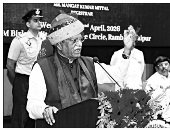
राज्यपाल हरिभाऊ बागडे ने बुधवार को विश्वकर्मा कौशल विश्वविद्यालय के द्वितीय दीक्षांत समारोह को संबोधित किया।

-कार्यालय संवाददाता- जयपुर। राज्यपाल हरिभाऊ बागडे ने कहा कि कौशल शिक्षा का उपयोग राष्ट्र के सर्वांगीण विकास के लिए होना चाहिए। उन्होंने कहा कि जिसके पास अच्छा कौशल है, उसे सभी स्थानों पर काम मिलता है, वह कभी भूखा नहीं रहता। उन्होंने कौशल शिक्षा के साथ विश्वविद्यालयों में नैतिक शिक्षा को बढ़ावा दिए जाने पर जोर दिया। उन्होंने कहा कि नैतिक मूल्यों की शिक्षा से भौतिक विकास की गुणवत्ता में वृद्धि होती है। राज्यपाल बागडे बुधवार को विश्वकर्मा कौशल विश्वविद्यालय के द्वितीय दीक्षांत समारोह में संबोधित कर रहे थे।