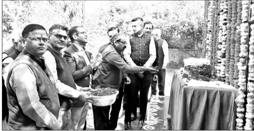
भरतपुर स्थापना दिवस पर महाराजा सूरजमल स्मारक पर पुष्पांजलि कार्यक्रम आयोजित हुआ।