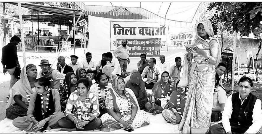
शाहपुरा जिला बचाओ संघर्ष समिति द्वारा उपखंड कार्यालय शाहपुरा के बाहर क्रमिक अनशन जारी है।