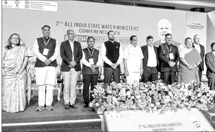
सम्मेलन के समापन कार्यक्रम में केंद्रीय जलशक्ति मंत्री सीआर पाटिल सहित कई अतिथि मौजूद रहे।

उन्होंने कहा कि आज भारत में लोगों के लिए स्वच्छ और सुरक्षित पेयजल उपलब्ध होना एक आत बर गई है। यह परिवर्तन प्रधानमंत्री नरेंद्र मोदी के दूरदर्शी नेतृत्व और जलशक्ति मंत्रालय के सतत प्रयासों का परिणाम है। हमने जल संरक्षण और प्रबंधन को एक नई दिशा दी है और इस दिशा में हमें और अधिक प्रतिबद्धता के साथ कार्य करना होगा। केंद्रीय जल शक्ति मंत्री सी आर पाटिल ने कहा कि इस सम्मेलन के दौरान मुझे विभिन्न राज्यों और विशेषज्ञों से महत्वपूर्ण सुझाव प्राप्त