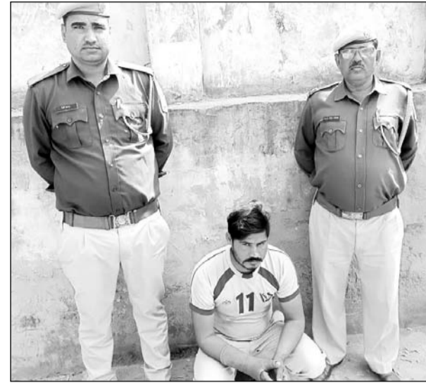
पुलिस ने दुष्कर्म के आरोपी को गिरफ्तार किया।