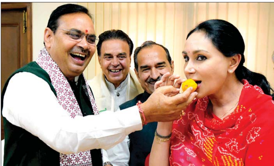
बुधवार को विधानसभा में उपमुख्यमंत्री एवं वित्त मंत्री दिया कुमारी ने राज्य बजट वर्ष 2025-26 प्रस्तुत किया। मुख्यमंत्री भजनलाल शर्मा ने मिठाई खिलाकर उन्हें बधाई दी।

मुख्यमंत्री ने कहा कि गत वर्ष जुलाई में प्रस्तुत परिवर्तित बजट में 96 प्रतिशत से अधिक घोषणाओं में भूमि आवंटन हो चुका है तथा 85 प्रतिशत में प्रशासनिक व वित्तीय स्वीकृति जारी हो चुकी है।