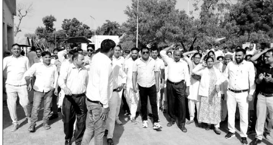
मांगों को लेकर राजस्थान नर्सिंज संयुक्त संघर्ष समिति के बैनर तले विरोध-प्रदर्शन किया।

जिला अस्पताल में दो घंटे वार्डों में व्यवस्था चरमराई