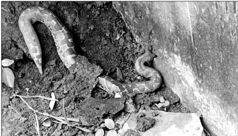
सेडुलाई कॉलोनी के एक घर में निकला विशालकाय 6 फीट लंबा अजगर।

वहीं मौके पर पहुंची वन विभाग की टीम द्वारा संभावित किसी अन्य