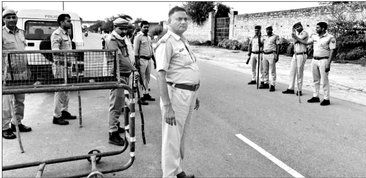
हरियाणा के नूंह में ब्रज मण्डल यात्रा के दौरान हिंसा और बवाल के बाद भरतपुर में पुलिस ने बॉर्डर को सील कर दिया।

हरियाणा के नूंह में ब्रज मण्डल यात्रा के दौरान हिंसा और बवाल के बाद भरतपुर में अलर्ट जारी किया गया