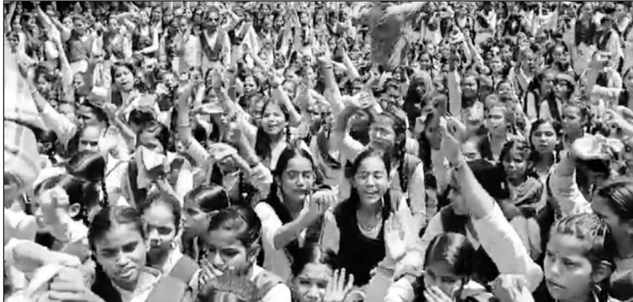
विद्यालय के बाहर स्टेट हाइवे धौलपुर-बसेड़ी की मुख्य सड़क पर बैठी बालिकाएं।

धौलपुर, (निसं)। जिले में बाड़ी शहर के सीनियर सेकेंडरी बालिका विद्यालय में मंगलवार को उस वक़्त हंगामा खड़ा हो गया। जब स्कूल की सैकड़ों बालिका ने विद्यालय के बाहर स्टेट हाइवे धौलपुर-बसेड़ी की मुख्य सड़क पर बैठ गई और विरोध प्रदर्शन करने लगी। विद्यार्थी परिषद के बैनर तले हो रहे इस विरोध प्रदर्शन के पीछे विद्यालय परिसर के बगल में बन रही दो दुकानों के नव निर्माण का कारण बताया जा रहा है। विरोध कर रही विद्यालय की छात्राओं ने आरोप लगाया कि स्कूल की जगह में अवैध निर्माण हो रहा है। वहीं स्कूल प्रशासन ने बताया कि स्कूल की जगह पर नगर पालिका द्वारा पूर्व में पट्टा काट दिया गया था, जबकि भूमि विद्यालय के खसरा नम्बर में बोल रही है। जिसका मामला कोर्ट में चल रहा है। ऐसे में विद्यालय की छात्राओं ने आक्रोशित होकर विरोध प्रदर्शन किया