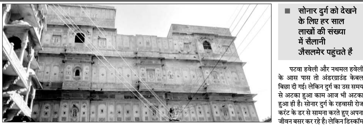
विश्वविख्यात सोनार दुर्ग में तारों का जंजाल।