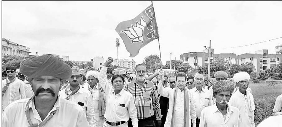
गंगापुर सिटी से सचिवालय घेराव के लिए रवाना होते भाजपा कार्यकर्ता।

गंगापुर सिटी, (निसं)। भारतीय जनता पार्टी नेतृत्व द्वारा नहीं सहंगा राजस्थान अभियान के अंतर्गत कांग्रेस सरकार के भ्रष्टाचार, कुशासन, बिगाडती कानून व्यवस्था, युवा, महिला एवम किसान विरोधी नीतियों के खिलाफ मंगलवार को आयोजित सचिवालय महाधेराव कार्यक्रम में भारतीय जनता पार्टी गंगापुर सिटी से अनेक बड़े व छोटे वाहनों के माध्यम से प्रातः 8 बजे रवाना होकर पहुंचे। कार्यक्रम में समस्त प्रदेश सदाधिकारियों द्वारा प्रदेश की कांग्रेस सरकार पर रीट पेपर लीक मामला महिलाओं के बढते ग्राफ, बिजली के बिलों की दर में अधोषिक्त बढोती, युवाओं की बेरोजगारी भत्ते के मामले में चादाखिलाफि, समूचे प्रदेश के किसानों को खाद बीज उपलब्ध करने की अपसफलता जैसे मुद्दों को गलत तरीके से उठाया गया। समस्त