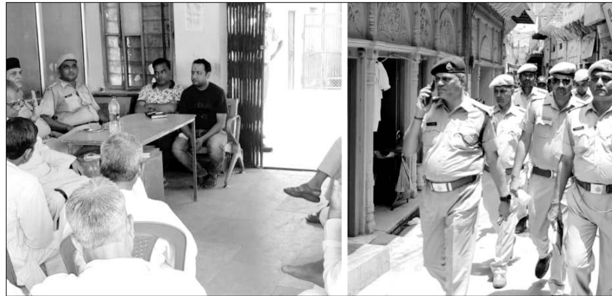
उपखंड अधिकारी तथा कामा के एडिशनल ने जुरहरा थाने पर सीएलजी सदस्यों की बैठक ली। वहीं पुलिस ने फ्लैग मार्च किया।