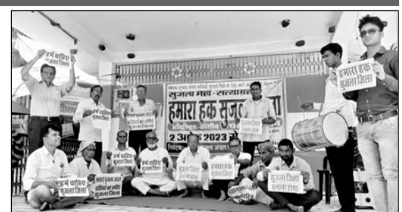
सुजानगढ़ जिले की मांग के समर्थन में प्रदर्शन करते हुए धरनार्थी।