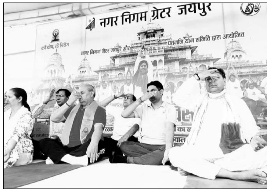
भारतीय जनता पार्टी के प्रदेश अध्यक्ष डॉ.सतीश पूनिया ने जयपुर के एस्पएमएस स्टेडियम में पतंजलि योगपीठ की ओर से आयोजित योग कार्यक्रम में भाग लेकर योग किया।

उन्होंने प्रदेशवासियों को अंतर्राष्ट्रीय योग दिवस की शुभकामनाएं देते हुए