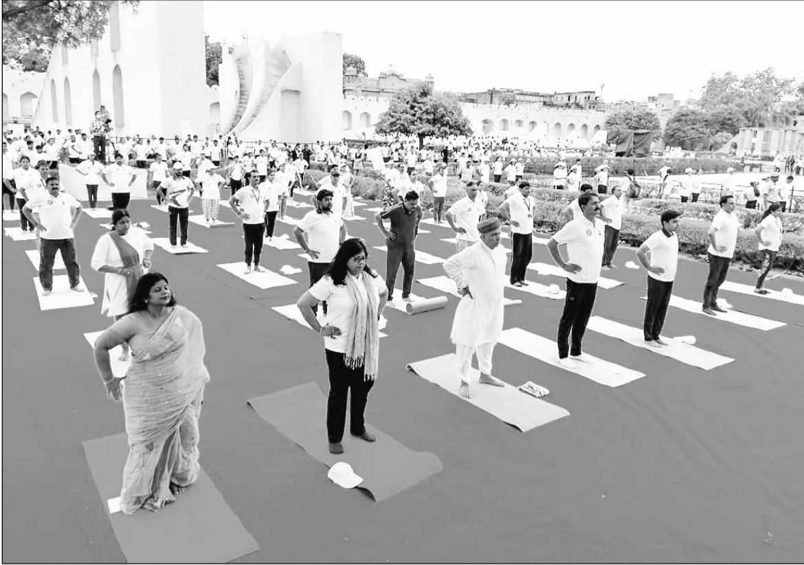
अंतर्राष्ट्रीय योग दिवस पर मंगलवार को केन्द्रीय मंत्री अर्जुनराम मेघवाल ने जयपुर के जंतर-मंतर पर योग किया। राष्ट्रीय आयुर्वेद संस्थान तथा अन्य की ओर से आयोजित इस कार्यक्रम में बड़ी संख्या में लोगों ने भाग लिया।