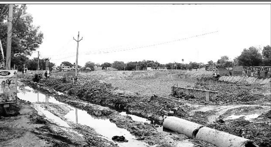
पालिका चेयरमैन व ठेकेदार की मिलीभगत से अधूरा पड़ा सेसाड़ा जोहड़।

लगभग 3 महीने से खुदाई कार्य चलने के बाद भी शमशान में शवों को ले जाने वाला मार्ग पूरी तरह से अवरुद्ध है। अवरुद्ध मार्ग में भरा हुआ भारी कीचड़ और उसी के साथ पीड़ित परिवजनों के कंधों पर शव निरंतर देखा जा रहा है। नगर पालिका क्षेत्र के सेसाड़ा जोहड़ के नजदीकी लोगों का कहना है कि नगरपालिका बहरोड़ के चेयरमैन व नगर पालिका के अधिकारी व कर्मचारियों सहित ठेकेदार के कर्मचारियों ने कार्य को जल्द पूर्ण करने की बजाय जानबूझकर भ्रष्टाचार करते हुए मोटा पैसा