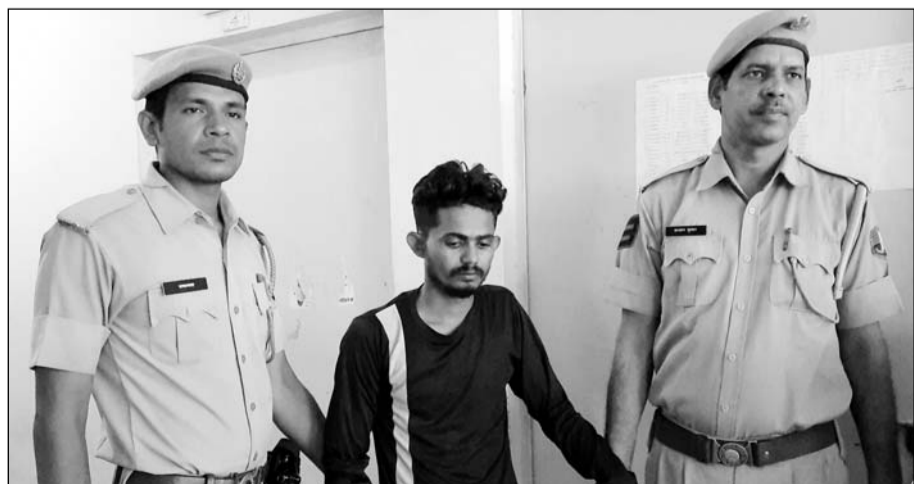
उपचार कराने आई युवती से बलात्कार करने वाला आरोपित को पुलिस ने पकड़ने में सफलता हासिल की।