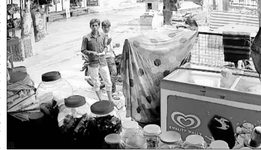
दुकान पर लगे सीसीटीवी कैमरे में कैद हुई पूरी वारदात के बाद पुलिस आरोपियों की तलाश में जुट गई।