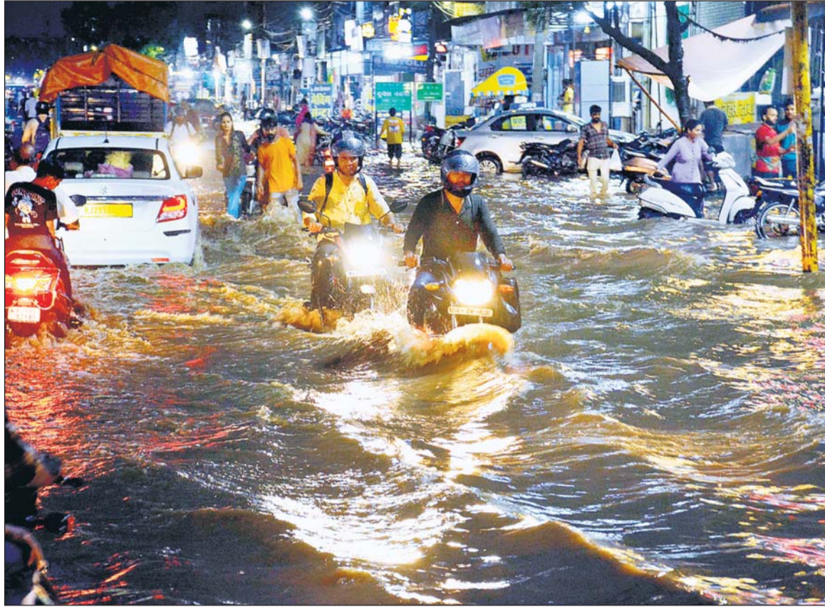
भारी बारिश के बाद जयपुर की सड़कों पर पानी भर गया। यह नजारा निवारण रोड का है जहां पानी भरने के कारण पहले से टूटी सड़क ने समस्या और ज्यादा बढ़ा दी। अनेक दुपहिया व चौपहिया वाहन गड्डों में फंस गए। राहगीरों को देर तक अपने वाहनों को सुरक्षित निकालने के लिए मशकत करते देखा गया। पूरे शहर भर की मुख्य सड़कों पर यही हालात देखे गए। (विस्तृत समाचार अंतिम पृष्ठ पर)