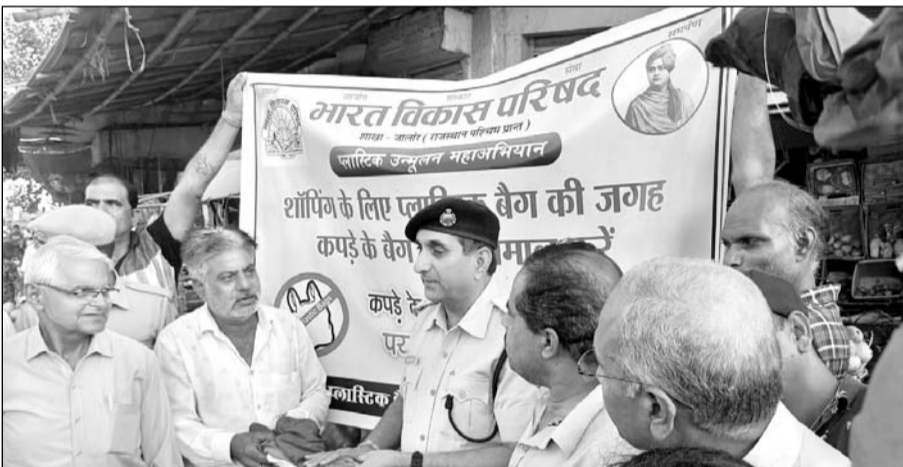
जालौर में भारत विकास परिषद ने प्लास्टिक उन्मूलन अभियान का शुरुआत की।