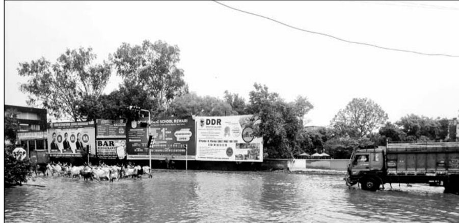
भिवाड़ी में सड़कों से काला और प्रदूषित पानी हुआ गायाव।