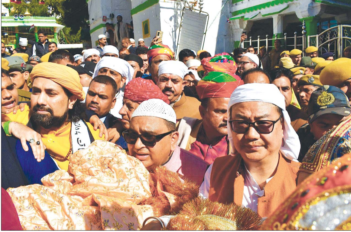
अजमेर में सूफी संत हज़रत खाजा मोइनुद्दीन हसन चिश्ती की दरगाह में केन्द्रीय मंत्री किरण रिजिजू ने प्रधानमंत्री नरेंद्र मोदी की चादर पेश की। उन्होंने देश में अमन-चैन और भाईचारे की दुआ मांगी और प्रधानमंत्री का संदेश पढ़ कर सुनाया।