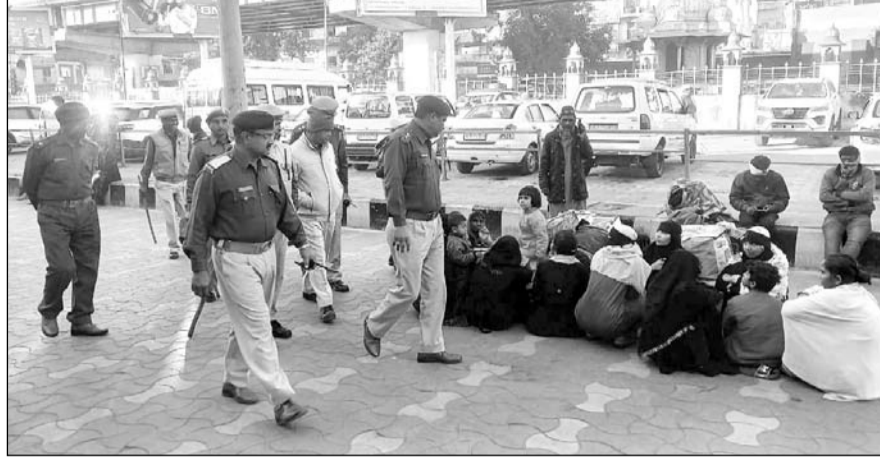
उत्तर-पश्चिम रेलवे सुरक्षा बल अजमेर मंडल द्वारा रेलवे स्टेशन अजमेर की सुरक्षा व्यवस्था के माकूल इंतजाम किये गये हैं।

अजमेर, (कास)। उत्तर-पश्चिम रेलवे सुरक्षा बल अजमेर मंडल द्वारा खजा मोड़नुदीन हसन चिश्ती की दरगाह के 813वें उर्स के मद्देनजर रेलवे स्टेशन अजमेर की सुरक्षा व्यवस्था के माकूल इंतजाम किये गये हैं। रेलवे स्टेशन पर रेलवे सुरक्षा बल थाना अजमेर द्वारा 260 अधिकारी, स्टाफ की तैनाती की गई है। पूरे अजमेर स्टेशन पर निगरानी के लिए 123 सीसीटीवी कैमरे स्थापित हैं तथा दौरा एवं मदार स्टेशनों पर भी 15-15 कैमरे स्थापित किये गये हैं, जिससे संदिग्ध व्यक्तियों की गतिविधियों पर सूक्ष्म निगरानी की जा रही है।