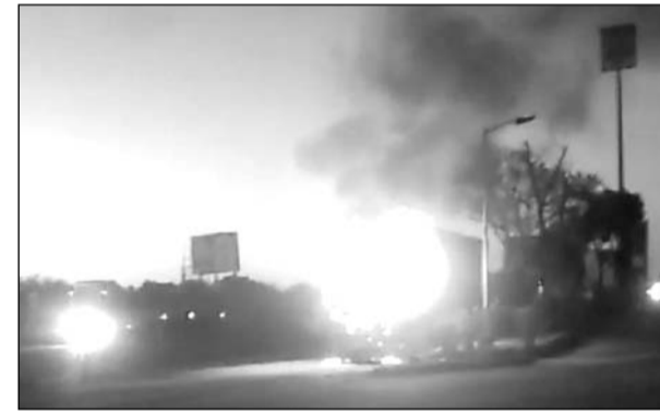
दिल्ली-अजमेर हाइवे पर बिलौची के पास कन्टेनर में आग लग गई।