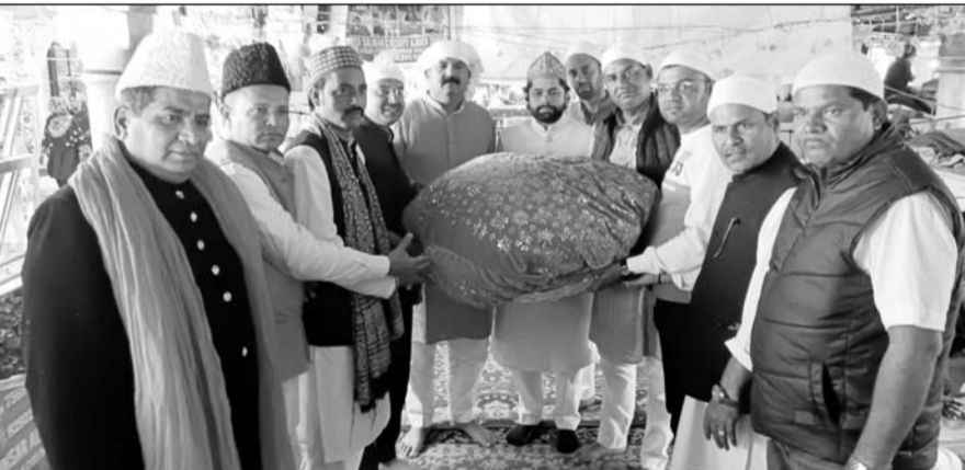
ख्वाजा मोड़नुदीन हसन चिश्ती के उर्स के मौके पर वसुंधरा राजे की ओर से भेजी गई चादर पेश की।