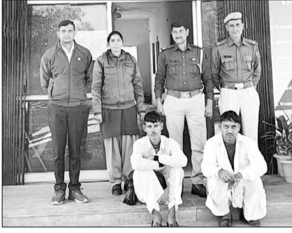
पुलिस ने डोडा-पोस्त परिवहन करते दो आरोपियों को गिरफ्तार किया।