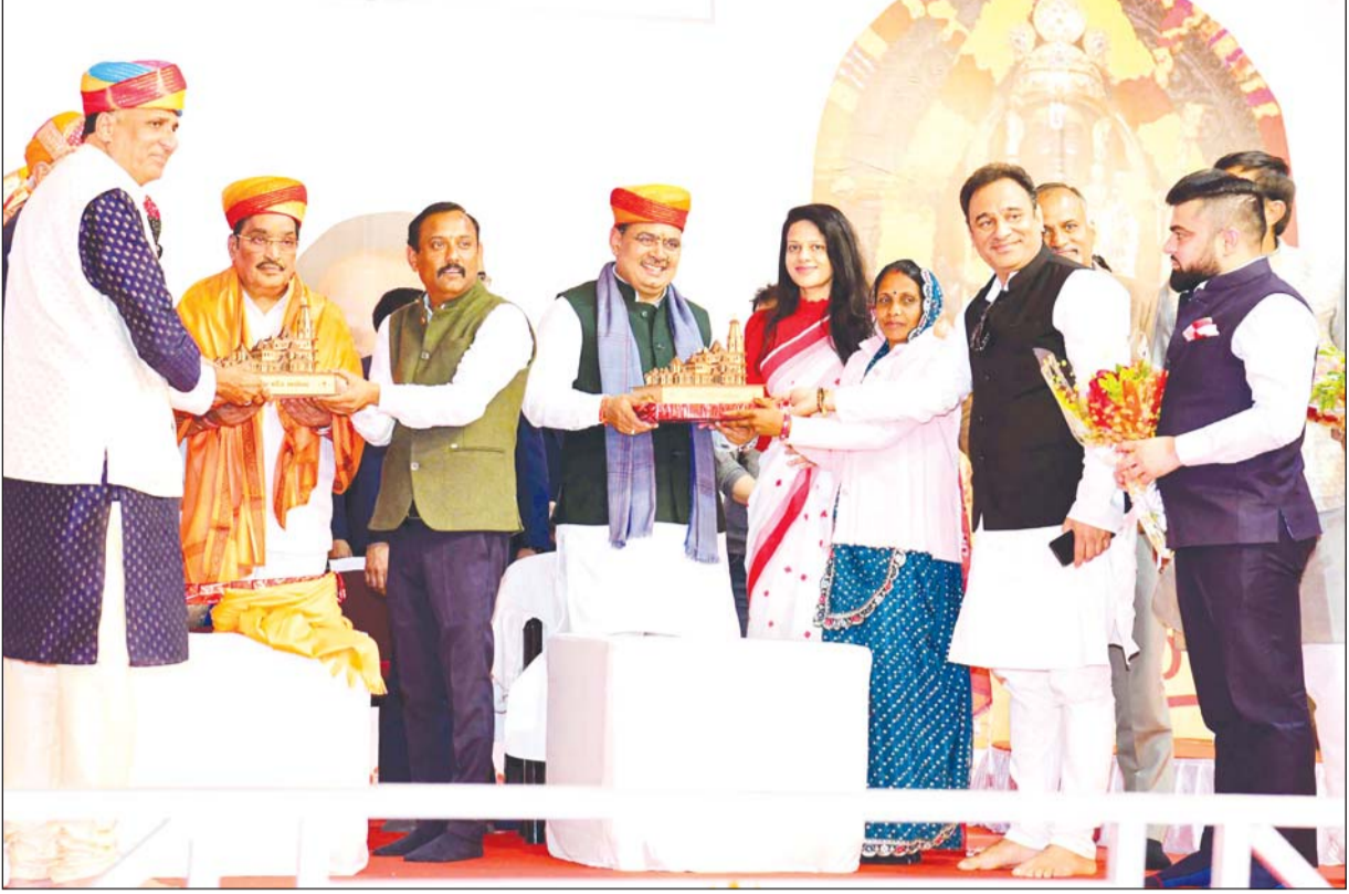
इंगुरपुर जिले के खडगदा गांव में मुख्यमंत्री भजनलाल शर्मा एवं केंद्रीय जल शक्ति मंत्री सी.आर. पाटिल का प्रतीक चिन्ह देकर स्वागत किया गया। खडगदा में उन्होंने साबरमती रिवर फ्रंट की तर्ज पर मोरन नदी और जल संरक्षण को लेकर किए जा रहे भागीरथ प्रयास का अवलोकन किया।