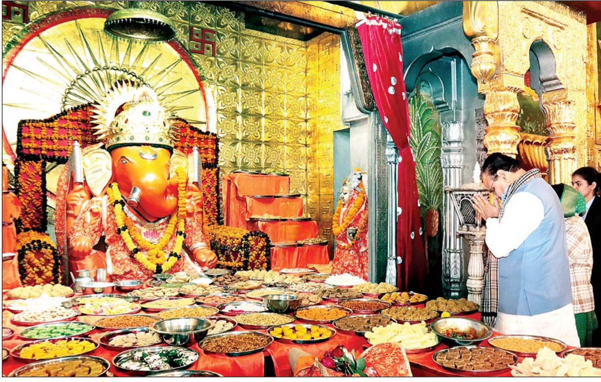
मुख्यमंत्री भजनलाल शर्मा ने नववर्ष पर मोतीदुंगरी गणेश मन्दिर में दर्शन किए। उन्होंने विधिवत पूजा-अर्चना कर प्रदेश के विकास और आमजन की खुशहाली की कामना की।