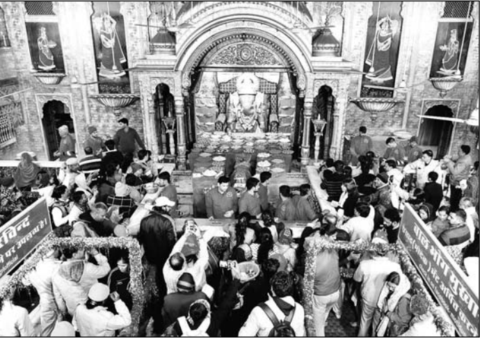
नववर्ष 2025 के प्रथम दिन भगवान गणेश के दर्शनों के लिए मोतीडूंगरी मंदिर में हजारों श्रद्धालु उमड़े मंदिर के बाहर लोगों ने कतार में लगकर अपनी बारी का इंतजार किया।

प्रभु दर्शन के साथ लोगों ने किया नववर्ष 2025 का शुभारंभ, पर्यटन स्थलों पर भी भीड़ रही