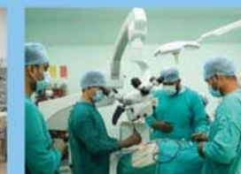
मॉड्यूलर ऑपरेशन थियेटर