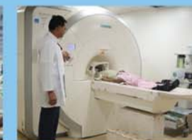
1.5 टेस्ला एम.आर.आई.