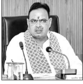
मुख्यमंत्री भजनलाल शर्मा

—कार्यालय संवाददाता— जयपुर। मुख्यमंत्री भजनलाल शर्मा के नेतृत्व में राजस्थान में आधारभूत ढांचे के विकास को नई गति मिली है। रेलवे, सड़क, ऊर्जा, पेट्रोलियम और नागरिक उड्डयन जैसे महत्वपूर्ण क्षेत्रों में बड़े स्तर पर परियोजनाओं पर काम चल रहा है। सांख्यिकी एवं कार्यक्रम कार्यान्वयन मंत्रालय की 'पैमाना' रिपोर्ट के अनुसार प्रदेश में 2.72 लाख करोड़ रुपए से अधिक लागत की कुल 81 परियोजनाएं प्रगतिरत हैं, जिससे राजस्थान की विकास यात्रा को नई दिशा मिल रही है।