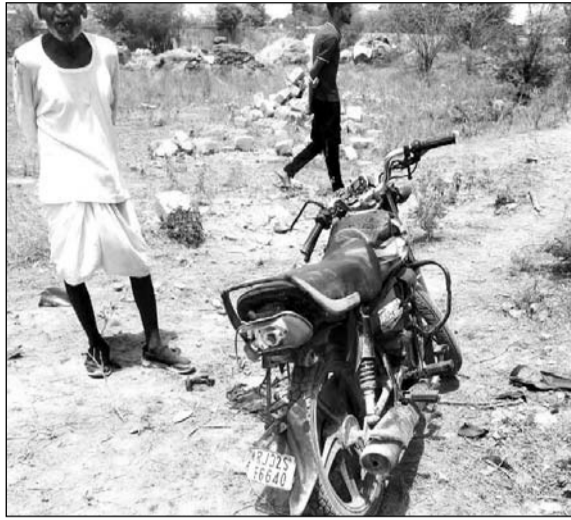
बदमाशों ने मौके पर खड़ी बाइकों में तोड़फोड़ कर दी।