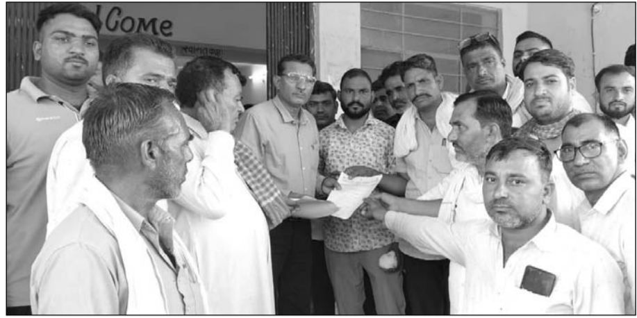
ग्रामीणों ने मुख्यमंत्री के नाम तहसीलदार को ज्ञापन सौंपकर शीघ्र समस्या समाधान की मांग की।

राजलदेसर, (निसं)। राजलदेसर कस्बे के निकटवर्ती ग्राम पंचायत बिनादेसर में दो वर्ष से जारी पेयजल संकट को लेकर सोमवार को ग्रामीणों और कर्मियों का आक्रोश खुलकर सामने आया। लंबे समय से पानी की समस्या से जूझ रहे ग्रामीणों ने तहसील कार्यालय पहुंचकर प्रदर्शन किया और मुख्यमंत्री के नाम तहसीलदार को ज्ञापन सौंपकर शीघ्र समस्या समाधान की मांग की।