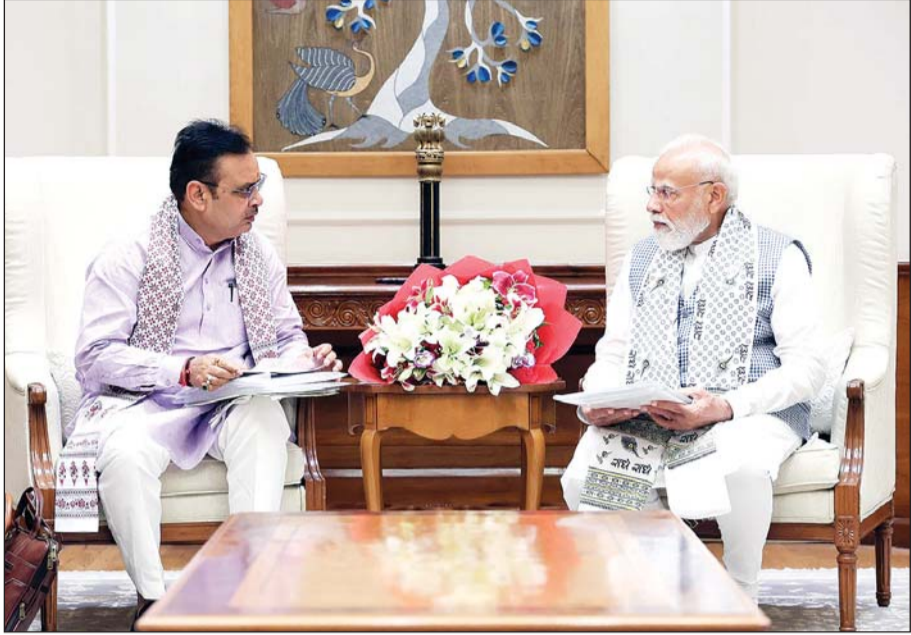
मुख्यमंत्री भजनलाल शर्मा ने सोमवार को नई दिल्ली में प्रधानमंत्री नरेन्द्र मोदी से उनके निवास पर शिष्टाचार भेंट की।

उन्होंने प्रधानमंत्री के साथ विकास, सुशासन व जन कल्याण से जुड़े विषयों पर गहन चर्चा की