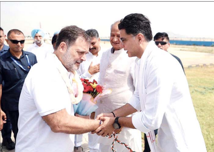
लोकसभा के नेता प्रतिपक्ष राहुल गांधी पुष्कर में नवनिर्वाचित जिलाध्यक्षों के प्रशिक्षण शिविर के समापन सत्र में पहुंचे। इस दौरान कांग्रेस महासचिव सचिन पायलट व नेता प्रतिपक्ष टीकाराम जूली ने किशनगढ़ एयरपोर्ट पर उनका स्वागत किया।

उन्होंने राजस्थान में कांग्रेस प्रदेशाध्यक्ष गोविंद सिंह डोटासरा और नेता प्रतिपक्ष टीकाराम जूली की जोड़ी को "जय-वीरू" की जोड़ी जैसी बताते हुए तारीफ की। उन्होंने कहा कि यह