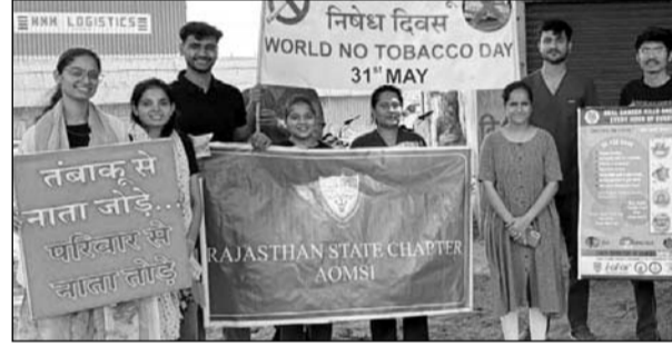
पीएमसीएच में डर्मेटोसर्जरी और डर्मटोपैथोलॉजी पर राष्ट्रीय कार्यशाला का आयोजन हुआ।

उदयपुर, (कासं)। पैसिफिक मेडिकल कॉलेज एंड हॉस्पिटल के त्वचा रोग (डर्मेटोलॉजी) एवं पैथोलॉजी विभाग के संयुक्त तत्वाधान में "डर्मेटोसर्जरी एवं डर्मटोपैथोलॉजी-बैसिक टू एडवांस्ड" विषय पर दो दिवसीय राष्ट्रीय सीएमई एवं कार्यशाला का समापन हुआ।