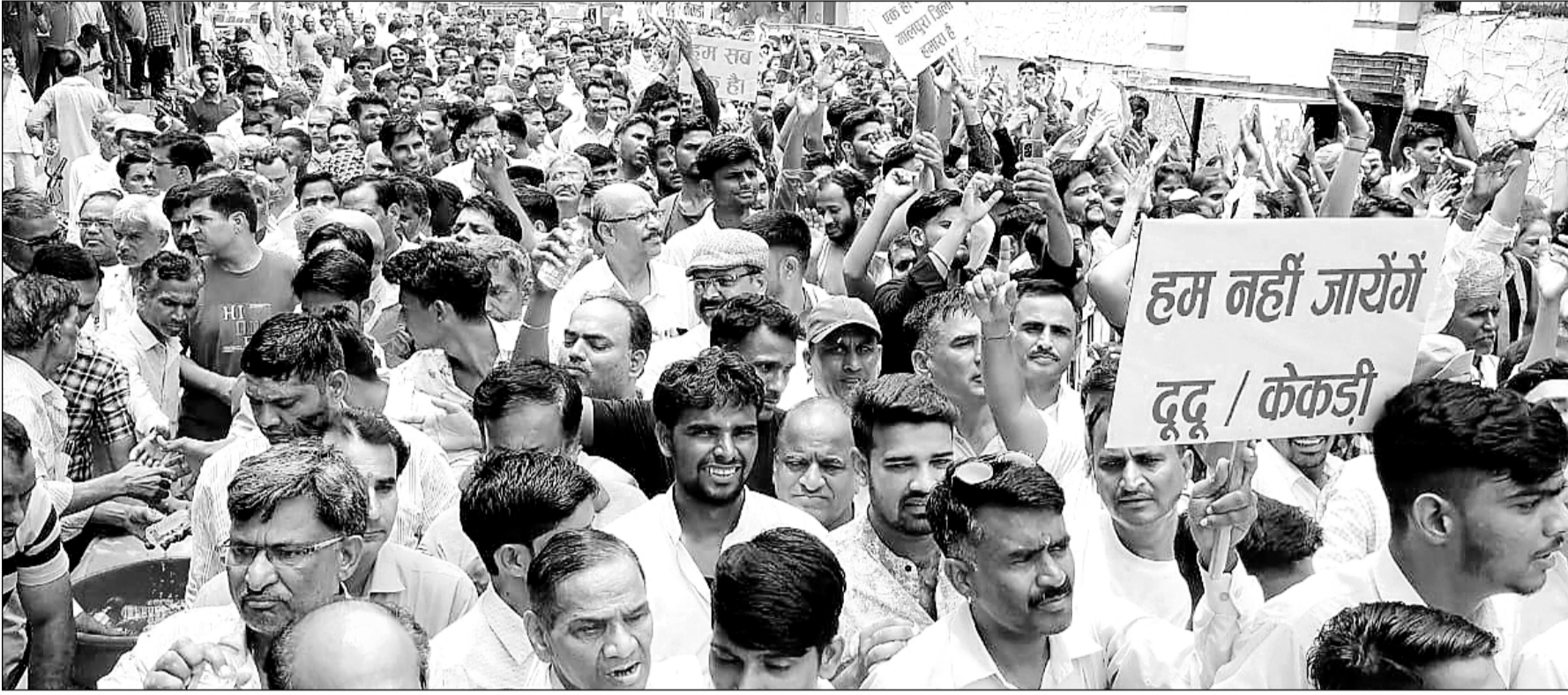
मालपुरा को जिला बनाने की मांग को लेकर सड़कों पर उतरे जनसैलाब ने महारैली निकाल जयपुर-भीलवाड़ा स्टेट हाइवे को जाम कर दिया।

मालपुरा शहर सहित उपखण्ड क्षेत्र की 38 ग्राम पंचायत मुख्यालयों पर बाजार बंद पूर्ण सफल रहे