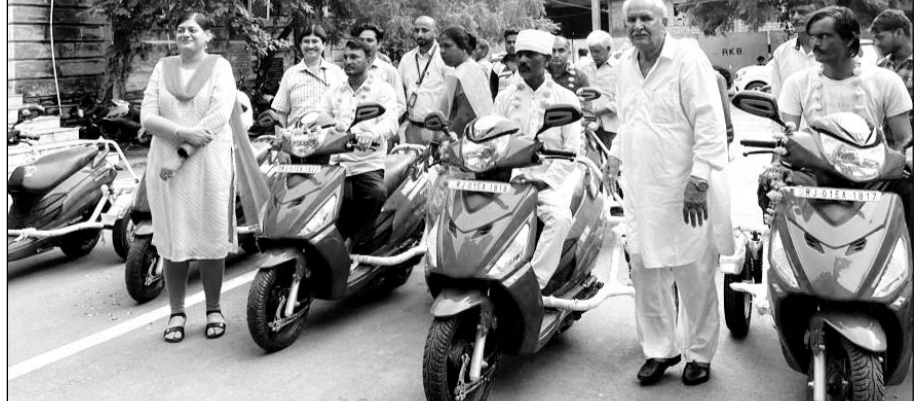
जिला कलेक्टर डॉ. भारती दीक्षित की मौजूदगी में स्कूटी का वितरण किया।

अजमेर, (कासं)। जिला कलेक्टर डॉ. भारती दीक्षित ने गुरुवार को कलेक्ट्रेट परिसर में आयोजित मुख्यमंत्री दिव्यांग स्कूटी वितरण कार्यक्रम में 32 दिव्यांगों को स्कूटी वितरित की। जिला कलेक्टर डॉ. भारती दीक्षित ने कहा कि दिव्यांगों को दैनिक जीवन में सामान्य व्यक्ति से अधिक संघर्ष करना पड़ता है। सरकार इनके संघर्ष को कम करने के लिए सदैव तत्पर है। मुख्यमंत्री अशोक गहलोत द्वारा घोषित मुख्यमंत्री दिव्यांग स्कूटी वितरण कार्यक्रम इसी दिशा में ही एक कार्य है। सरकार द्वारा अजमेर जिले के लिए 170 दिव्यांगों को स्कूटी आवंटित हुई थी। इससे पूर्व 138 दिव्यांगों को स्कूटी