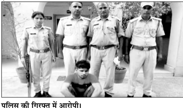
पुलिस की गिरफ्तार में आरोपी।