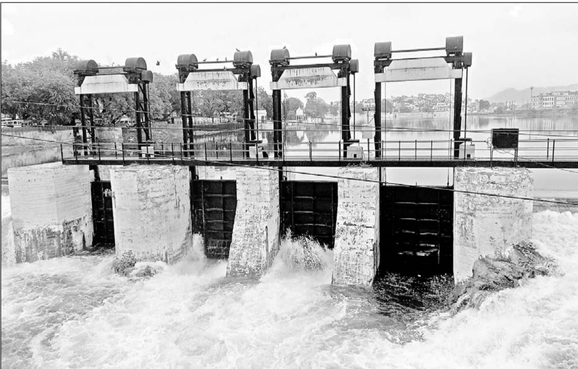
उदयपुर की पीछोला झील के छलकने के बाद स्वरूपसागर के दो गेट तीन-तीन इंच खोले गए।

जगहों पर अच्छी बारिश के समाचार मिले हैं। वहीं शहर में गुरुवार को भी दिनभर उमस रही हालांकि शाम चार बजे बाद बादलों की आवाजाही रही और शाम को बूंदबांदी का दौर शुरू हो गया। जिले में शाम पांच बजे तक बीते 12 घंटों में सर्वाधिक बारिश ओगणा में 34 मिमी रिकॉर्ड की गई है। बुधवार को शहर सहित केचमेंट क्षेत्र में हुई अच्छी बारिश के चलते