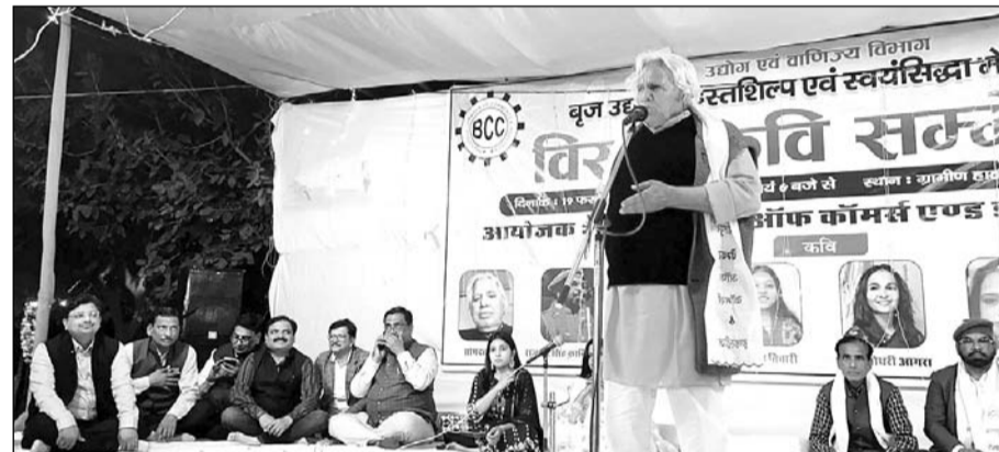
भरतपुर के हाट कम्पनी बाग में चल रहे ब्रज उद्योग-हस्तशिल्प मेले में कवियों ने अपनी कविताएं प्रस्तुत की।