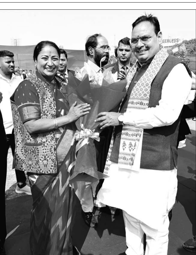
मुख्यमंत्री भजनलाल शर्मा ने दिल्ली की नई मुख्यमंत्री रेखा गुप्ता को गुलदस्ता भेंट कर बधाई दी। शर्मा मुख्यमंत्री के शपथ ग्रहण समारोह में शामिल होने दिल्ली गए थे। समारोह में प्रधानमंत्री नरेन्द्र मोदी मुख्य अतिथि थे। मुख्यमंत्री भजनलाल शर्मा ने कहा कि प्रधानमंत्री नरेन्द्र मोदी के नेतृत्व में डबल इंजन सरकार दिल्ली के विकास को नई दिशा और गति प्रदान करेगी। समारोह में शामिल हुईं दीया कुमारी ने कहा, भाजपा सरकार दिल्ली में सुशासन के नए मानक स्थापित करेगी, दिल्ली को स्वच्छ व सुंदर बनाएगी।