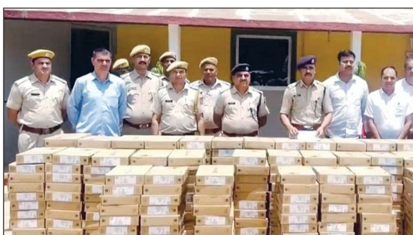
लैपटॉप चोरी प्रकरण में आरोपी को गिरफ्तार कर उसके कब्जे से 464 नए लैपटॉप बरामद किए।