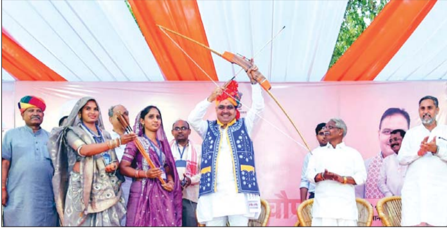
मुख्यमंत्री भजनलाल शर्मा ने बुधवार को बाँसवाड़ा के कुशलागढ़ स्थित चुड़ादा गाँव में ग्राम विकास चौपाल कार्यक्रम में भाग लिया। इस अवसर पर आदिवासी बंडी (जैकेट) एवं तीर-कमान भेंटकर मुख्यमंत्री का अभिन्दन किया गया।

बाँसवाड़ा/जयपुर, 20 मई। मुख्यमंत्री भजनलाल शर्मा ने बुधवार को बाँसवाड़ा के कुशलागढ़ स्थित चुड़ादा गाँव में ग्राम विकास चौपाल कार्यक्रम में राजीविका से जुड़ी महिलाओं से संवाद किया। उन्होंने कहा कि राजीविका महिला सशक्तिकरण का रोल मॉडल है। इसके माध्यम से गाँव