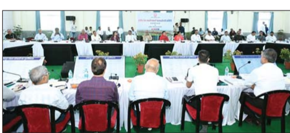
रेल उपभोक्ता परामर्शदात्री समिति की बैठक जयपुर प्रधान कार्यालय में आयोजित हुई।