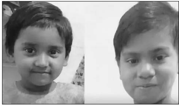
मृतक बच्चियों की फाइल फोटो।

अलवर, (निर्स)। अलवर शहर में खेलते-खेलते 2 बहनों कार में बंद हुई और अंदर बंद हो गई। गेट नहीं खुलने के कारण दोनों बच्चियों का दम घुट गया। कुछ देर बाद परिजनों ने तलाश की तो कार में बेहोशी की हालत में मिली। आसपास के लोगों की मदद से उन्हें जिला अस्पताल ले जाया गया, जहां डॉक्टरों ने उनको मृत घोषित कर दिया। मामला खुदनपुरी इलाके का है। घटना का सीसीटीवी फुटेज भी सामने आया है, जिसमें दोनों बच्चियां कार के अंदर जाती दिखाई दे रही हैं।