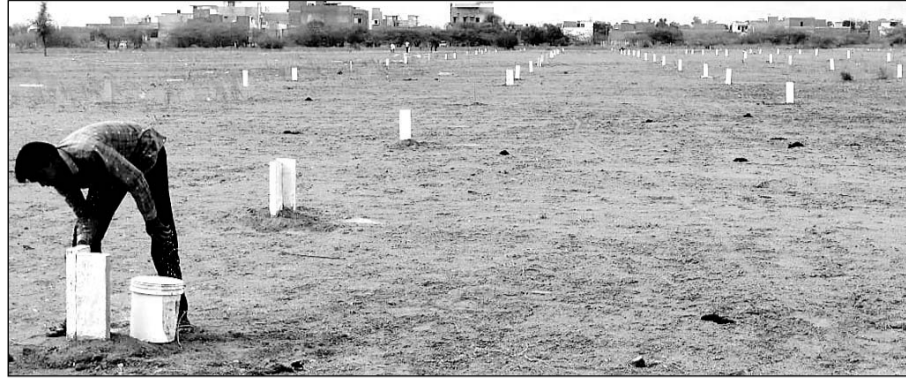
जालोर में बिना भू-रूपानांतरण के कृषि भूमि पर प्लांटिंग की गई।

जालोर में प्रशासनिक उदासीनता के चलते जालोर शहर के आसपास कृषि भूमि पर भू-माफियाओं द्वारा नियम विरुद्ध बिना किसी प्रकार से भू-रूपानांतरण किये कॉलोनियां काटकर भूखण्ड बेचे जा रहे हैं। जबकि राज्य सरकार के आदेशानुसार बिना भू-रूपानांतरण किये किसी भी प्रकार से कृषि भूखण्ड पर कॉलोनियां नहीं काटी जा सकती है। वहीं कृषि भूखण्ड पर कॉलोनियां काट कर उसकी बेचाननामा