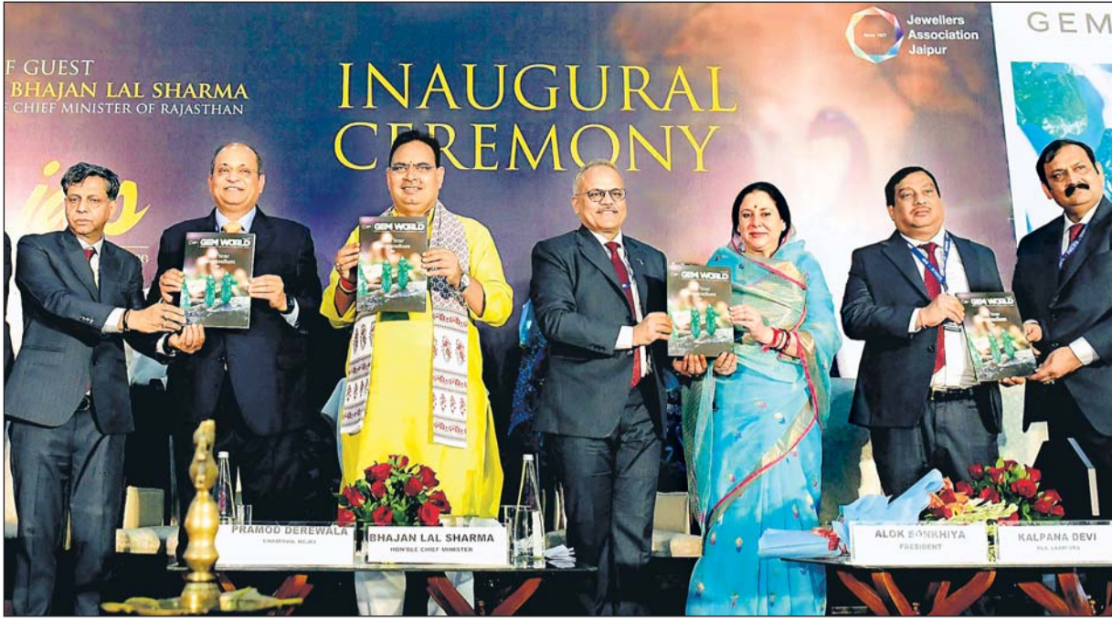
मुख्यमंत्री भजनलाल शर्मा ने शुक्रवार को सीतापुरा में जूलरी एसोसियन द्वारा आयोजित "जस-2024" का उद्घाटन किया।