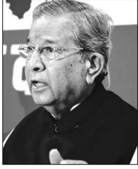
सांसद घनश्याम तिवाड़ी

-कार्यालय संवाददाता- जयपुर। राज्यसभा सांसद घनश्याम तिवाड़ी ने कहा कि "पूर्व मुख्यमंत्री अशोक गहलोत से कांग्रेस का आलाकमान पीछा छुड़ाना चाहता है। क्योंकि राजस्थान की जनता से 3 बार उनकी सरकार को हिलाया है। गहलोत के कार्यकाल में भ्रष्टाचार का रिकॉर्ड बना था। पेपरलीक से लेकर जल जीवन मिशन के घोटालों की गुंज पूरे प्रदेश के साथ-साथ देशभर में है। जे.जे.एम. घोटाले में कांग्रेस के मंत्री से लेकर अधिकारी तक जेल की सलाखों के पीछे हैं।"