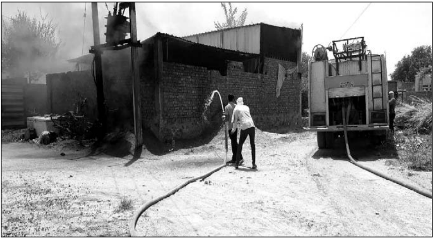
मौके पर पहुंची दमकलों ने मशकत के बाद आग पर काबू पाया।

प्रत्यक्षदर्शियों के अनुसार, आग लगने की शुरुआत फैक्टरी के भीतर चल रहे वैलिंग कार्य के दौरान हुई। वैलिंग से निकली चिंगारी पास ही रखे लकड़ी के ईंधन पर गिर गई। ज्वलनशील सामग्री होने के कारण आग ने देखते ही देखते पूरी फैक्टरी को अपनी चपेट में ले लिया। फैक्टरी संचालकों और स्थानीय लोगों ने शुरुआत में आग पर काबू पाने का प्रयास किया, लेकिन आग इतनी तेजी से फैली कि उनके तमाम प्रयास विफल