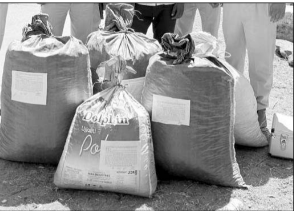
पुलिस थाना चारभुजा व डीएसटी टीम ने डोडा-चूरा जब्त किया।