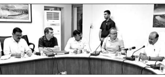
न्यूनतम समर्थन मूल्य पर गेहूं खरीद की व्यवस्था को लेकर कोटा में लोकसभा अध्यक्ष ओम बिरला ने अधिकारियों की बैठक ली।

बैठक में बिरला ने मंडियों एवं सभी खरीद केन्द्रों में गेहूं खरीद का लक्ष्य बढ़ाने के निर्देश दिए। उन्होंने कहा कि एफसीआई सहित सभी खरीद एजेंसियां यह सुनिश्चित करें कि एमएसपी पर बेचने के लिए गेहूं लेकर मंडी एवं खरीद केन्द्र पर आए किसान को खाली हाथ नहीं लौटना पड़े। समर्थन मूल्य पर गेहूं बेचने में किसानों को कोई समस्या नहीं आए, अधिकारी इसका ध्यान रखें। उन्होंने निर्देश दिए कि जब तक जिले का ताल लक्ष्य पूरा न हो, कोई भी खरीद केंद्र बंद न किया जाए। बिरला ने कहा कि आगामी दिनों में गेहूं की खरीद दृगुनी होने की संभावना को देखते हुए गेहूं के उठाव एवं गोदामों में अनलॉडिंग की गति बढ़ाई जाए। उन्होंने कहा कि एफसीआई के गोदामों के बाहर गाड़ियों दो दिन से अधिक खड़ी नहीं रहे, इसके लिए एफसीआई गोदामों में लेबर बढ़ाई जाए। उन्होंने राजफैड एवं तिलमसंघ को निर्देश दिए कि एक रोक के क्षमता के गेहूं की खरीद पूरी होने पर एफसीआई अधिकारियों से समन्वय