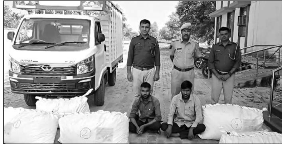
मंगरोप थाना पुलिस ने डोडा-चूरा सहित दो युवकों को गिरफ्तार किया।