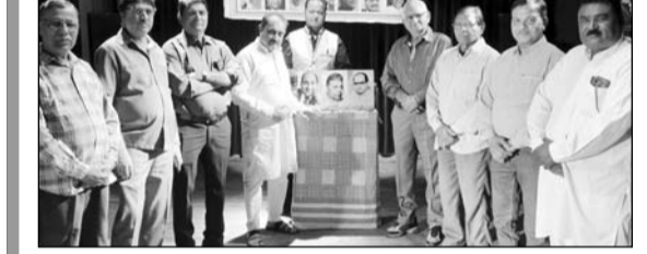
उजाले उनकी यादों में कार्यक्रम में संगीतकार चित्रगुप्त को पुण्यतिथि पर बीकानेर के गायक कलाकारों ने श्रद्धांजलि दी।