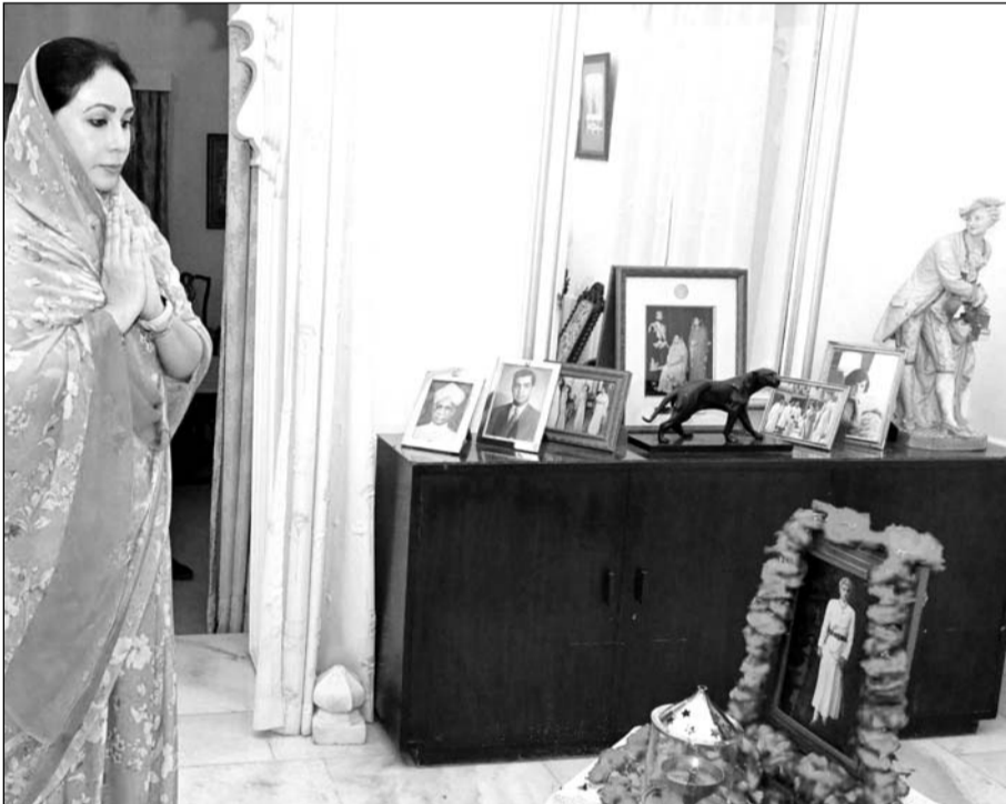
समोर बाग में दिवंगत महेंद्र सिंह मेवाड़ को उपमुख्यमंत्री दीया कुमारी ने श्रद्धासुमन अर्पित किये।

उन्होंने बातचीत के दौरान कहा कि महेंद्र सिंह मेवाड़ का हमेशा से उन पर आशीर्वाद रहा। जब मुझे राजसमंद से टिकट मिला, तब भी उनका आशीर्वाद लेने के लिए उदयपुर आई थीं और उस दौरान आशीर्वाद के साथ बहुत सहयोग रहा। उनके निधन के बाद उनकी कमी सबको खलेगी। दीया कुमारी ने यह भी