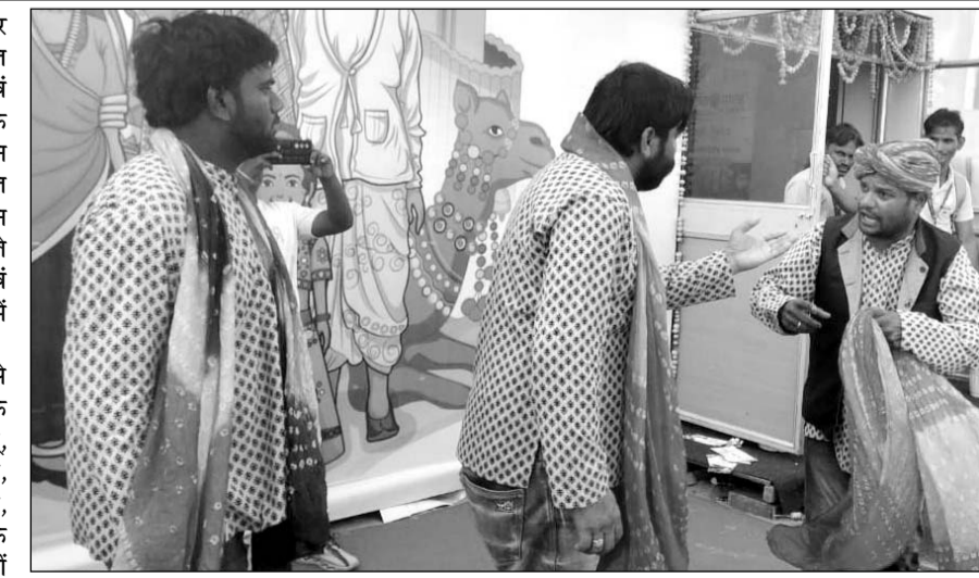
नशा मुक्त भारत अभियान के तहत नुककड़ नाटक का आयोजन हुआ।

इन नुककड़ नाटकों के माध्यम से आमजन को नशे के खिलाफ जागरूक किया गया और लोगों को तंबाकू, बीड़ी, गुटखा, जर्दा, सिगरेट, अफीम, गांजा, शराब से होने वाले सामाजिक, आर्थिक, स्वास्थ्य, पारिवारिक नुकसान के बारे में बताया गया। वहीं किस तरह इस नशे को छोड़कर स्वस्थ समाज व स्वस्थ परिवार स्वस्थ राष्ट्र का निर्माण कर सकते हैं तथा निर्माण में अपना योगदान दे सकते हैं इसके