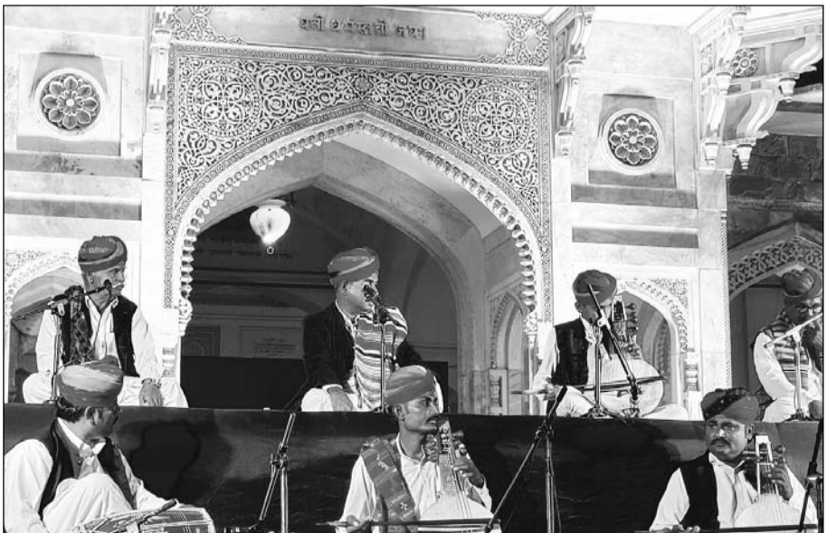
"कल्चरल डायरीज श्रृंखला" के तहत रामनिवास बाग स्थित अल्बर्ट हॉल पर शनिवार को दो दिवसीय सांस्कृतिक संध्या का आयोजन किया गया।

जयपुर। रामनिवास बाग स्थित अल्बर्ट पर शनिवार की शाम जैसे-जैसे ढलने लगी, जैसे-जैसे पश्चिमी राजस्थान के विश्वप्रसिद्ध लंगा-मांगणियार कलाकारों का गायन-वादन श्रोताओं के सिर चढ़कर बोला। बाड़मेर-जैसलमेर क्षेत्र के प्रसिद्ध लंगा-मांगणियार कलाकारों ने गायन-वादन की प्रस्तुतियों से वातावरण गुंजायमान कर दिया। लोक गायकी के इन सुरीले हुनरबाज कलाकारों ने अपनी मधुर स्वर लहरियों से श्रोताओं मंत्रमुग्ध कर दिया। गायन वादान के बेहतरीन संयोजन से श्रोतागण झूम उठे। वंस मोर की ध्वनियों हर प्रस्तुति के बाद गुंजने लगी। दर्शकों की डिमांड पर प्रसिद्ध लोक गीत "निम्बूड़ा" की आकर्षक प्रस्तुति दी गई। इन कलाकारों ने एक से एक अद्भुत लय ताल के साथ कर्णाप्रिय गीतों से कल्चरल डायरीज के फर्नो पर यादगार छाप छोड़ दी।