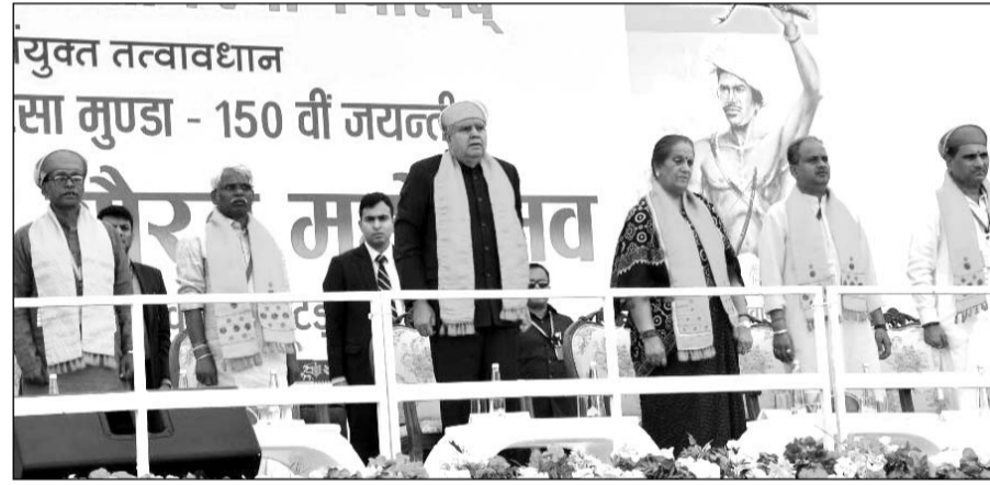
कोटडा में भगवान बिरसा मुंडा की जयंती कार्यक्रम में उपराष्ट्रपति जगदीप धनखड़ शामिल हुये।