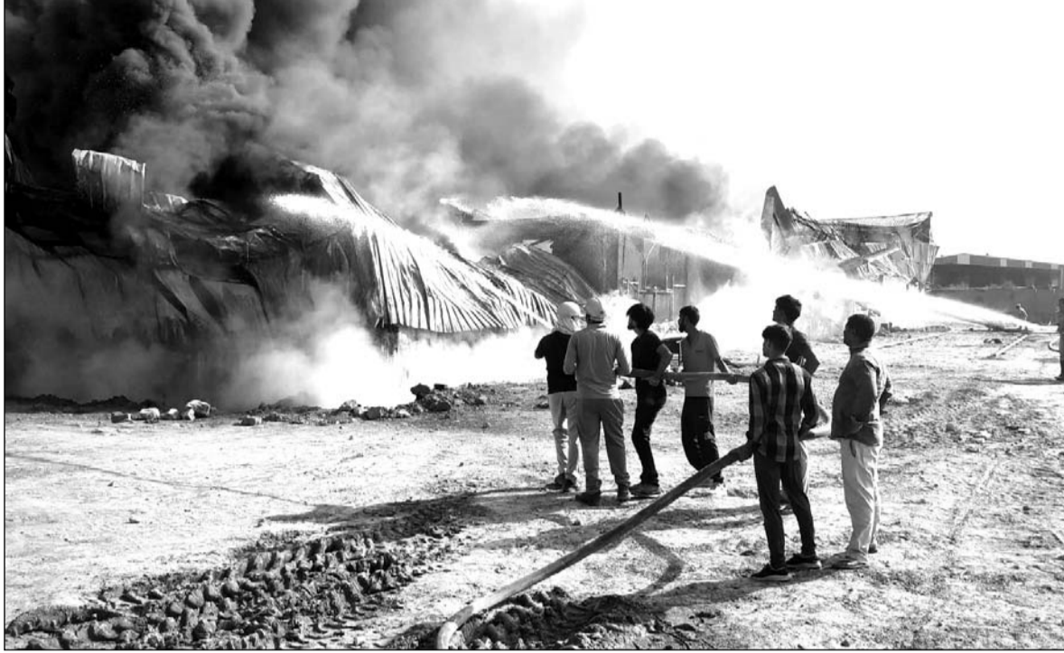
जयपुर, शाहपुरा, आमेर, चौमूं, कोटपुतली, विराटनगर सहित कई स्थानों से दमकल को बुलवाकर आग पर काबू पाने का प्रयास किया।