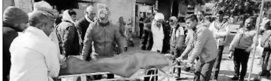
करौली में मोटरसाइकिल और ट्रैक्टर ट्रोली की भिड़ंत में घायल हुए व्यक्ति को उपचार के लिए अस्पताल में भर्ती कराया।

करौली (नि.स.) कैलादेवी मार्ग स्थित एनएच 23 पर गदका की चौकी के पास ट्रैक्टर ट्रॉली ने मोटरसाइकिल को टक्कर मार दी। दुर्घटना में मोटरसाइकिल सवार एक युवक की मौत हो गई। जबकि एक अशेड घायल हो गया। मृतक का शव करौली अस्पताल में लाया गया जहा चिकित्सको ने पोस्टमार्टम कर शव परिजन को सुपुर्द कर दिया जबकि घायल का उपचार कर रहा है। घटना