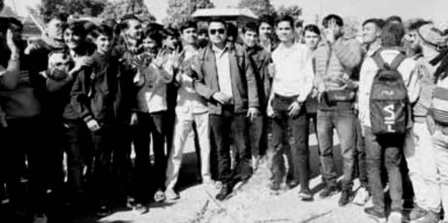
करोली कलेक्ट्रेट सर्किल पर पुनःपरीक्षा कराने की मांग को लेकर प्रदर्शन करते छात्र।

करोली (नि.स.)। करोली राजकीय महाविद्यालय के छात्र नेताओं ने कलेक्ट्रेट सर्किल पर प्रदर्शन कर आरपीएससी द्वारा आयोजित वरिष्ठ अध्यापक भर्ती परीक्षा सेकंड ग्रेड के सभी पेपर रद्द कर पुनः परीक्षा आयोजित कराने की मांग की।