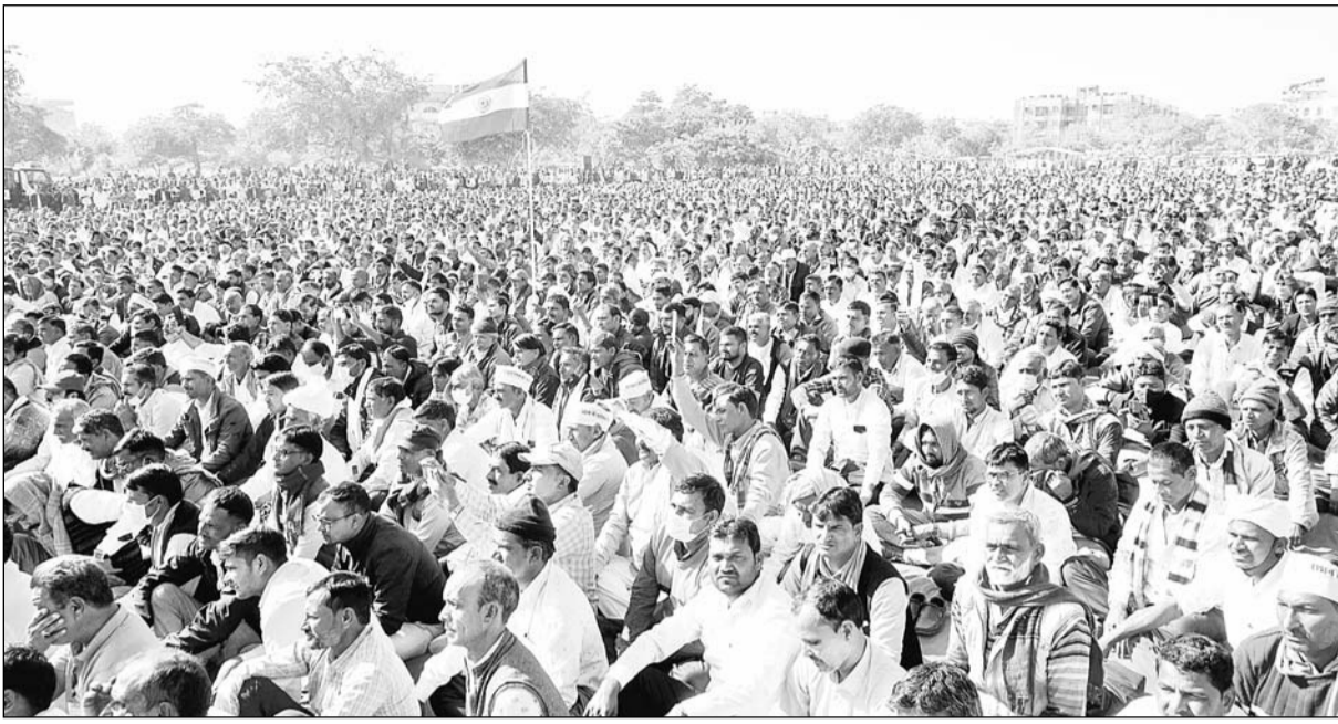
प्रदेशभर से जयपुर पहुंचे राशन डीलरों ने विद्याधर नगर स्टेडियम में महासम्मेलन के जरिये शक्ति-प्रदर्शन किया।