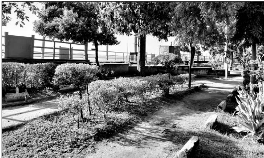
विशेष सफाई अभियान के बाद निखर उठी इरिगेशन पाल की तस्वीरें।

राजसमंद, (निसं)। करं प्रयास तो सब कुछ आसान है, मंजिल का रास्ता भी फिर गुलजार है। हौसले बुलंद हो तो रुकावटें भी झुकें, इंसान के जेब में बसी हर जीत की दरकार है। यह पंक्तियां विशेष सफाई अभियान के दौरान इरिगेशन पाल गार्डन की बदली तस्वीर पर बिल्कुल सटीक बैठती हैं। राजसमंद झील स्थित इरिगेशन पाल पर बने गार्डन में एक विशेष सफाई अभियान की दरकार थी। यहां जगह-जगह कचरा पडा था जो आखिर साफ हुआ और पाल