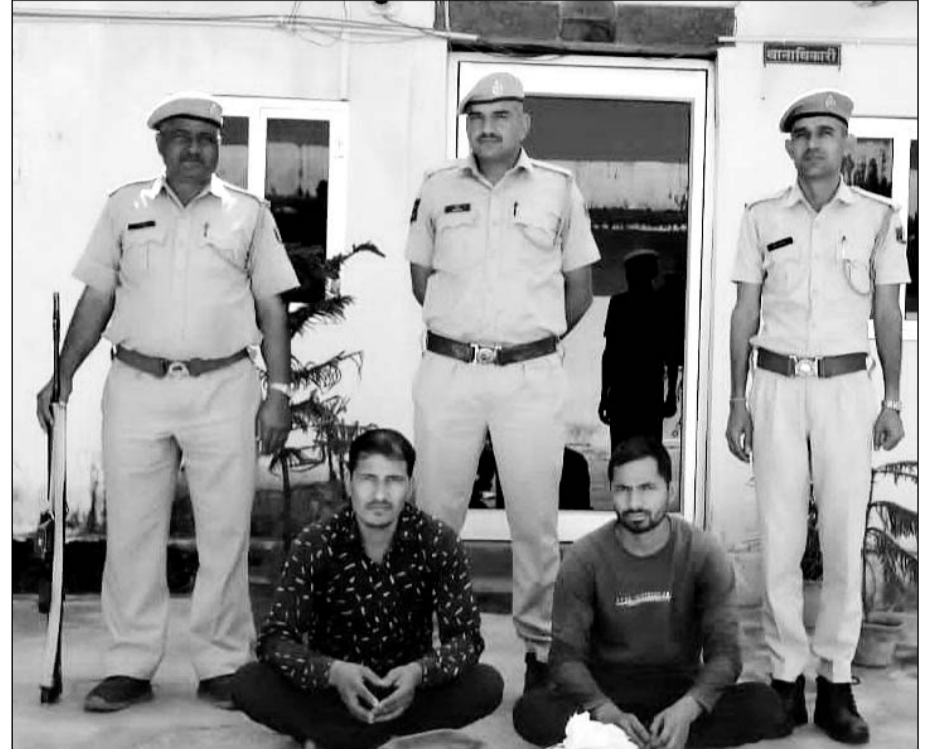
लूट की झूठी सूचना देने के मामले में दो जनों को गिरफ्तार किया।

पुलिस ने पिकअप चालक व उसके साथी को नकदी सहित गिरफ्तार किया