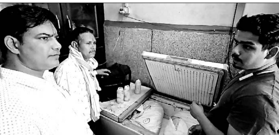
भीलवाड़ा में खाद्य सुरक्षा विभाग की टीम ने संदिग्ध मावा जप्त किया।