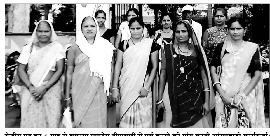
केंद्रीय मद का 6 माह से बकाया मानदेय दीपावली से पूर्व कराने की मांग करती आंगनवाडी कार्यकर्ता।