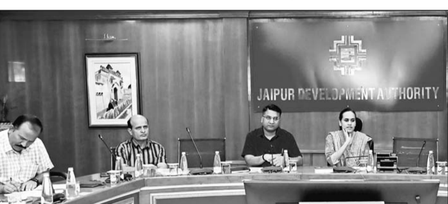
जयपुर विकास आयुक्त आनंदी ने जे.डी.ए. और एन.एच.ए.आई. के अधिकारियों की बैठक ली।

जयपुर। राजधानी जयपुर में 200 फीट अजमेर रोड से लेकर 14 नंबर सीकर रोड तक सभी अंडरपास की चौड़ाई बढ़ाने की कवायद शुरू हो गयी है। जयपुर विकास आयुक्त आनंदी ने बुधवार को इस संबंध में जेडीए और एनएचआई के अधिकारियों की बैठक लेकर चर्चा की।