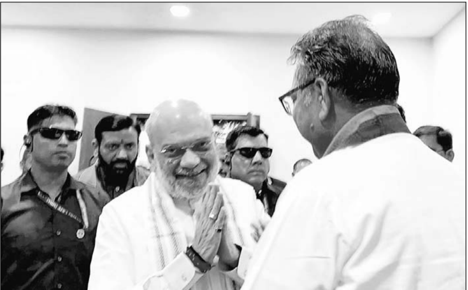
पंचकुला में हरियाणा भाजपा कार्यालय में पहुंचते ही गृह मंत्री अमित शाह ने चुनाव प्रभारी सतीश पूनिया को हरियाणा में भाजपा के प्रचंड बहुमत के लिये बधाई दी।

प्रधानमंत्री शपथ ग्रहण समारोह के लिये 17 का पंचकुला आयेंगे