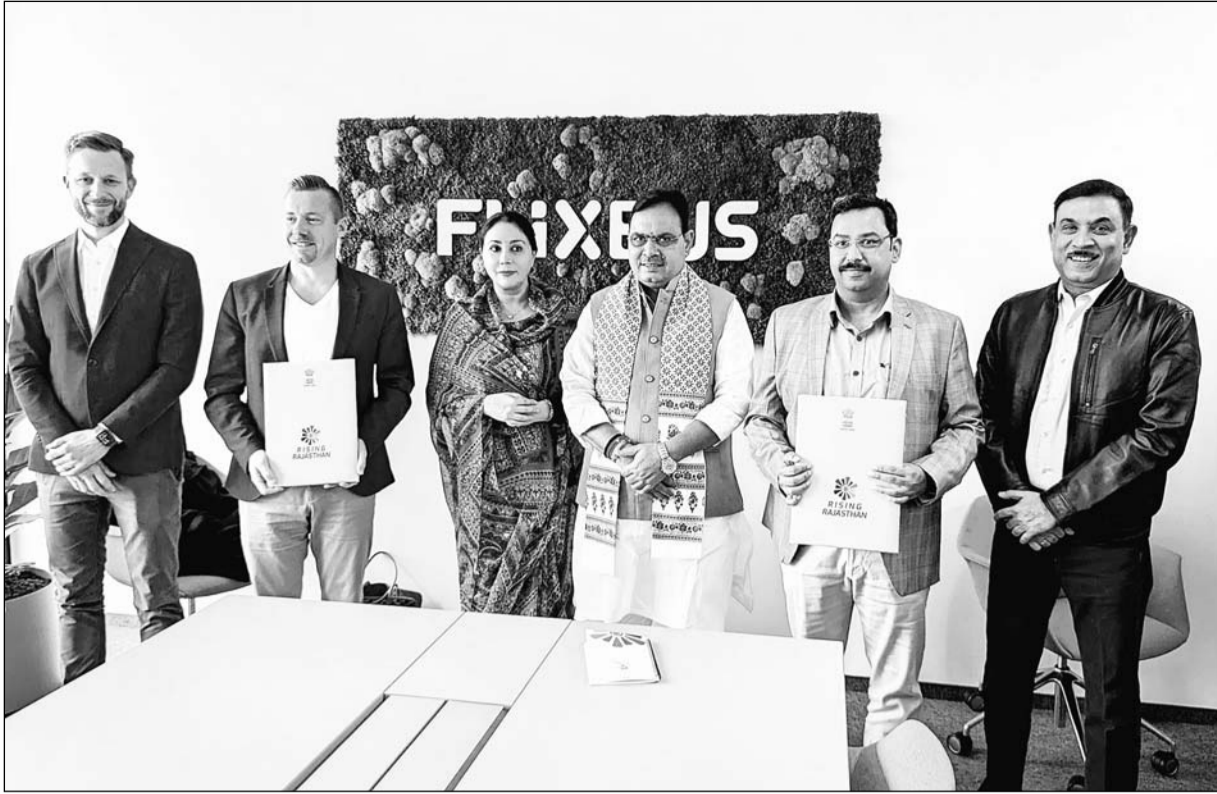
मुख्यमंत्री भजनलाल शर्मा ने म्यूनिख यात्रा में बड़ी कम्पनियों के अधिकारियों के साथ बैठकों में भाग लिया। उन्हें जर्मनी में राजस्थान के लिये निवेश आमंत्रित करने में उल्लेखनीय सफलता मिली है।