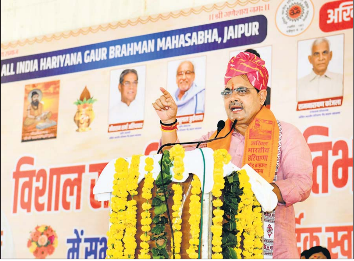
मुख्यमंत्री भजनलाल शर्मा ने अखिल भारतीय हरियाणा गौड़ ब्राह्मण महासभा के समारोह में भाग लिया। इस अवसर पर उन्होंने कहा कि ऐसे आयोजकों से प्रतिभाओं को प्रोत्साहन मिलता है।