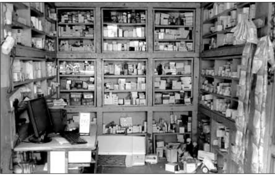
करौली अस्पताल रोड स्थित मेडिकल स्टोर में साडों ने घुसकर तोड़फोड़ की।

करौली, (निसं)। करौली जिला मुख्यालय पर इन दिनों गोवंश, आवारा साडो का आतंक चरम सीमा पर पहुंच गया है जिसके चलते कई लोग अपने हाथ पांव तुडवा बैठे हैं तो कई लोग अपनी जान भी गवा चुके हैं लेकिन जिला प्रशासन और नगर परिषद प्रशासन इस और कोई ध्यान नहीं दे रहा है।