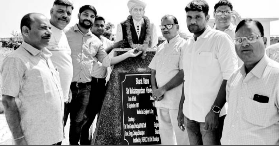
इंजीनियर्स फोरम भरतपुर के अभियंताओं द्वारा विभागीय कार्यों के साथ-साथ इंजीनियर्स डे के अवसर पर सामाजिक सेवा हेतु रक्तदान शिविर एवं विभिन्न खेलकूद प्रतियोगिताओं का आयोजन हुआ।

भरतपुर, (निसं)। महान इंजीनियर भारत रत्न सर मोक्षगुंडम विश्वसरेया के जन्मदिवस अवसर पर पूरे देश में मनाये जाने वाले इंजीनियर्स दिवस के अवसर इंजीनियर्स फोरम द्वारा कल राजकीय अभियांत्रिकी महाविद्यालय भरतपुर में मोक्षगुंडम विश्वसरेया पार्क में स्थापित विश्वसरेया की मूर्ति पर माल्यार्पण कर विभिन्न खेलकूद प्रतियोगिताओं के साथ एक विशाल रक्तदान शिविर का आयोजन किया गया। जिसमें राज्य व केंद्र के अलग-अलग विभागों के अभियंता शामिल होकर अपनी एकता एवं सामाजिक सेवा का परिचय देते हुए ऐसे महान इंजीनियर के उच्च कार्यों एवं आदर्शों को याद किया एवं सभी को आपस में शुभकामनाये दी।