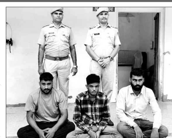
पुलिस ने हनीट्रेप मामले में तीन आरोपियों को गिरफ्तार किया।