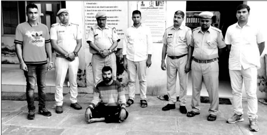
पुलिस ने 24 घंटे में नाबालिग से दुष्कर्म के आरोपी को गिरफ्तार किया।