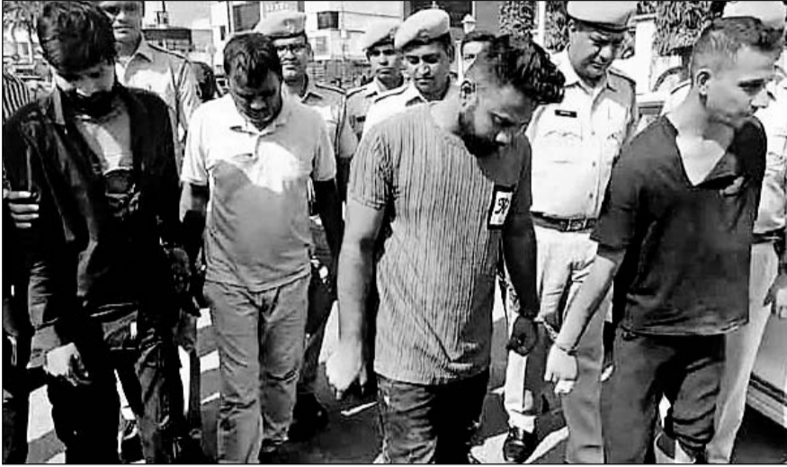
पुलिस ने अपहरण के मामले में चारों आरोपियों की अजमेर शहर में परेड कराई।