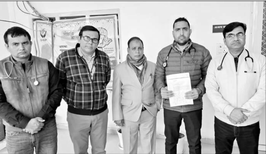
झुंझुनू जिले के 400 से अधिक सेवारत चिकित्सक सोमवार को सुबह दो घंटे की पैन डाउन हड़ताल पर रहे।

■ बाड़मेर के सेडवा में चिकित्सक के साथ अभद्र व्यवहार का मामला