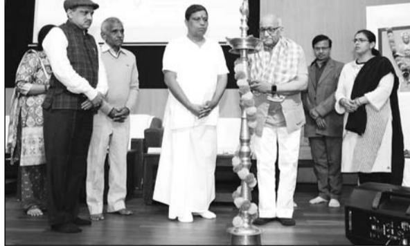
राष्ट्रीय आयुर्वेद विद्यापीठ की ओर से सोमवार को 6 दिवसीय आवासीय प्रशिक्षण कार्यक्रम 'चरकायतन' का शुभारम्भ हुआ।

विधान सभा अध्यक्ष देवनानी ने सदन में कहा कि "सदन की कार्यवाही के दौरान हॉटस्पॉट प्रयुक्त कर नेवा की ई-बुक के अतिरिक्त अन्य कोई वैबसाइट सर्फ नहीं करें। आईपैड का कैमरा ऑन कर फोटोग्राफी या वीडियोग्राफी नहीं करें। किसी प्रकार का ऑडियो सदन में प्ले नहीं करें। आईपैड पर नेटवर्क तथा चार्जिंग केवल के द्वारा हो रही है।"