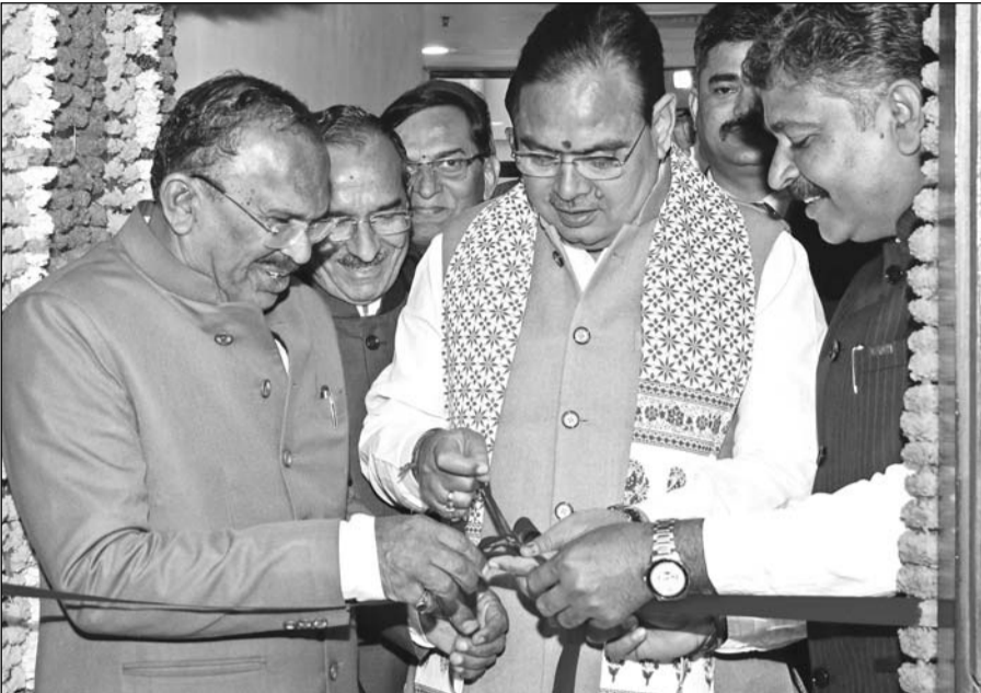
मुख्यमंत्री भजन लाल शर्मा व स्पीकर वासुदेव देवनानी ने विधानसभा में नेवा सेवा केन्द्र का उद्घाटन किया।

ई-लर्निंग कम ई-फैसिलेशन सेन्टर के रूप में कार्य करेगा नेवा सेवा केन्द्र : देवनानी