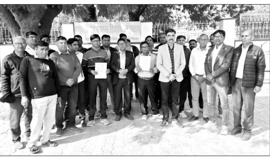
पांच सूत्री मांगों को लेकर आईटीआई संचालकों ने नारेबाजी की।