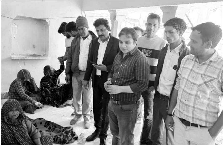
चिकित्सा विभाग की टीम ने शिविर लगाकर मरीजों का उपचार किया।