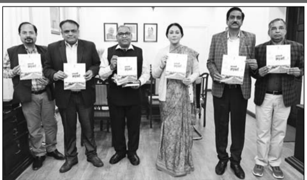
उपमुख्यमंत्री दिया कुमारी ने सोमवार को "आपणी सड़कां...एक मात्र संकल्प: गुणवत्तापूर्ण निर्माण" पुस्तिका का विमोचन किया।