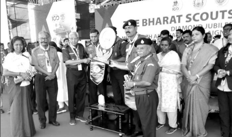
तमिलनाडु के शिक्षा मंत्री ने राजस्थान दल के पदाधिकारी को सर्वोच्च अवार्ड की शील्ड एवं पताकाएं प्रदान कर सम्मानित किया